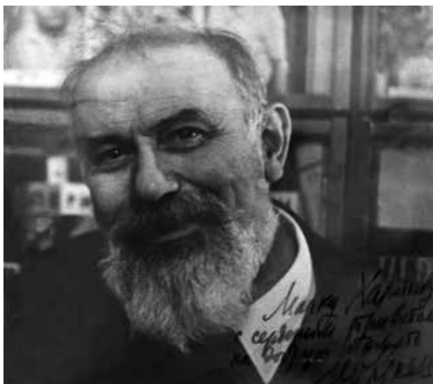
17. Лев Копелев