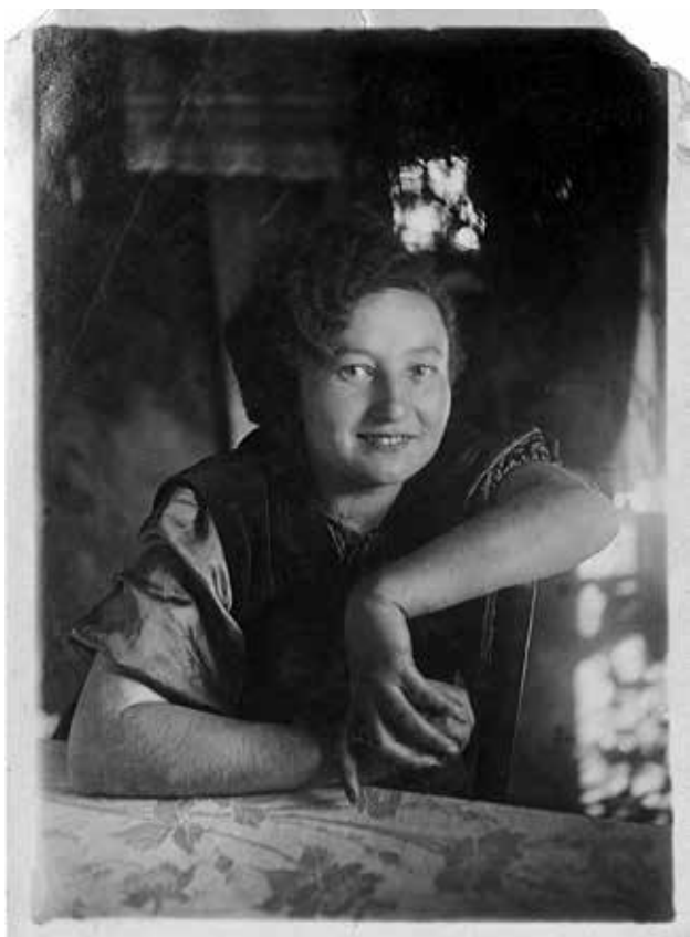
7. Мама. 1936