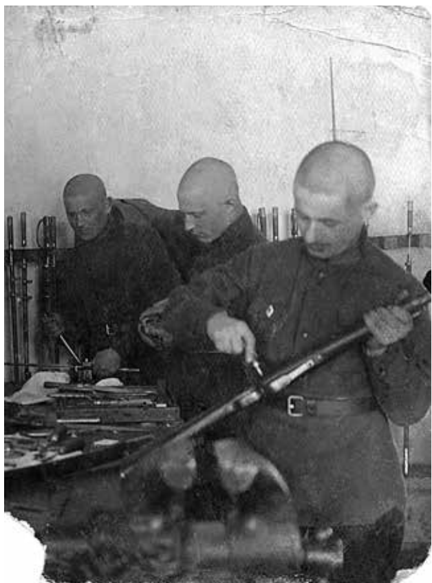
8. Папа в армии (справа). 1932. (Оружейная мастерская, ударная бригада)