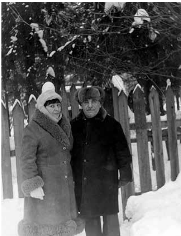
19. Семен Липкин и Инна Лиснянская. 1988