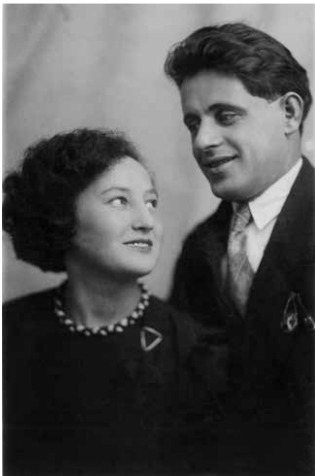
II. Папа и мама. Москва. 1937