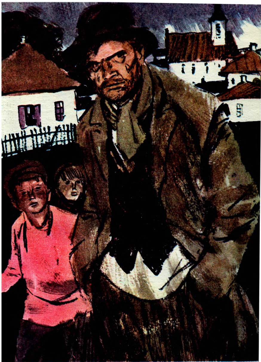
«В ДУРНОМ ОБЩЕСТВЕ.»