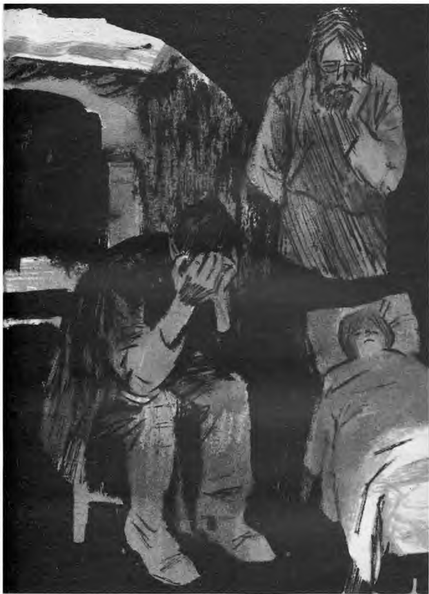
«В ДУРНОМ ОБЩЕСТВЕ.»