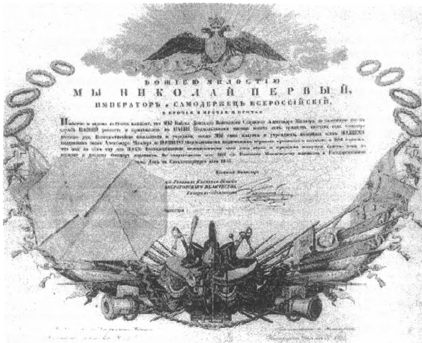
Патент на чин подполковника Александра Федоровича Миллера. 15 октября 1837 г.

Воспитывался в Новочеркасской гимназии, и окончил курс наук с отличием. 31 мая 1805 г. был записан в службу с чином урядника, фактически начал ее с 1 января 1810 г. при Новочеркасской полиции; 4 марта 1810 г. произведен в хорунжие; до 1 мая 1817 г. состоял при Воевской Строительной комиссии, когда был переведен в полк Бегидова, несший кордонную службу в Бессарабии по реке Прут; 12 октября 1821 г. произведен в сотники; 16 апреля 1823 г. — в есаулы; 7 ноября 1823 г. назначен адъютантом при Войсковом Атамане; с 7 июня 1824 г. по 1 января 1828 г. состоял войсковым есаулом при Наказном атамане; с 15 января 1828 г. в Атаманском полку; принял вместе с полком участие в войне 1828—1829 гг. с турками; за отличия в делах 29 апреля—1 мая 1828 г. при крепости Браилов награжден орденом Св. Анны 3-й степени с бантом, 14 августа 1828 г. под Шумлой был контужен ядром в ногу и голову; был награжден серебряной