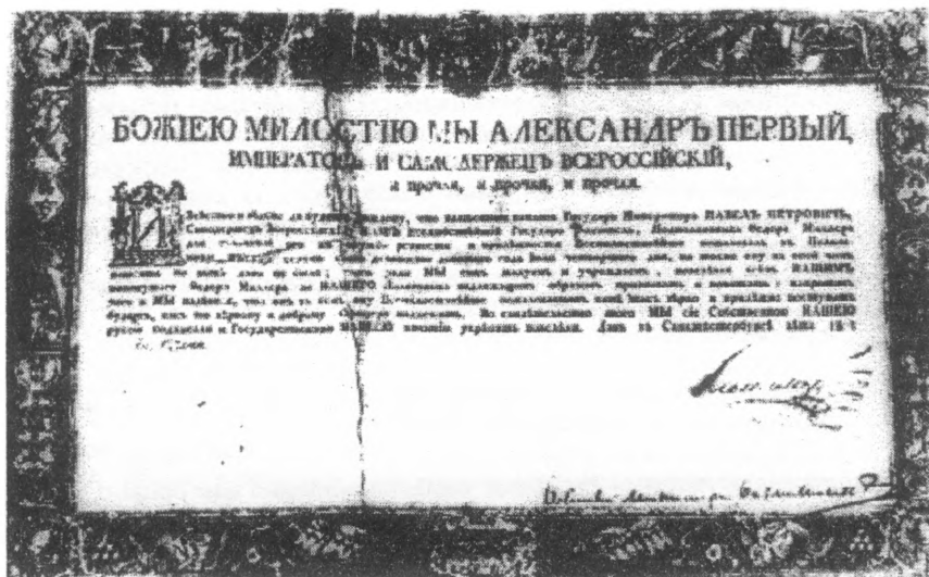
Патент на чин полковника Федора Ивановича Миллера. 18 мая 1803 г.