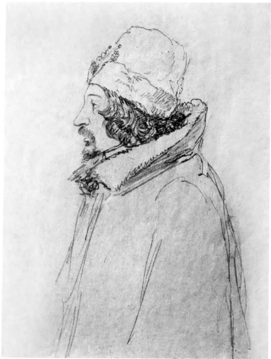
А.С. Хомяков в мурmolке. Бумага. Карандаш. ИРЛИ