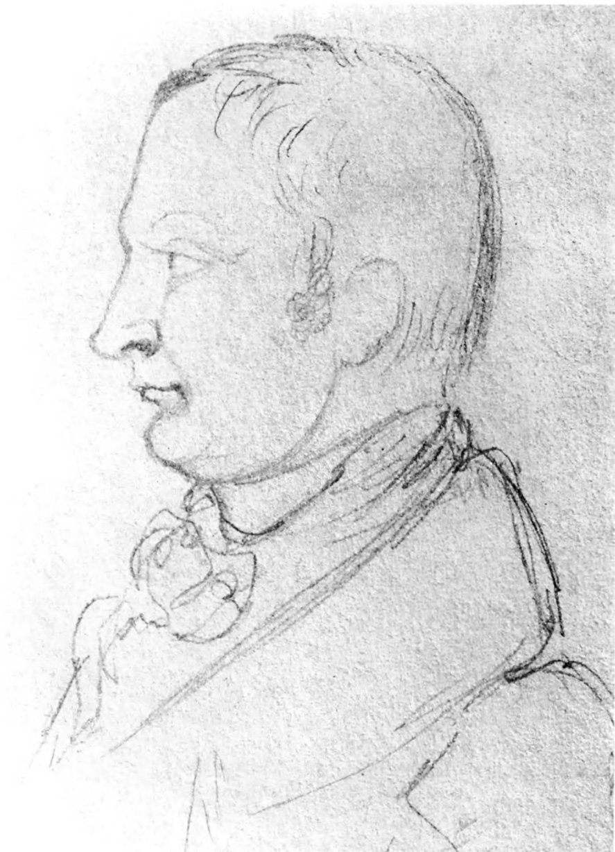
И.В. Киреевский. Эскиз портрета работы Э.А. Дмитриева-Мамонова. Карандаш.