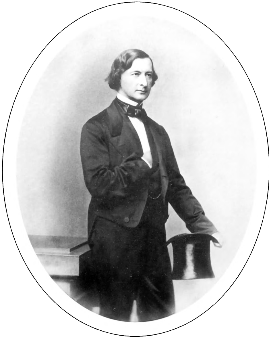
Ю.Ф. Самарин. ИРЛИ