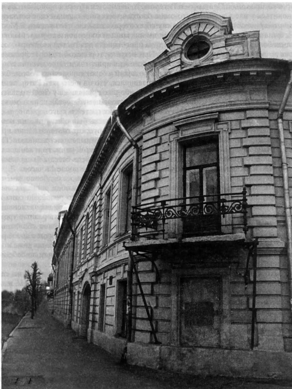
Дом А.И. Кошелёва в Москве. Современный вид