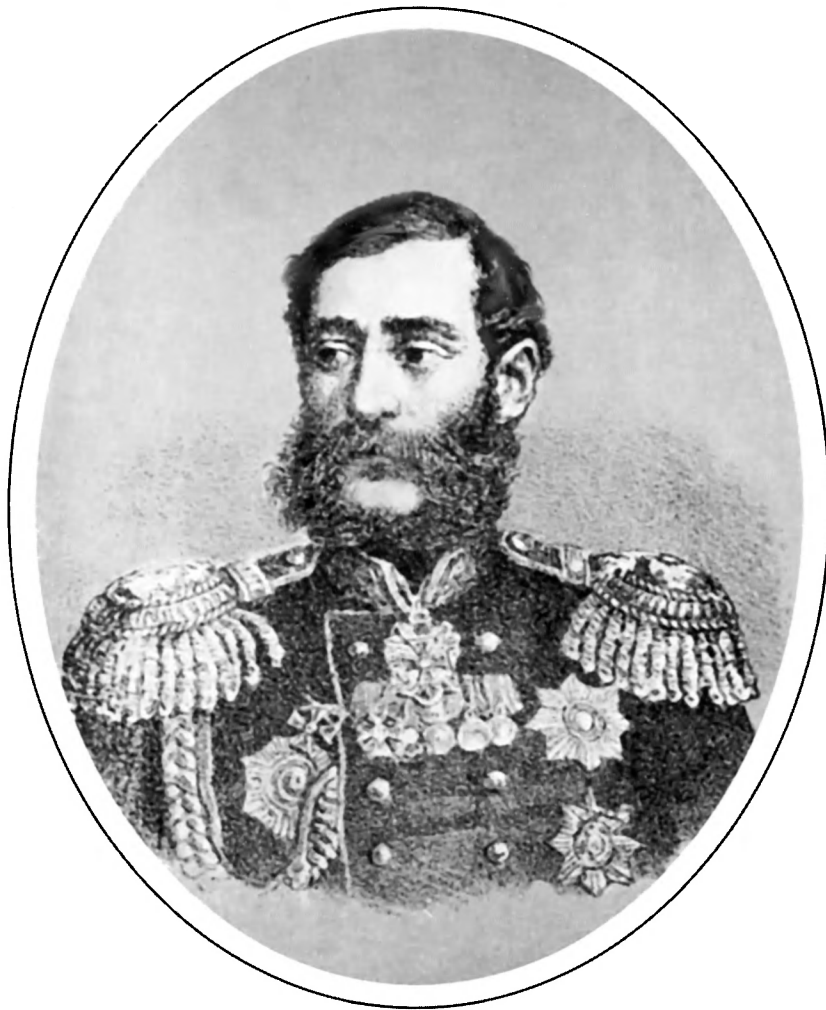
М.Т. Лорис-Меликов. РГАЛИ