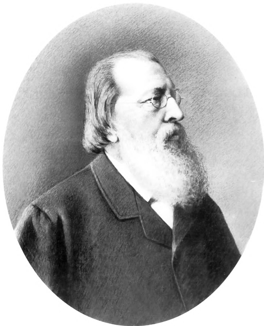
И.С. Аксаков. ИРЛИ