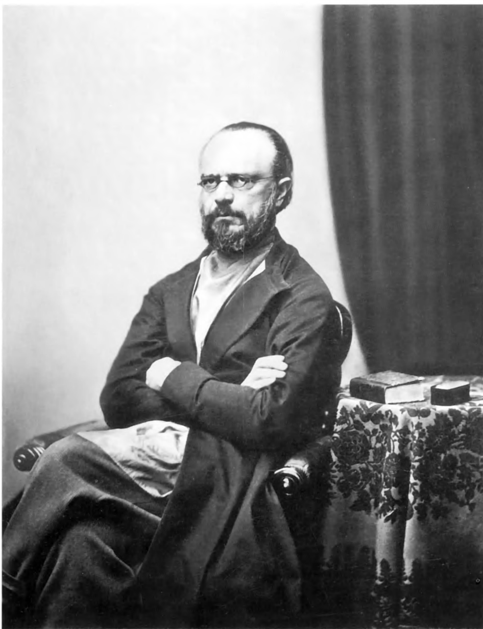
А.И. Кошелёв. ИРЛИ