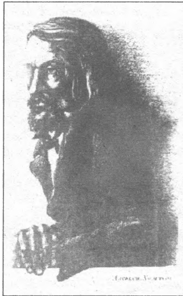
Иллюстрации Юрия Селиверстова из книги Георгия Гачева «Русская дума».

же обогатиться. У других разработана долгосрочная культурная программа. Посмотрим, чья возьмет?! Так было всегда: кто-то выпускает то, что на потребу, а кто-то проводит серьезную культурную работу.