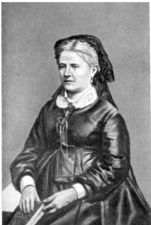
Е. Ф. Корвин-Круковская (1874)