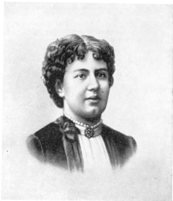
С. В. Ковалевская (1885)