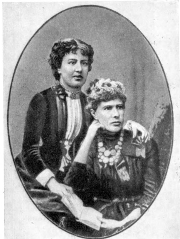
С. В. Ковалевская и А.-К. Лефлер (1885)