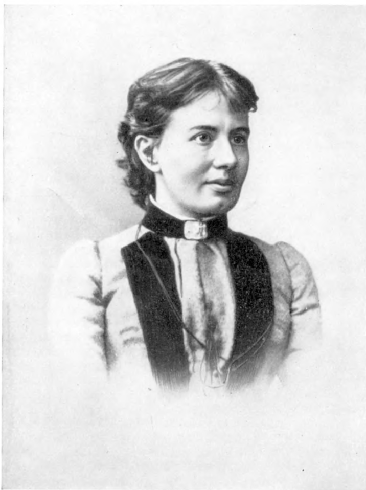
С. В. КОВАЛЕВСКАЯ