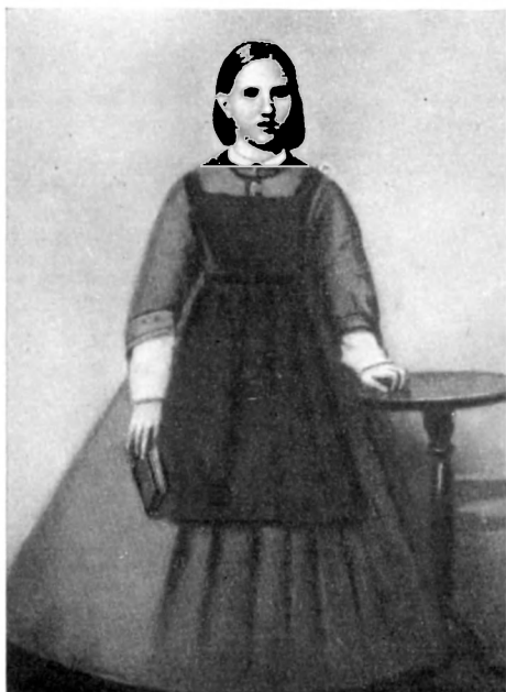
С. В. Ковалевская (1865)