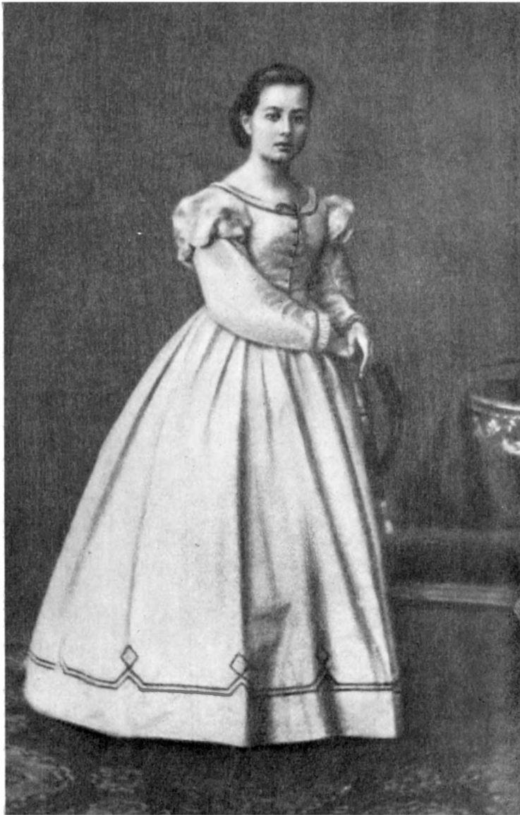
С. В. Ковалевская (1870-е годы)