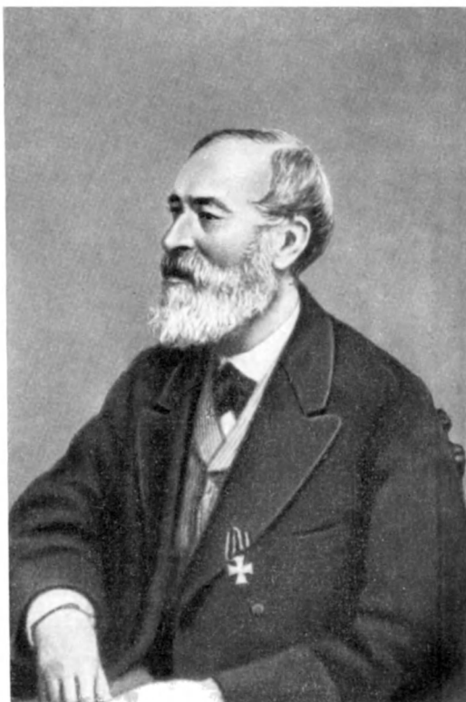
В. В. Корвин-Круковский (1874)