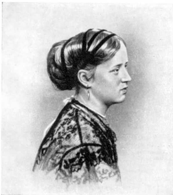
А. В. Корвин-Круковская (Жаклар) (конец 60-х годов)