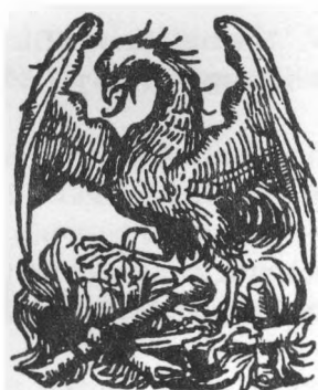
Рис. из Нюрнбергской хроники XV века.

ZAVALISHIN V. "Early Soviet Writers." New York, F.A. Praeger Publishers, 1958, pp. 41-46, 56, 57, 70, 179, 240, 308.