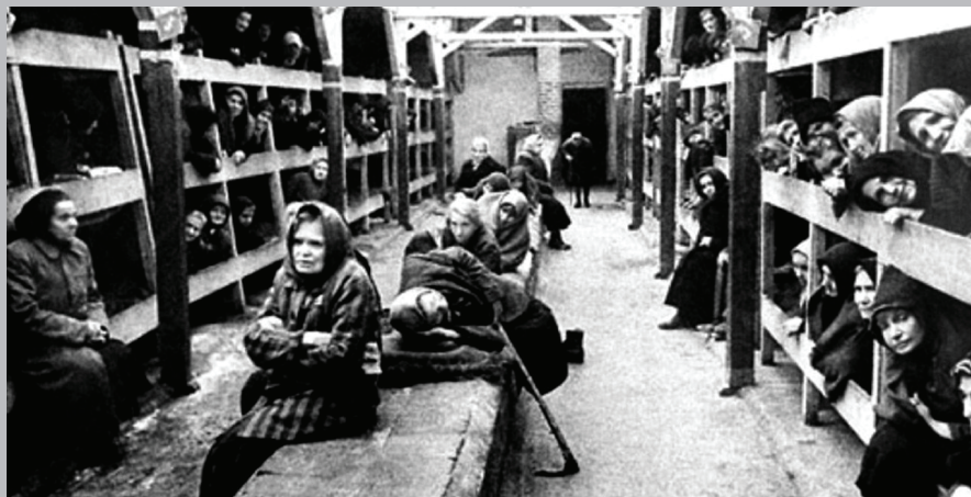
Концентрационный лагерь Равенсбрюк