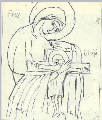
Последняя вышитая икона, Равенсбрюк