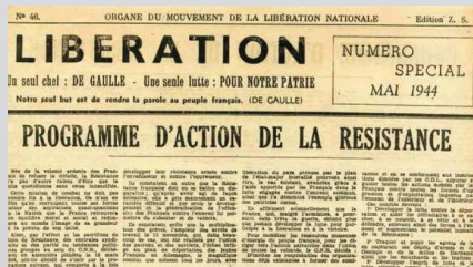
Газета Либерасьон (Освобождение)