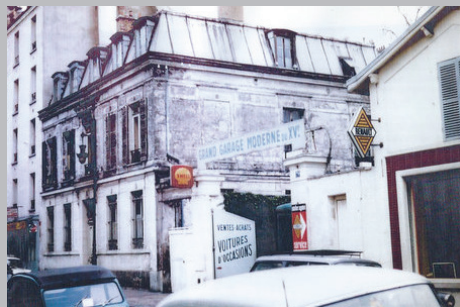
Ул. Лурмель 77, дом матери Марии