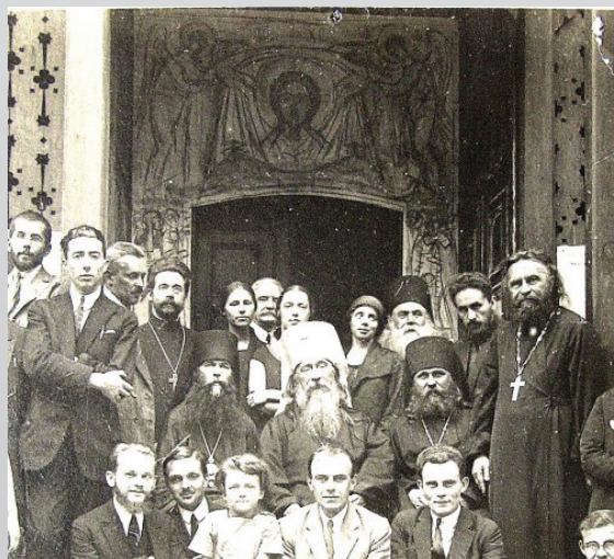
Свято-Сергиевский Богословский институт, митрополит Евлогий и преподаватели, 1926