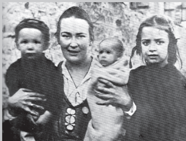
Елизавета с детьми