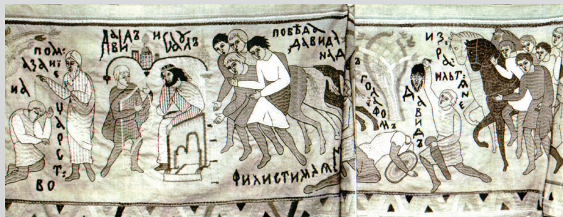
Житие царя Давида, вышивка матери Марии