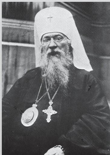
Митрополит Евлогий, 1930