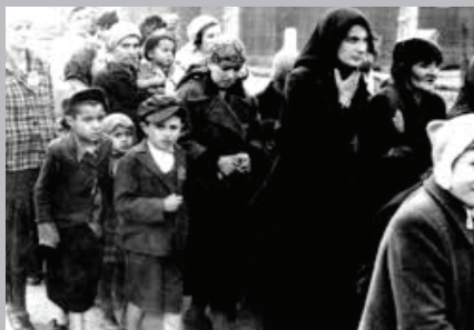
Операция Весенний ветер