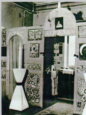
Церковь на Вилла де Сакс