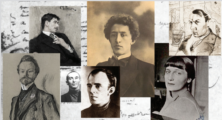
Александр Блок и поэты Серебряного века