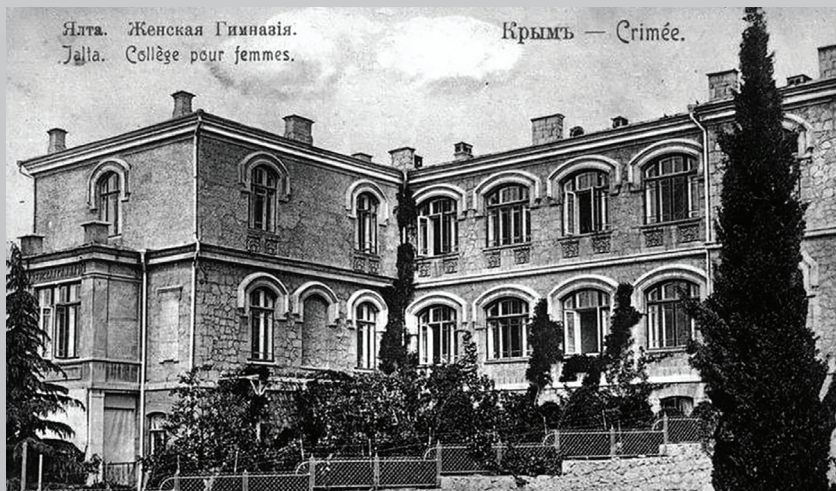
Гимназия в Ялте