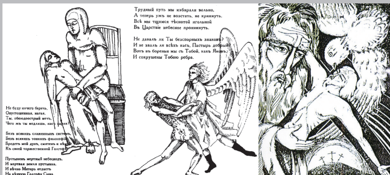
Рисунки матери Марии