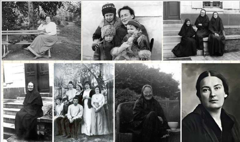
Фото: этапы жизни матери Марии