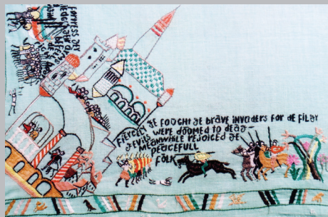
Вестник русских добровольцев, партизан и участников Сопротивления, 1947