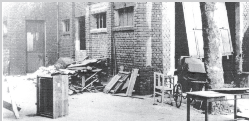
Ул. Лурмель, строительство будущей церкви