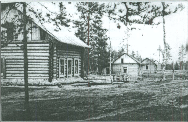
Спецпоселение Пожег Гайнского района в годы Великой Отечественной войны.