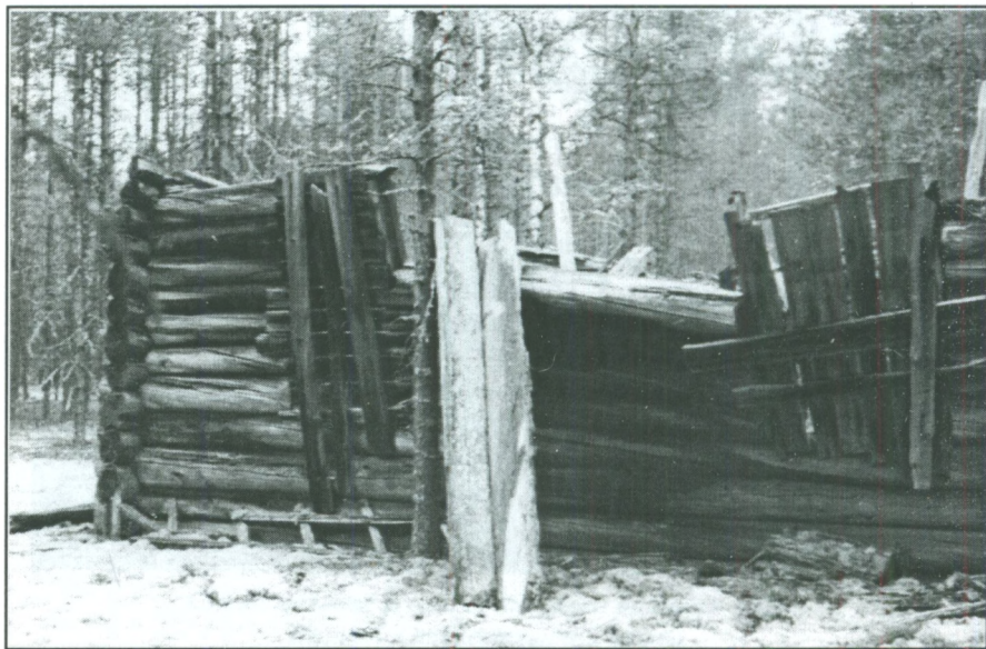
Фото Климова В. А., 2004 год