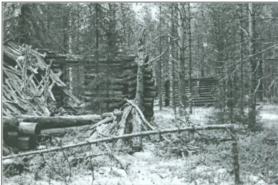
Следы бывшего "социализма". Спецпоселок Верх-Дозовка Гайнского района