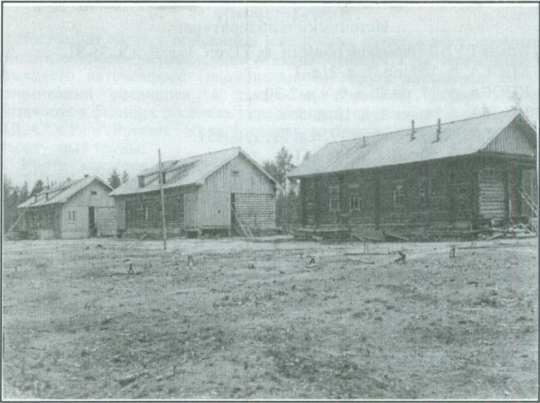
Спецпоселение Смагино (п. Усть-Черная), 1933 год