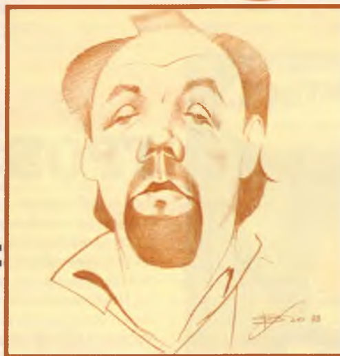
Рисунок Славы Лосева

Прогресс: вначале был простой стул, потом – электрический. Только в коллективе ничтожество обретает силу. Производительность сизифова труда увеличится, если его механизировать и автоматизировать. Чем медленнее идет поезд, тем шире просторы нашей Родины. Мир – чудесная тюрьма, но разного режима. Укажи тебе путь, так ты пойдешь другим путем. Плохие дороги требуют хороших проходимцев. После грозы дышится легко, но недолго. Первый акт защиты природы – изгнание Адама и Евы. При хороших средствах цели не нужны. Не нарушал равновесия в природе: уничтожал её равномерно. Человек – венец природы: умнее не только флоры, но и фауны. Пржевальский умер, но лошадь его живет. Эгоизм не позволяет человеку заботиться о себе разумно. Есть люди, которые не хвалят себя, потому что их хвалят другие. Согнутый жизнью смотрит на мир исподлобья. Карлик на пьедестале кажется значительнее. Если мы такие плохие, то обвиняем в этом общество, если хорошие, то хвалим себя. Рожденные ползать, Пользуйтесь услугами "Аэрофлота"! Знал ли козел отпущения, что станет предком мальчика для битья? Берегите людоедов, – они улучшают человеческую породу!