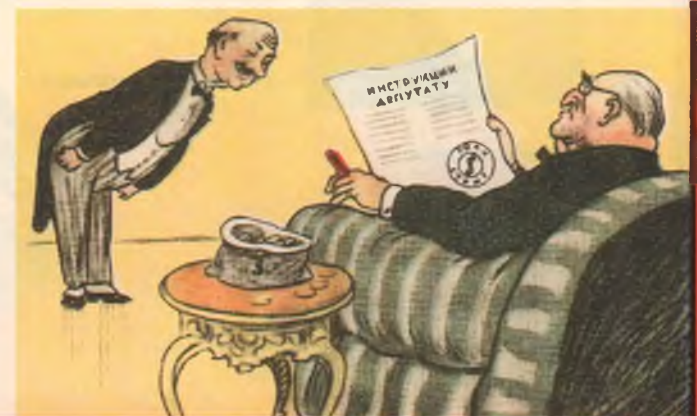
Рис. М.АБРАМОВА и И.ПРОСКУРЯКОВА

№7 Секрет здоровья нашего рубля простой – Советский строй 1950