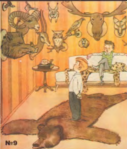
Рис. Л. САМОЙЛОВА

– Ух ты! Твой отец, наверное, знаменитый охотник? – Нет, он директор заповедника.