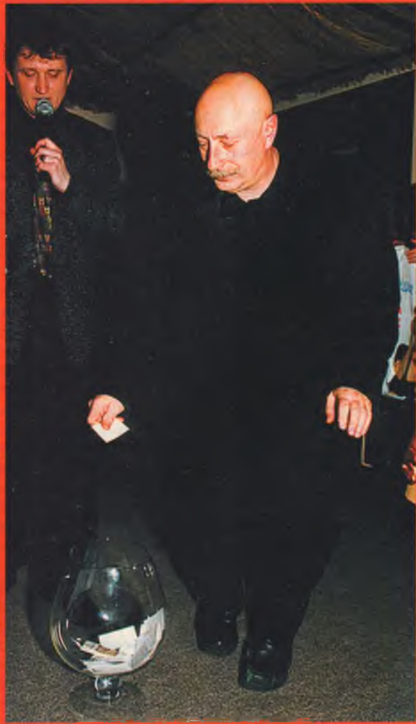
У Григория Остера оказалась легкая рука