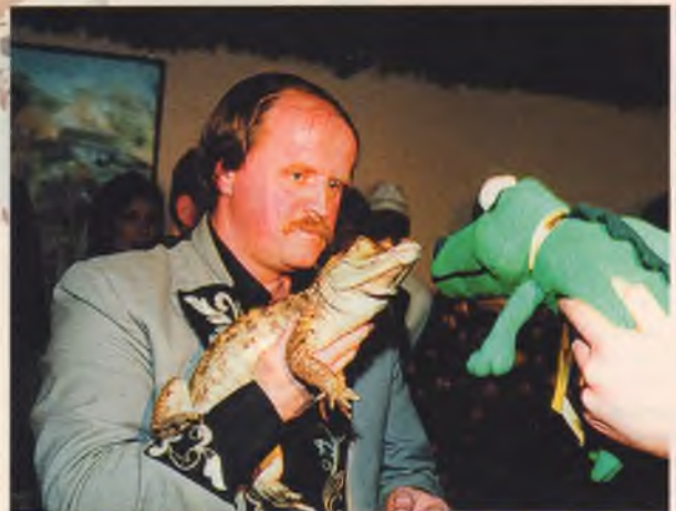
“Крокодил” крокодилу – друг, товарищ и брат