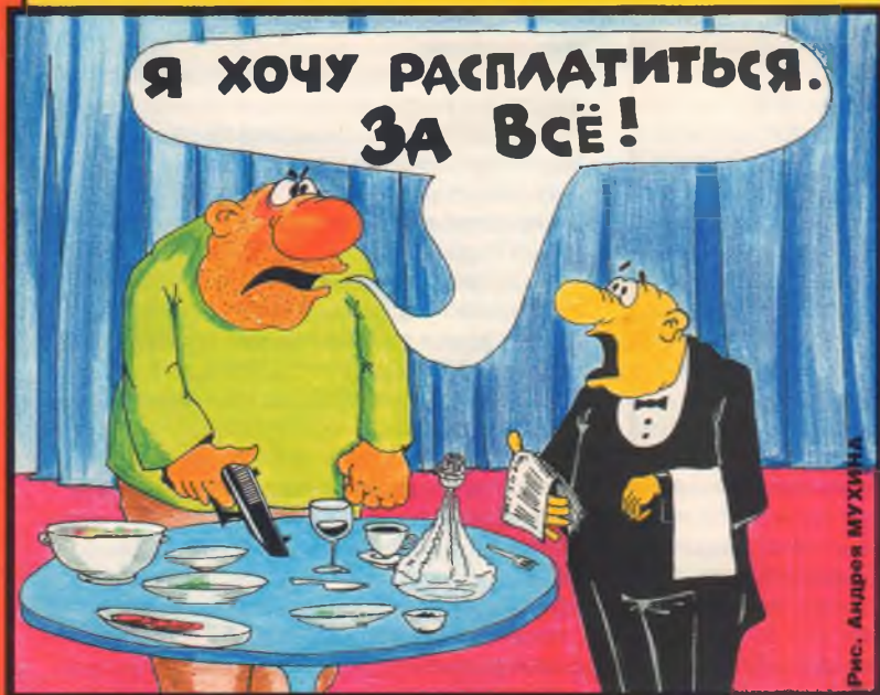
Рис. Андрей МУХИНА