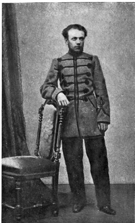
Александр Алексеевич Кропоткин 1860 г.