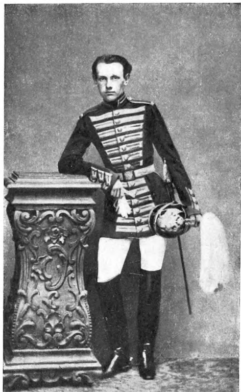
Петр Алексеевич Кропоткин (в мундире камер-пажа) 1861 г.