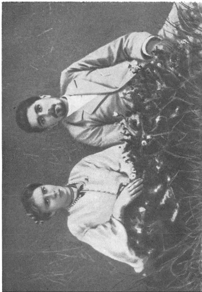
Леся Украинка и С. К. Мерзвинский (1898 г.)