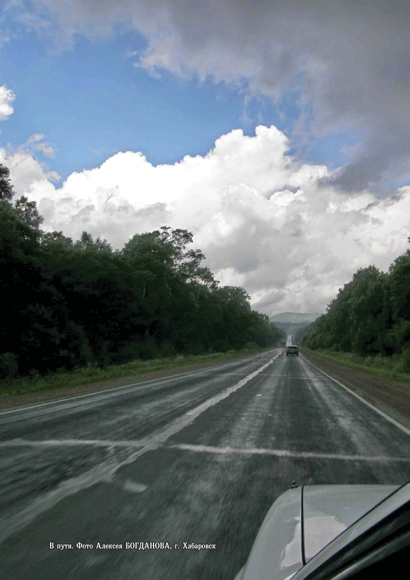
В пути.