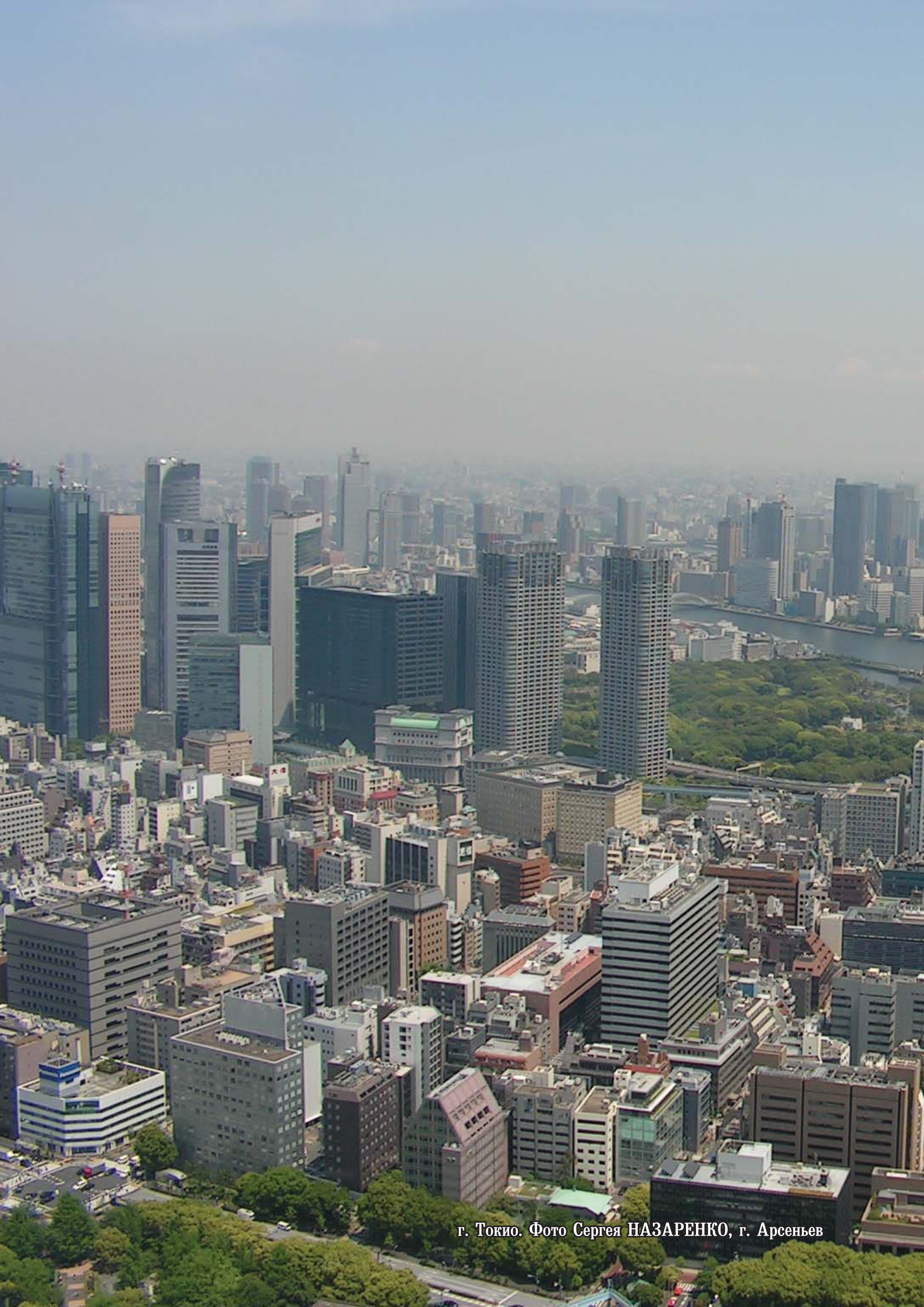
г. Токио.