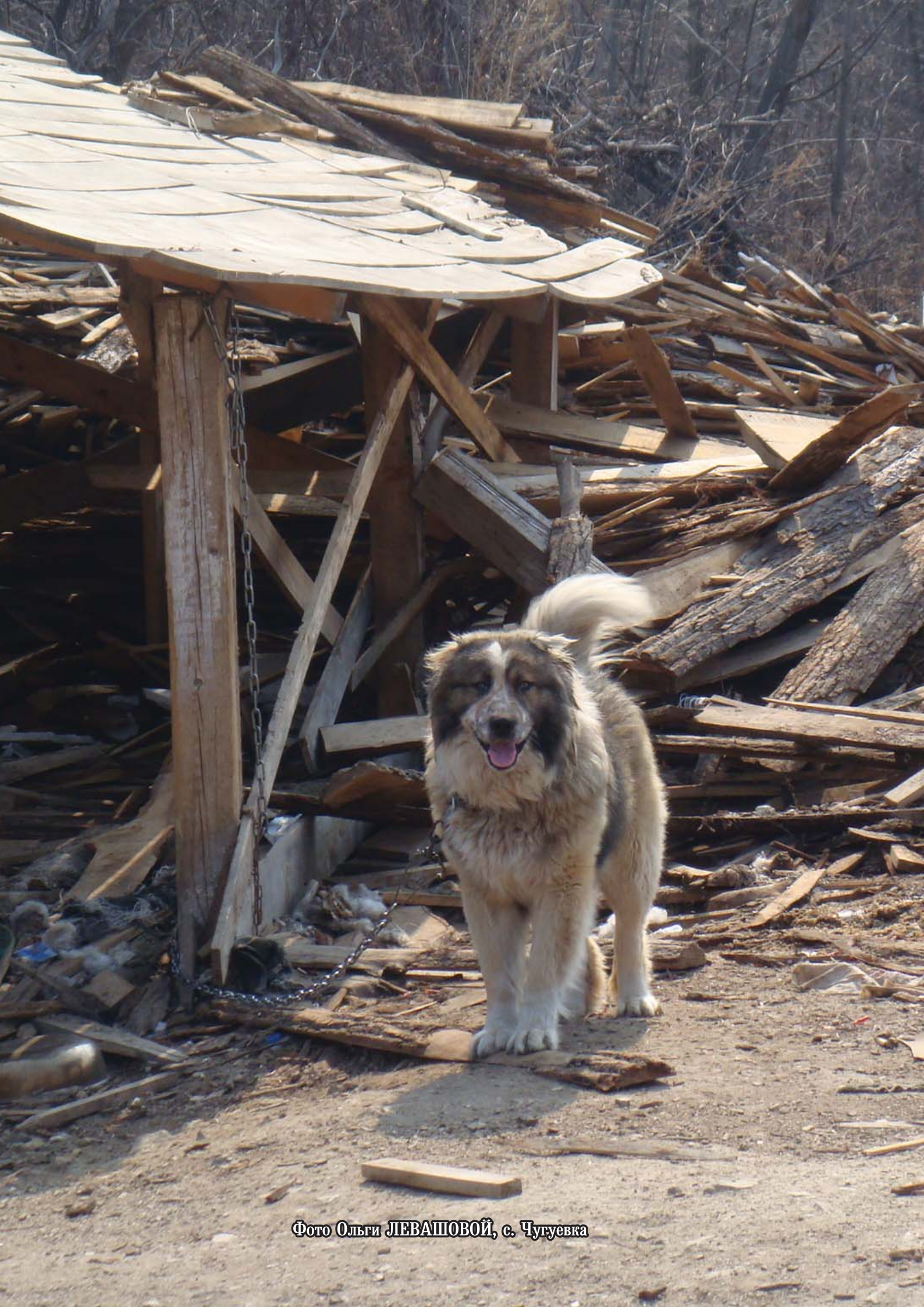
Фото Ольги ЛЕВАШОВОЙ, с. Чугуевка