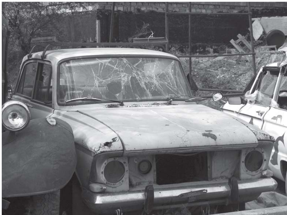
Приехали. Фото Василины ОРЛОВОЙ, г. Москва.