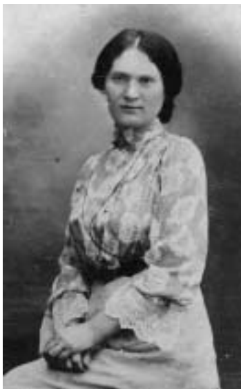
Мама в Кишиневе