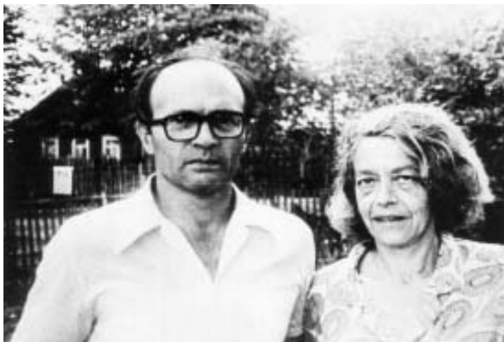
Анатолий Марченко и Лариса Богораз в Карabanове. 1980 год