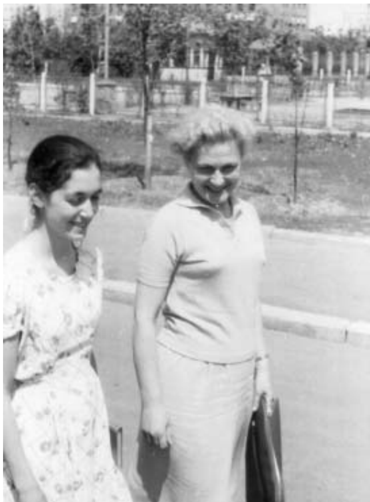
Нина и я в начале 1970-х годов