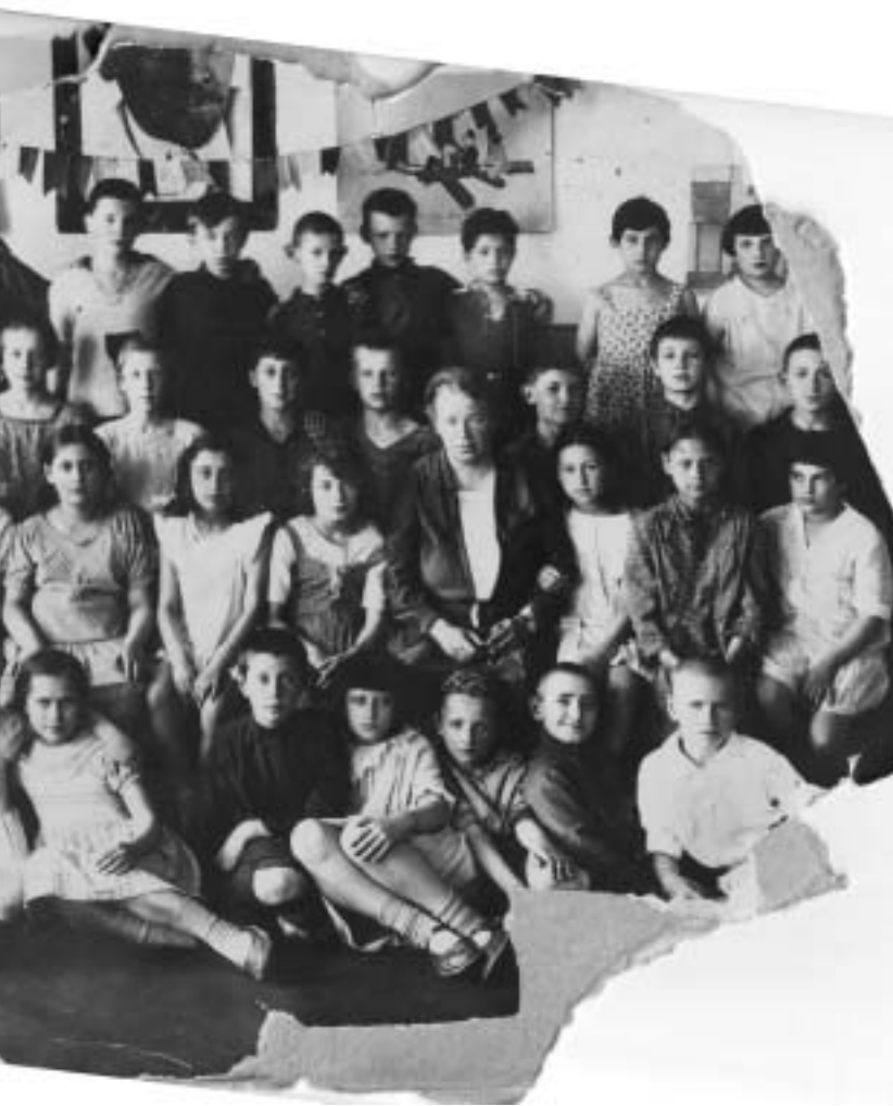
Наш 2-й класс. Я в центре, слева от учительницы