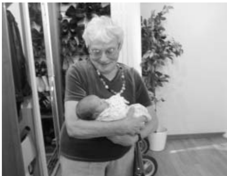
С правнучкой Дусей. 2007 год