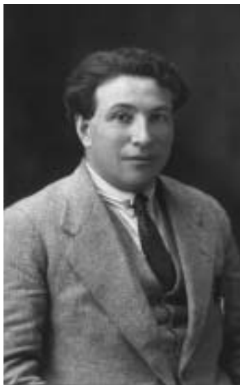
Папа в период работы в Англии от Внешторга. 1920-е годы