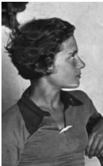
Мне пятнадцать лет