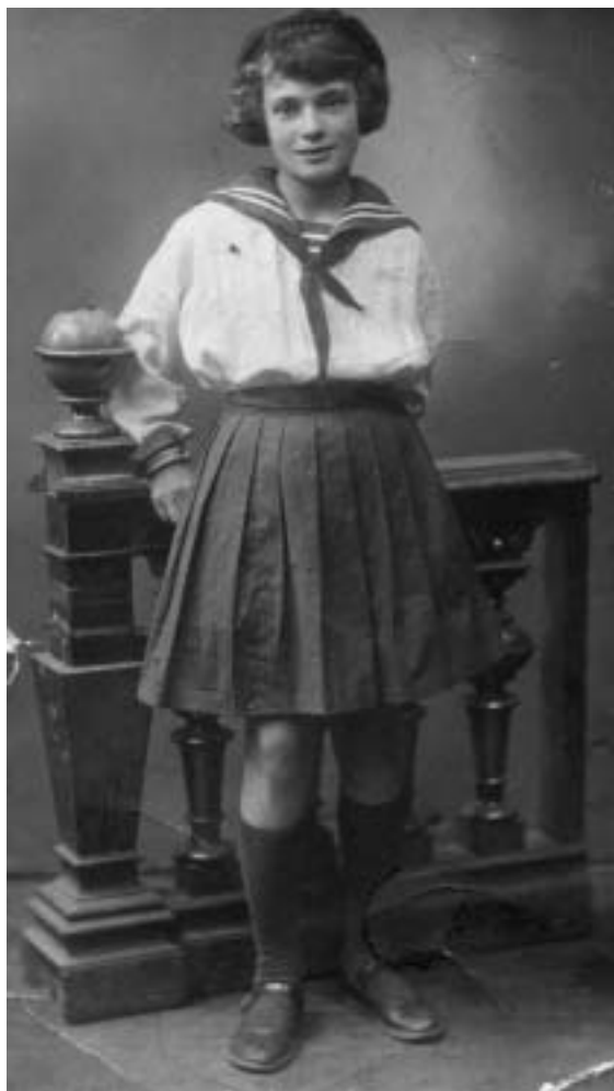
Мне десять лет