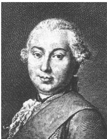
И. И. Шувалов