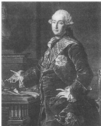
Князь А. М. Голицын