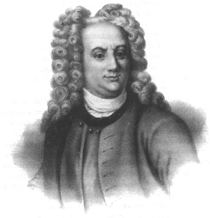
В. Н. Татищев