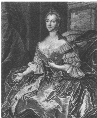
Великая княгиня Екатерина Алексеевна (императрица Екатерина II)