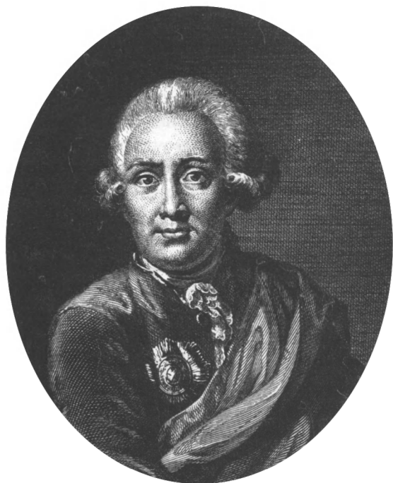
А. П. Сумароков