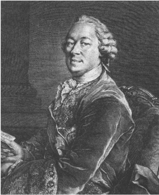
Граф М. А. Воронцов