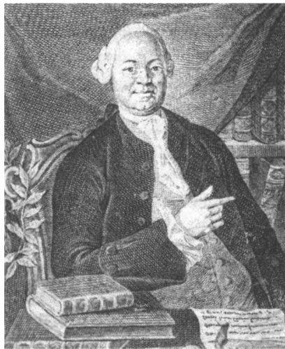
В. К. Тредиаковский