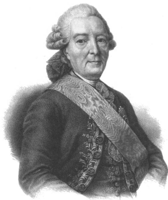
И. И. Бецкой