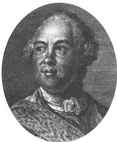
Граф К. Г. Разумовский