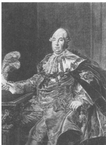
Граф Р. Л. Воронцов