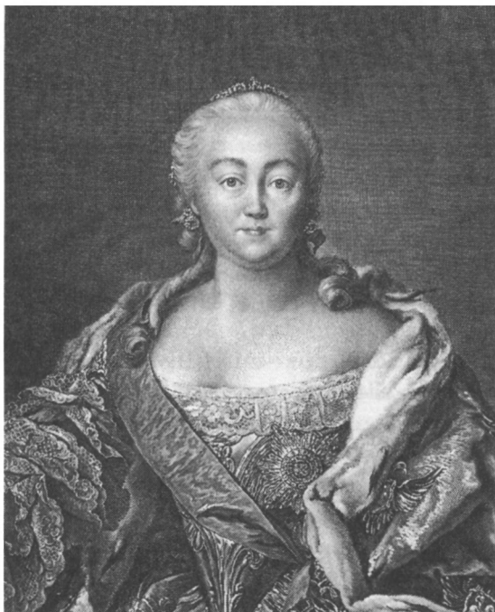
Императрица Елизавета Петровна