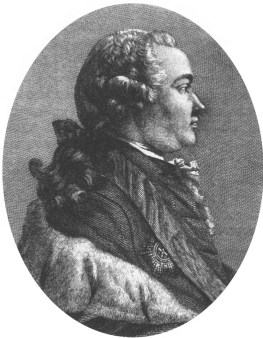
Г. Г. Орлов