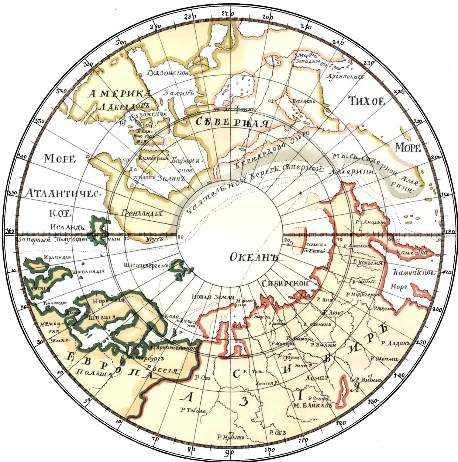
Полярная карта, приложенная к рукописи „Краткое описание разных путешествий по северным морям и показание возможного проходу Сибирским океаном в Восточную Индию“.