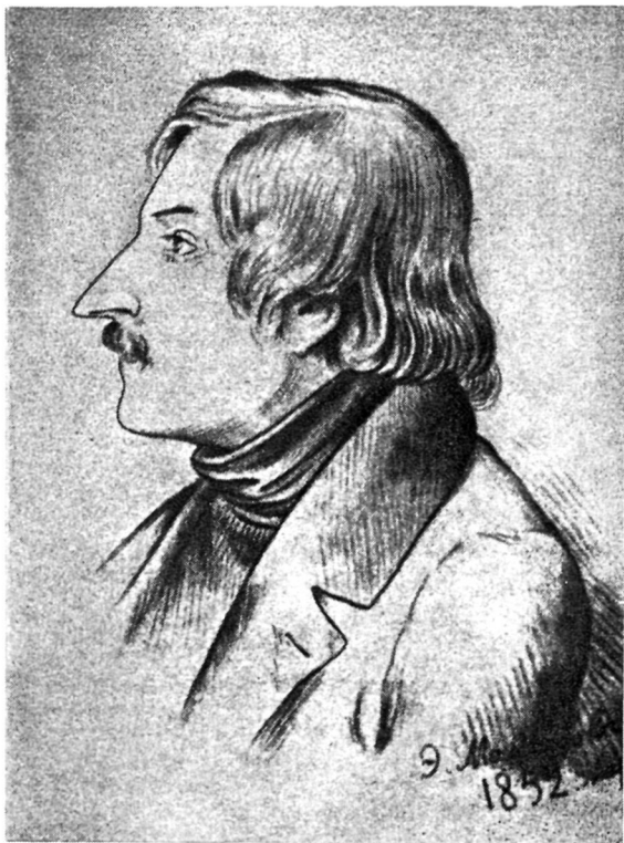
Н. В. Гоголь незадолго до смерти. Художник Э. Дмитриев-Мамонов.

ускорить дело, он перенапрягся и оттого отдалил его «года, может быть, на два» (XIV, 245). Хотя Гоголь, «по-видимому, с умыслом, преувеличивал препятствия» (Н. Тихонравов), намеренно удлинял сроки, но состояние его было трудным. «Дух мой крайне изнемог; нервы расколеблены сильно. Чувствую, что нужно развлечение, а какое — не найду сил придумать», — пишет он Шевыреву 30 сентября.