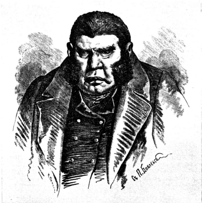
Собакевич. Художник П. Боклевский.

поэта», конкретизируется: они скажутся на его творчестве, он сочинит «песни» высокого строя, которые окажут вдохновляющее воздействие на современников (следующая затем — недописанная — фраза: «Еще раз освежат мир...»).