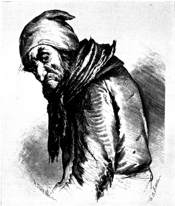
Плюшкин. Художник П. Боклевский.

вьюга вдохновенья подыметя из облеченной в святой ужас и в блистанье главы, и почуют в смущенном трепете величавый гром других речей...» (135). Еще сильнее подчеркнуто, что будущая «песня» будет отличаться, по содержанию и интонации, от первого тома («иным ключом вдохновенья», «других речей»). Но