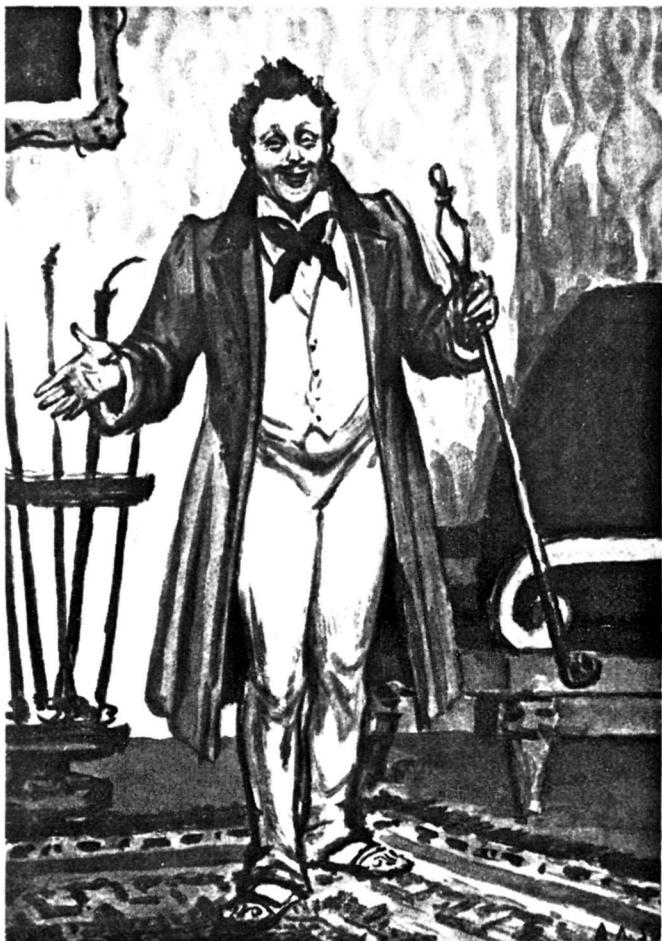
Манилов. Художник А. Лаптев.