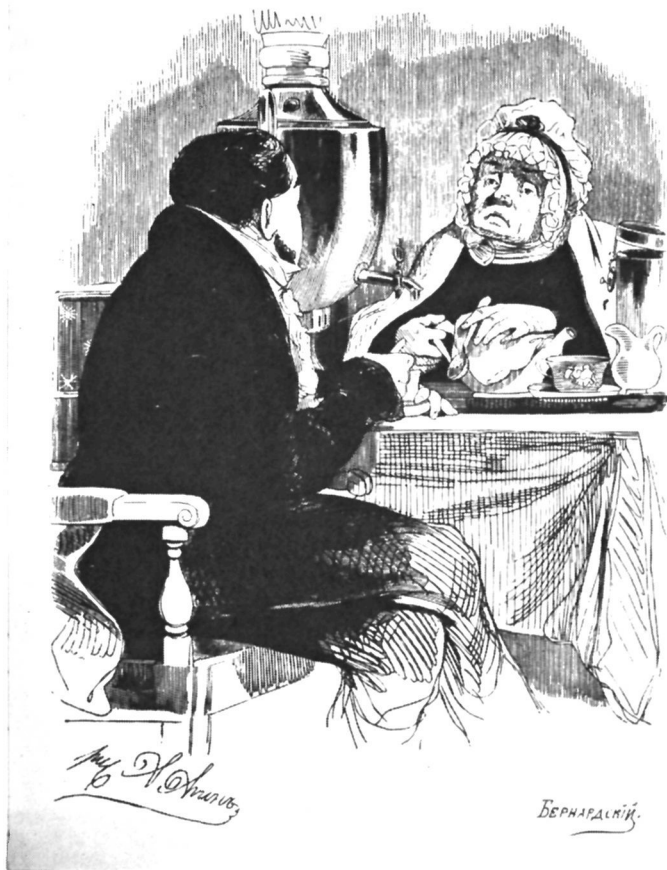
Чичиков у Коробочки. Художник А. Агин.