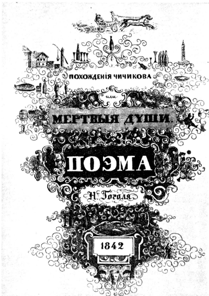
Обложка первого издания. Выполнена по рисунку Гоголя.