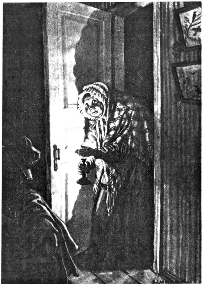
Коробочка. Художник А. Лаптев.