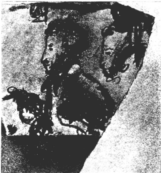
А. С. Пушкин. Рисунок Н. В. Гоголя. 1833 г.

одно небольшое изображение небольшой сцены, но которое, однако ж, поразило его больше всего мной прежде читанного, он мне сказал: «Как с этой способностью угадывать человека и несколькими чертами выставлять его вдруг всего, как живого, с этой способностью, не приняться за большое сочинение! Это, просто, грех!» Вслед за этим начал он представлять мне слабое мое сложение, мои недуги, которые могут прекратить мою жизнь рано; привел мне в пример Сервантеса, который, хотя и написал несколько очень замечательных и хороших повестей, но если бы не принял за Донкишота, никогда бы не занял того места, которое занимает теперь между писателями, и, в заключение всего, отдал мне свой собственный сюжет, из которого он хотел сделать сам что-то в роде поэмы и которого, по словам