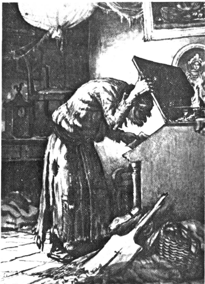
Плюшкин. Художник А. Лаптев.