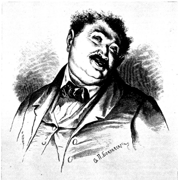
Манилов. Художник П. Боклевский.

Примечательна судьба одного места в зачине седьмой главы — в знаменитом сопоставлении двух писателей — того, кто «окурил упоительным куревом людские очи», и того, кто дерзнул сказать современникам всю правду. Удел второго труден и печален, но и ему уготовано утешение: «В сей толпе, которая шумит и волнуется ежедневно, может встретиться поэт, всевидец и самодержавный владетель мира, проходящий незамеченным пилигримом по земле, чье увлажненное слезою орлиное