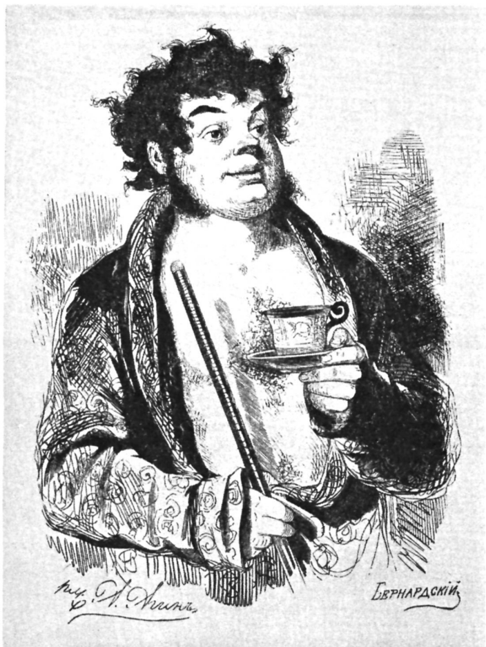
Ноздрев. Художник А. Агнин.