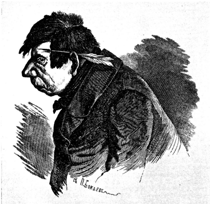
Иван Антонович Кувшиное рыло. Художник П. Боклевский.

«Грозная вьюга вдохновения», «гром» речей, «святой ужас...» — перед нами словно атрибуты высокого пророка, божьего помазанника, потрясающего современников, чтобы открыть им истинный путь. Во всем этом отразилось мироощущение, овладевшее Гоголем после кризиса. Но снова следует предостереечь против упрощения: характерна, например, оговорка «И далеко еще то время...» и т. д. Художник чувствует, что мера низкого и пошлого еще далеко им не исчерпана.