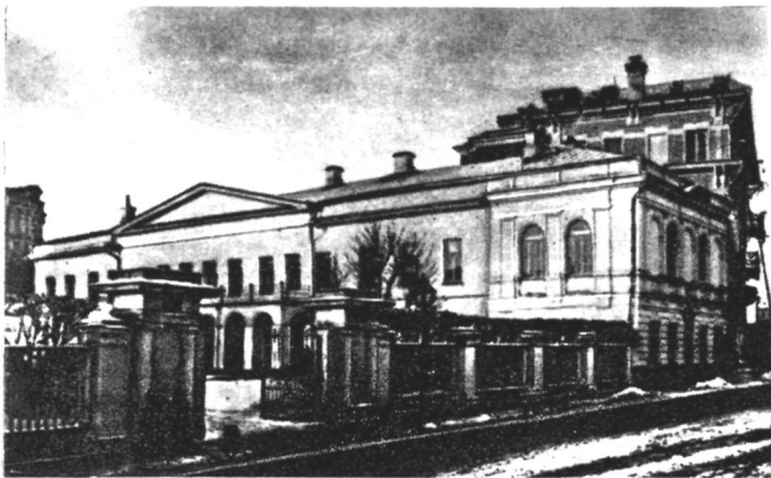
Дом в Москве на Никитском бульваре. Здесь Гоголь жил и умер.

над Вашими лучшими гениями всегда нависает страшная судьба» (24, с. 140—141) 75 .