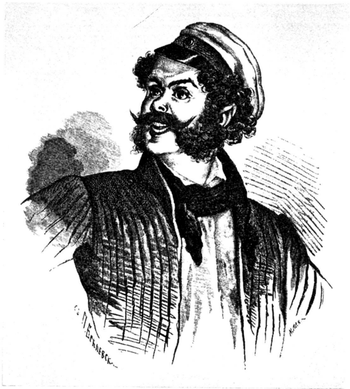
Ноздрев. Художник П. Боклевский.

такой вид: «Почему знать, может быть сии же низкие страницы предстанут потом в незамеченном ныне свете и, может быть, будущий поэт (о, какая чудная награда!) смятенный остановится перед ними; грозная вьюга вдохновения обовьет главу его, и [неслышные] потекут одетые в блистанье песни» (773). Впечатление, которое произведут «низкие страницы» на «будущего