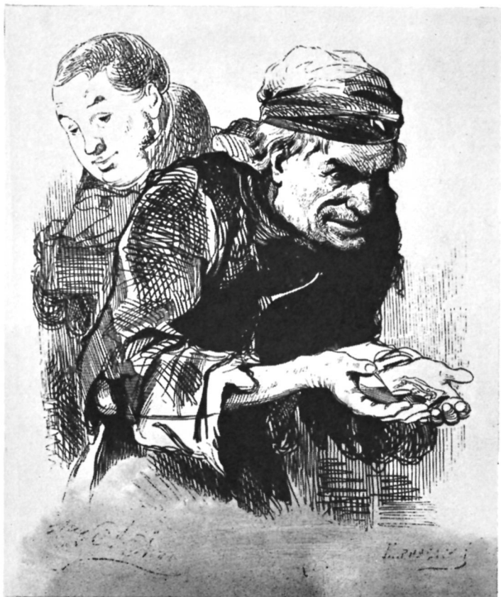
Плюшкин. Художник А. Агин.