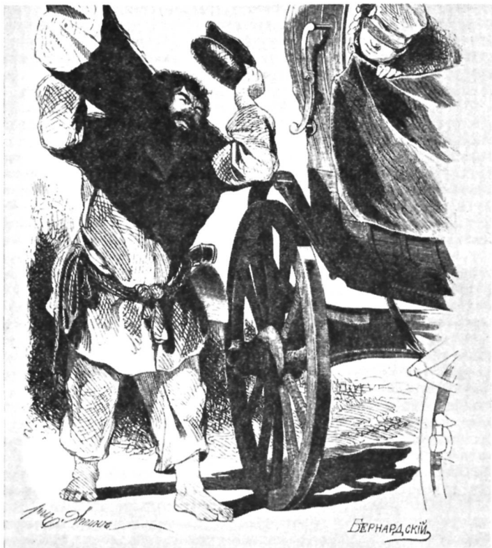
По дороге к Плюшкину. Художник А. Агин.