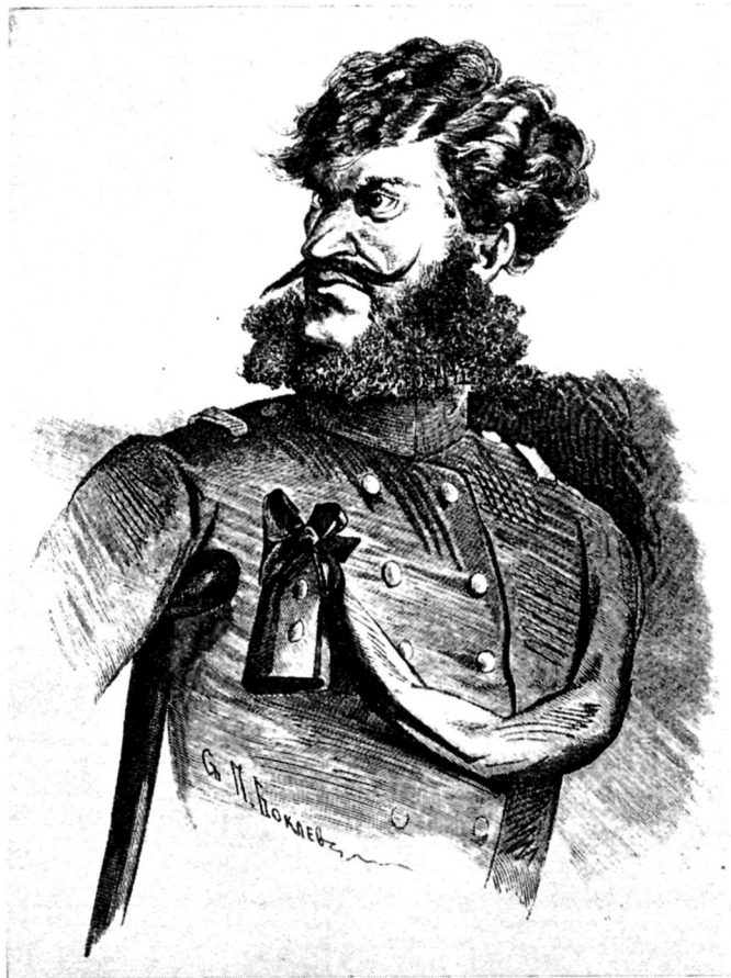
Капитан Копейкин. Художник П. Боклевский.