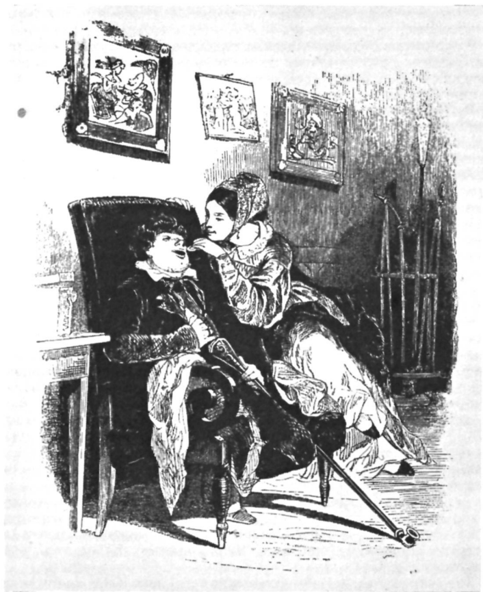
Манилов с женой. Художник А. Агин.