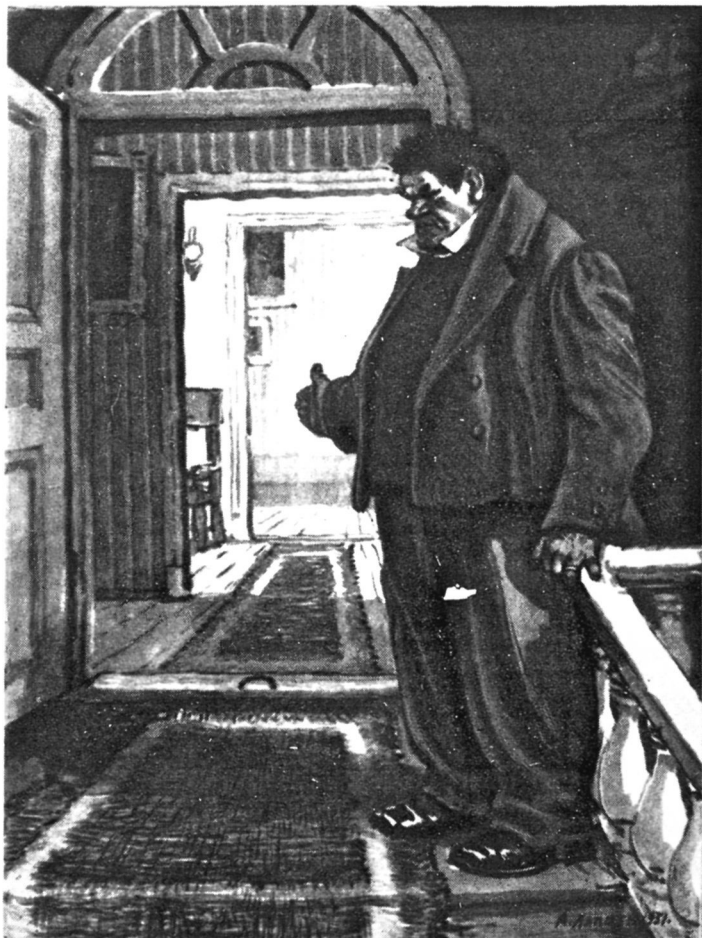
Собакевич. Художник А. Лаптев.