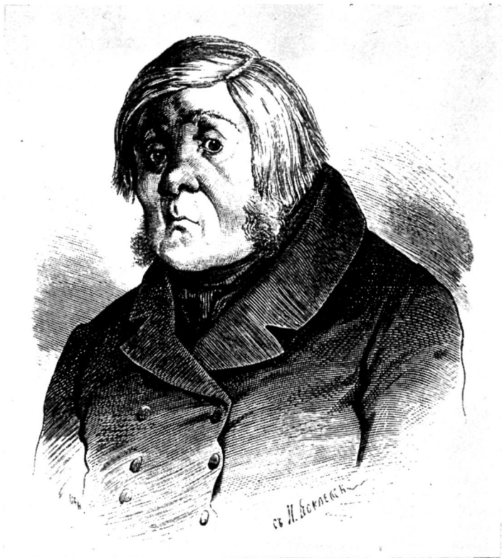
Приказчик-баба. Художник П. Боклевский.

главное изменение в том, что все действие переносится с другого лица на самого автора . «Не от «будущего поэта» ожидает он теперь песен, которые освежат мир» — он исполнен надежды, что эти «другие речи» потекут некогда из собственных его уст» 33 . Гоголь явно подразумевает дальнейшее развитие поэмы.