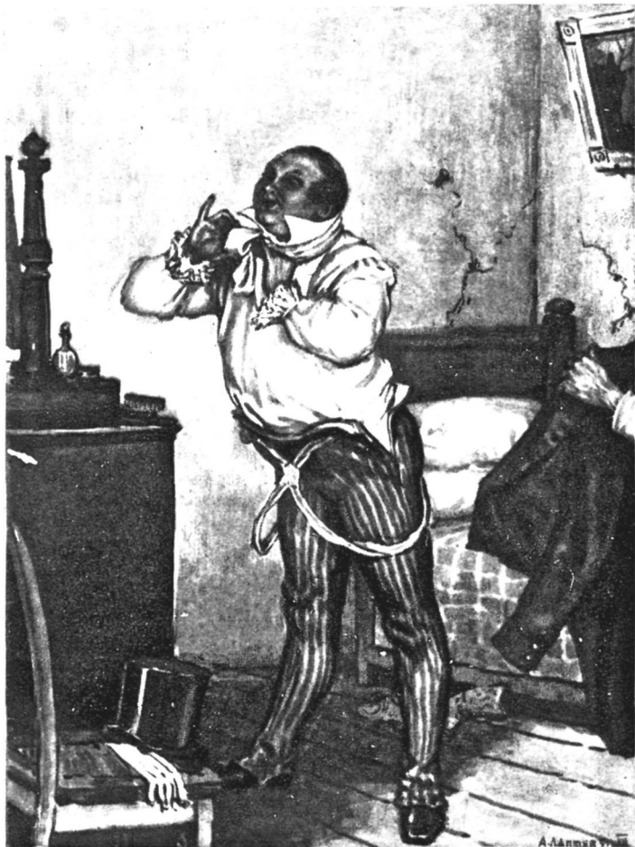
Чичиков перед зеркалом. Художник А. Лаптев.