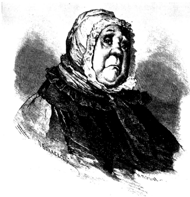
Коробочка. Художник П. Боклевский.

око и пробужденные твоею страницей неожиданные чувства может быть отзовутся...» (441). Это строки из второй черновой редакции. Смысл деятельности комического писателя в том, что его беспощадные разоблачения пробуждают высокие движения души в другом, в некоем истинном и неведомом людям поэте-единомышленнике.