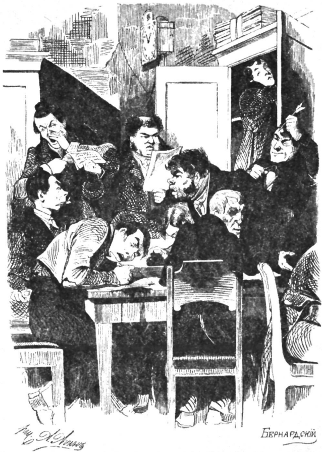
Губернские чиновники. Художник А. Агин.