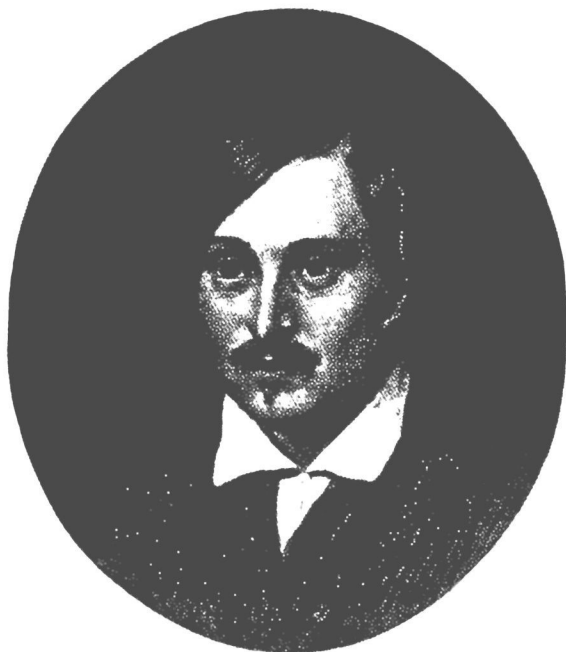
Н. В. Гоголь. Художник А. Иванов. 1841 г.

или написаны вчерне две главы. Заминка возникла на третьей главе; видимо, именно для нее нужен «хороший ябедник».