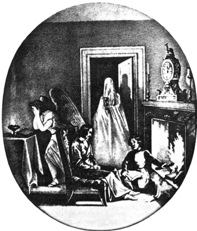
Последние дни Гоголя. С литографии Солоницына.

корреспонденты и собеседники Гоголя, со своей стороны, спрашивали, оживут ли его мертвые души, они—вольно или невольно—касались не только проблемы будущего исправления героев, но и сегодняшнего их бытования на страницах создаваемого второго тома. В этом вопросе отчетливо звучала альтернатива: предстанут ли персонажи второго тома условными идеальными фигурами или полнокровными, живыми людьми? Более личного, важного и страшного вопроса для писателя не существовало.