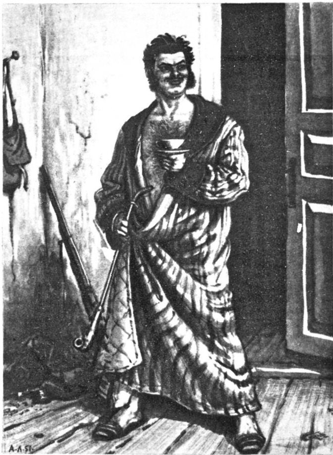
Ноздрев. Художник А. Лаптев.