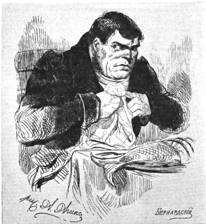
Собакевич. Художник А. Агин.