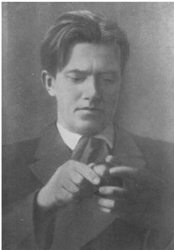
В. МАЯКОВСКИЙ Фото 1912 г.