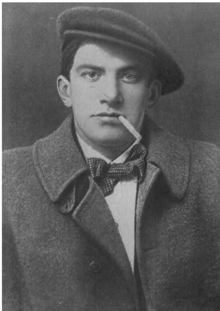
В. МАЯКОВСКИЙ Фото 1915 г.