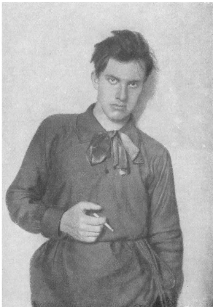
В. МАЯКОВСКИЙ Фсто 1910 г.