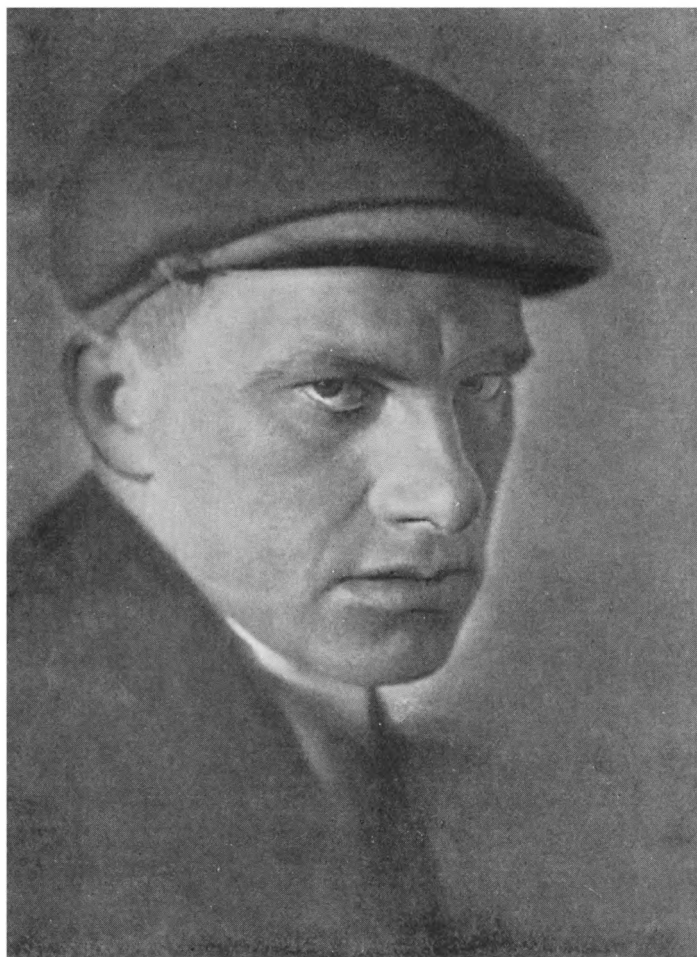
В. МАЯКОВСКИЙ Фото 1923 г.