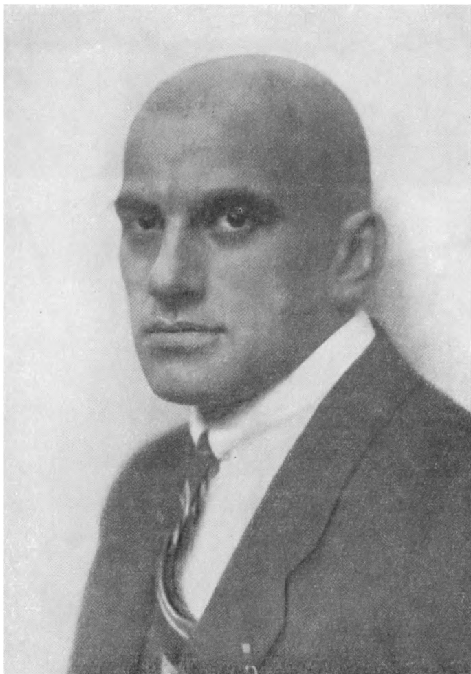
В. МАЯКОВСКИЙ 1923 г. Берлин.