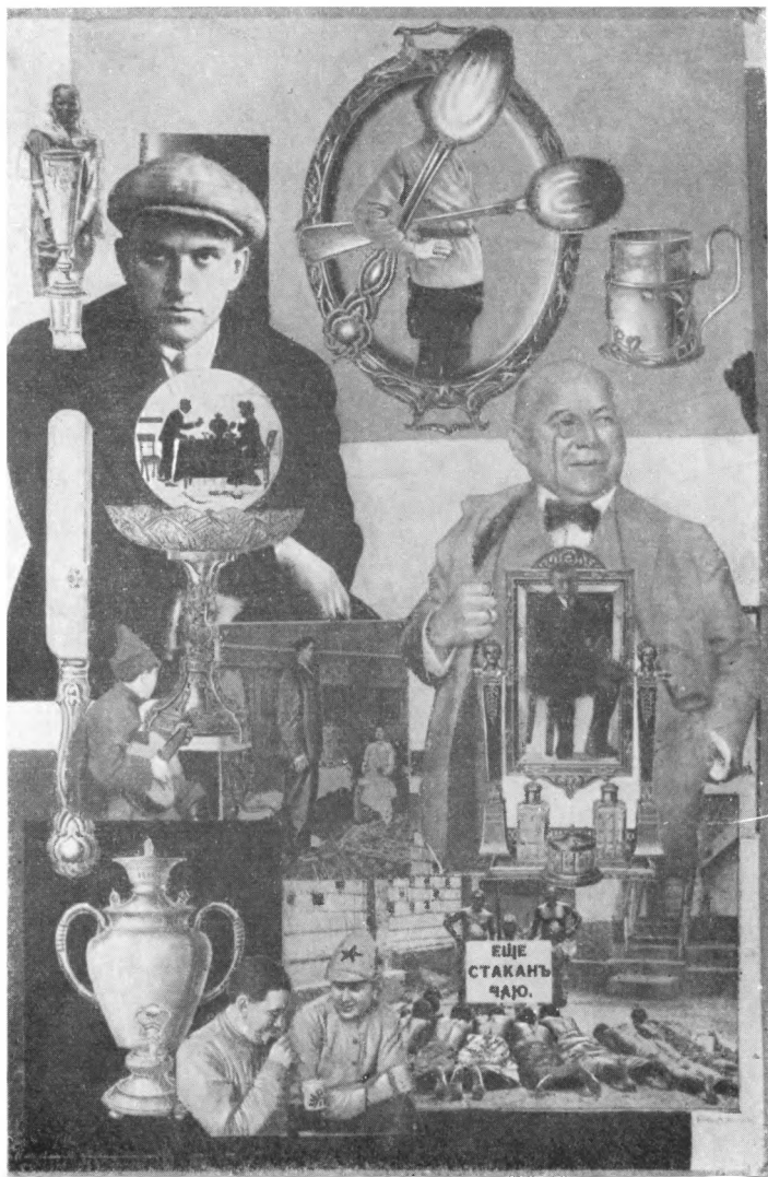
Фото-монтаж А. Родченко к первому изданию поэмы «Про это».