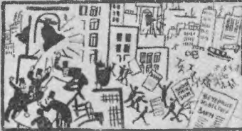
1. Девять лет! Девять лет! Полтора — меньше надо! Ты, "Таймс", в спех! Ты же в спехе не жалеешь!