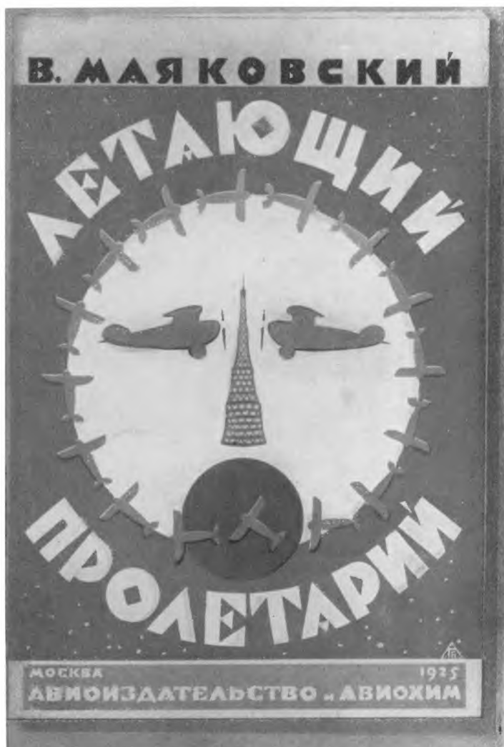
Обложка первого издания поэмы «Летающий пролетарий» работы художника Г. Бершадского, 1925.