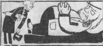
4. Рубль вводи у Ньютона, лорд, Дам до — еще лези на Дам, Нам с еским спеху, как ни Старуху Кавальерию.