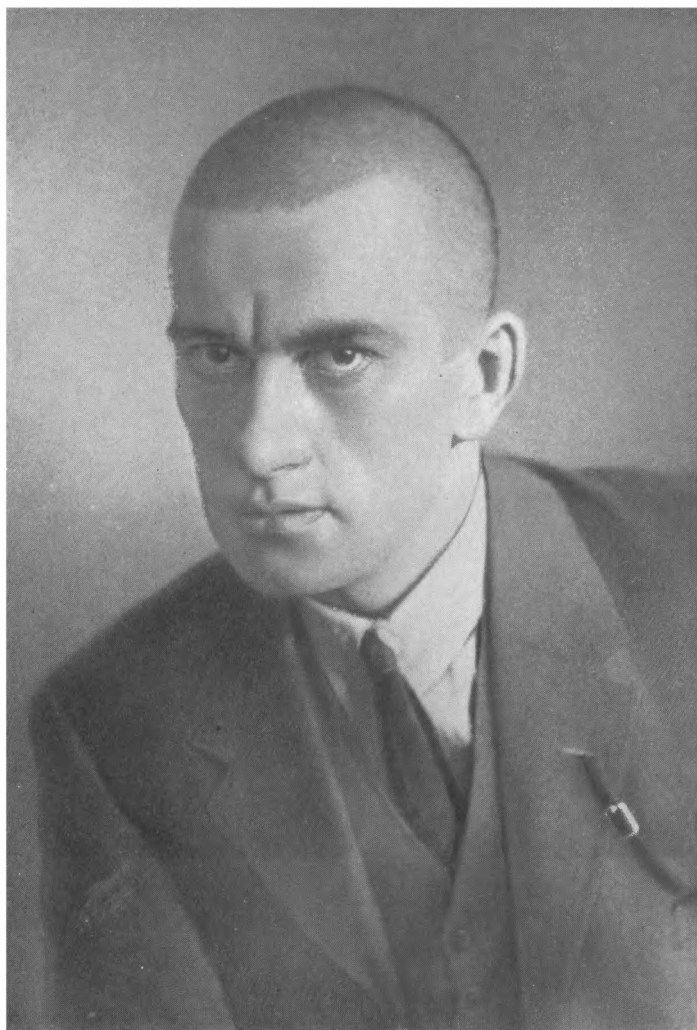
В. МАЯКОВСКИЙ Фото. 1924 г.