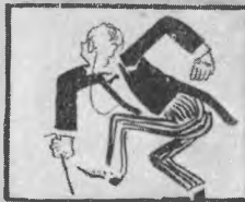
3. Дистанционный лорд Черчилль Спаси и рубли, перепрыгнув Оруч, как будто черт Включишь ты Черчилль.