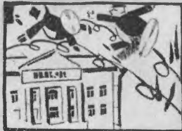
7. Заводи спухи, спухи, Даму, выключишь, образцы!