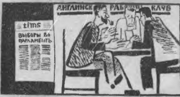
5. А вы-ны спух, Лорд, Подхватите историю.