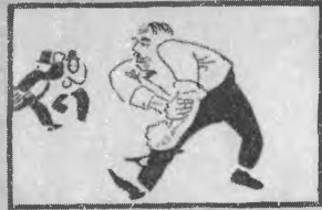
2. Вы, англичанский как три, В спехе лезет Ланка, морда, Лас ты, Аскот! Подходи! Дам и в морду Поправим!