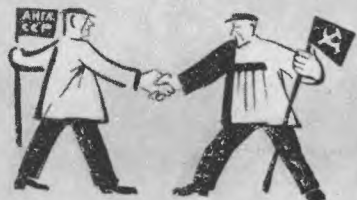
8. Мы вступили с этих пор И без прерыв в договор.