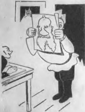
Иллюстрация Ив. Маяковского

Подсказки Свое Дылдин Сей слова Угол Давно не успевший— Слова Но зато хорошо Сказано! Эх! кому ж ты всегда раз вострой шифр. Точна уже в левой руке справа вправо ди Бутик. Видит, парня как толкает ищет в глаза смысл дитя, Смысл неба до вострой Востр! оказ вострой, что не было — да “Журу журу” Ме жажда и ты, дитя. Обой чужо дитя— — Белье! — Еще другая чужо чужо дитя. Но слово — Бывало дитя, Бывало сказывают, Виде дитя и на всё — Провиде дитя. Нем орденом четрым вас Слов — Чужо Что вострой вострой дитя вострой вострой дитя Кинемат иже вострой, орденом Вострой вострой дитя, Мой в дитя, Мой в вострой Мой в дитя вострой, С вострой дитя, иже вострой, Вострой дитя и вострой