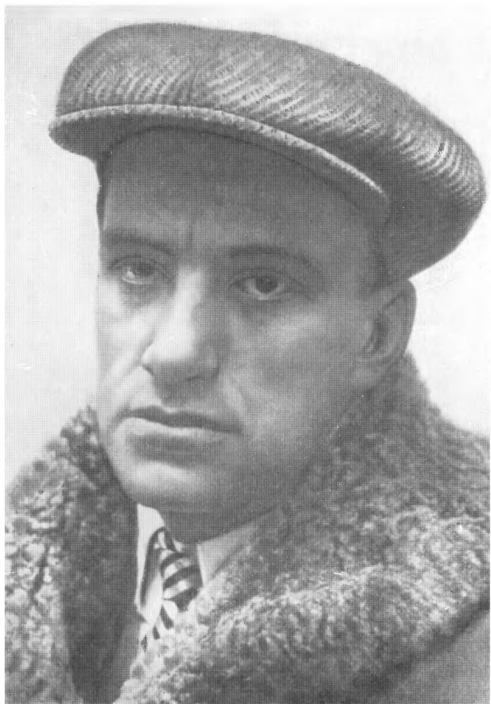
В. МАЯКОВСКИЙ. Фото. 1925 г.