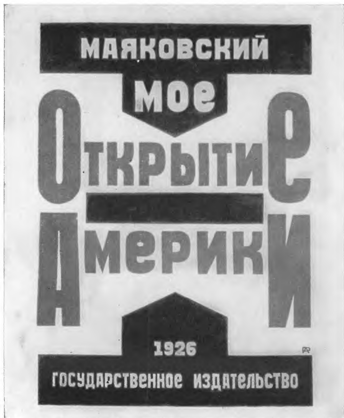
Обложка первого издания очерков «Мое открытие Америки», 1926