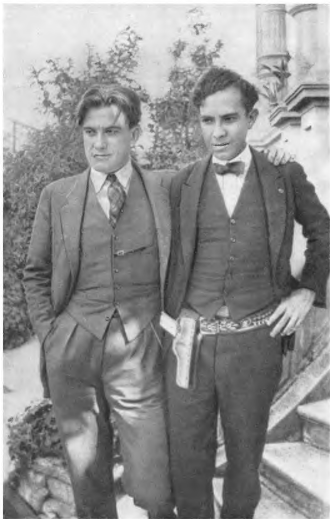
МАЯКОВСКИЙ и МОРЕНО. Фото. Мексика, 1925 г.