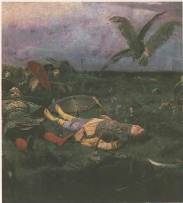
ПОСЛЕ ПОБОИЩА ИГОРЯ СВЯТОСЛАВИЧА С ПОЛОВЦАМИ. (Фрагмент).