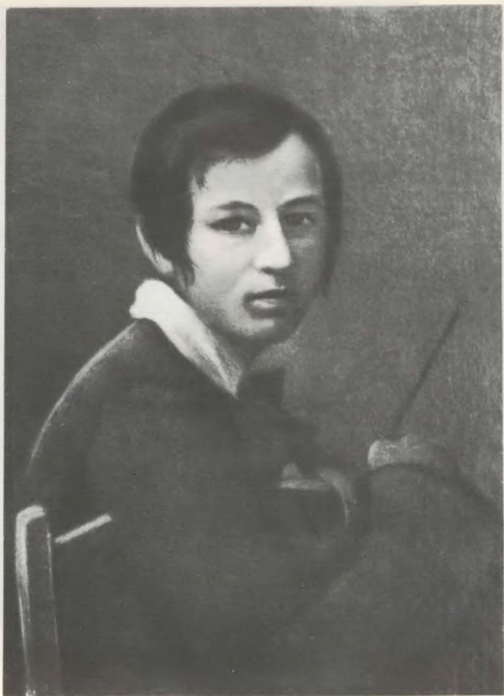
А. Н. МАЙКОВ В ВОЗРАСТЕ 13 ЛЕТ.