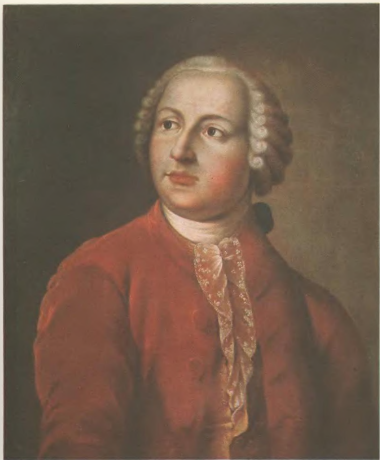
М. В. ЛОМОНОСОВ.