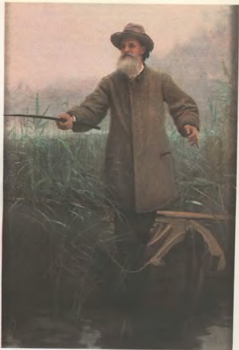
А. Н. МАЙКОВ НА РЫБНОЙ ЛОВЛЕ. Худ. И. И. Крамской. 1883.