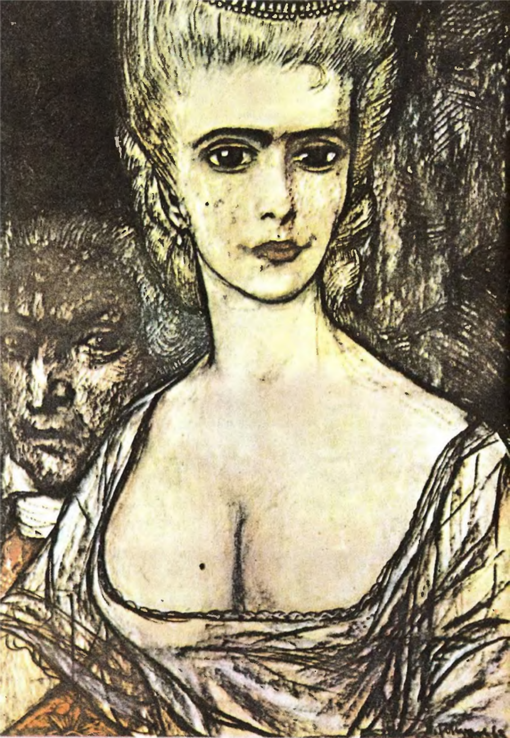
«КНЯЖНА ТАРАКАНОВА И ПРИНЦЕССА ВЛАДИМИРСКАЯ». (Гл. XXVII)