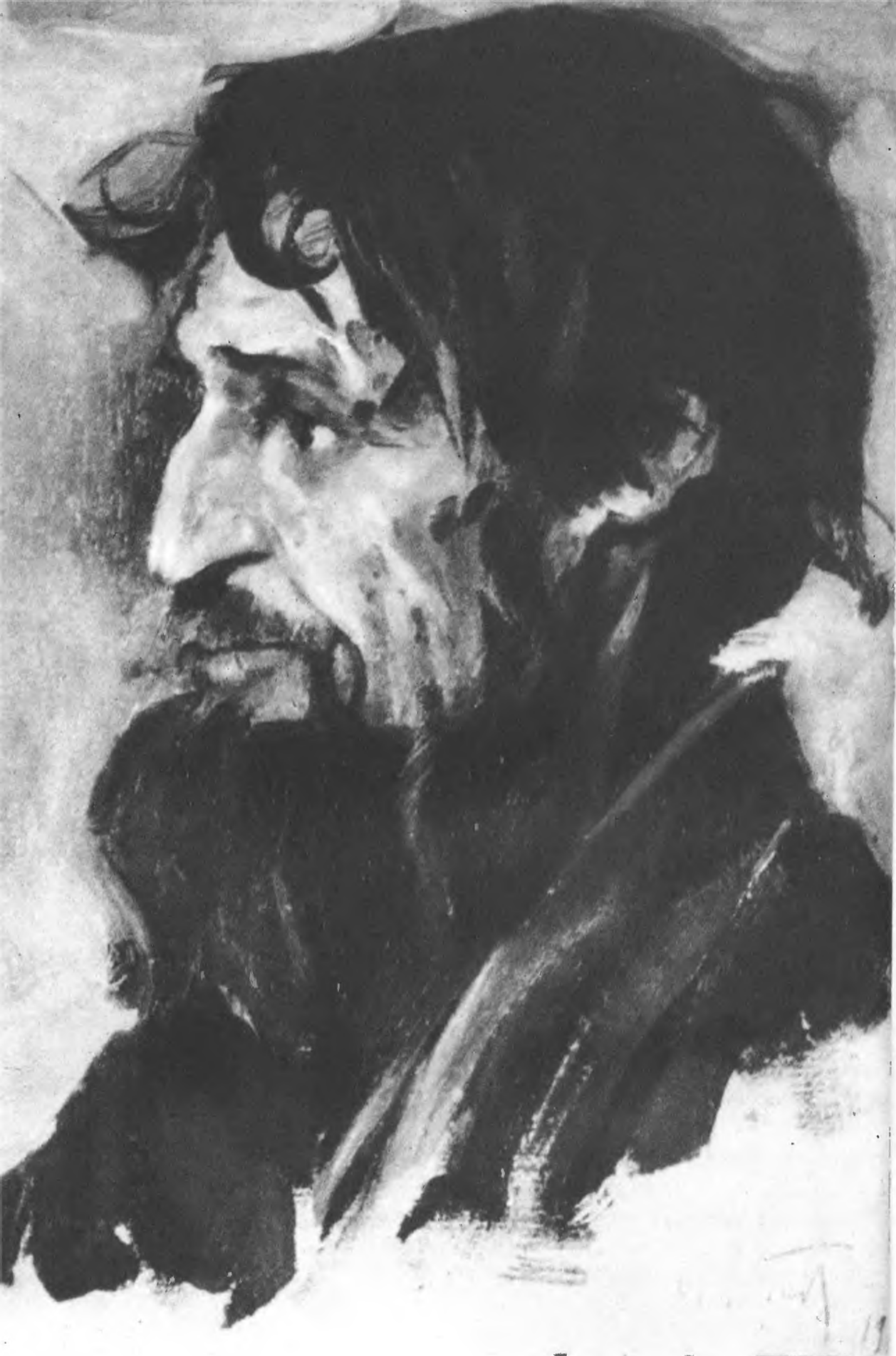
М. В. НЕСТЕРОВ. Этюд мужской головы к картине «На Руси». 1912