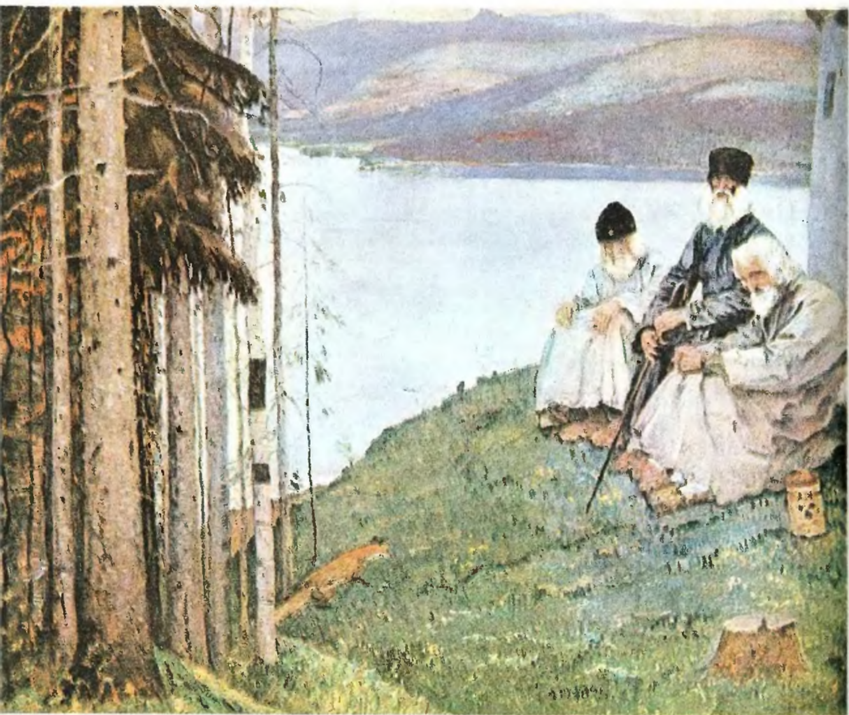
М. В. НЕСТЕРОВ. Лисички. 1914