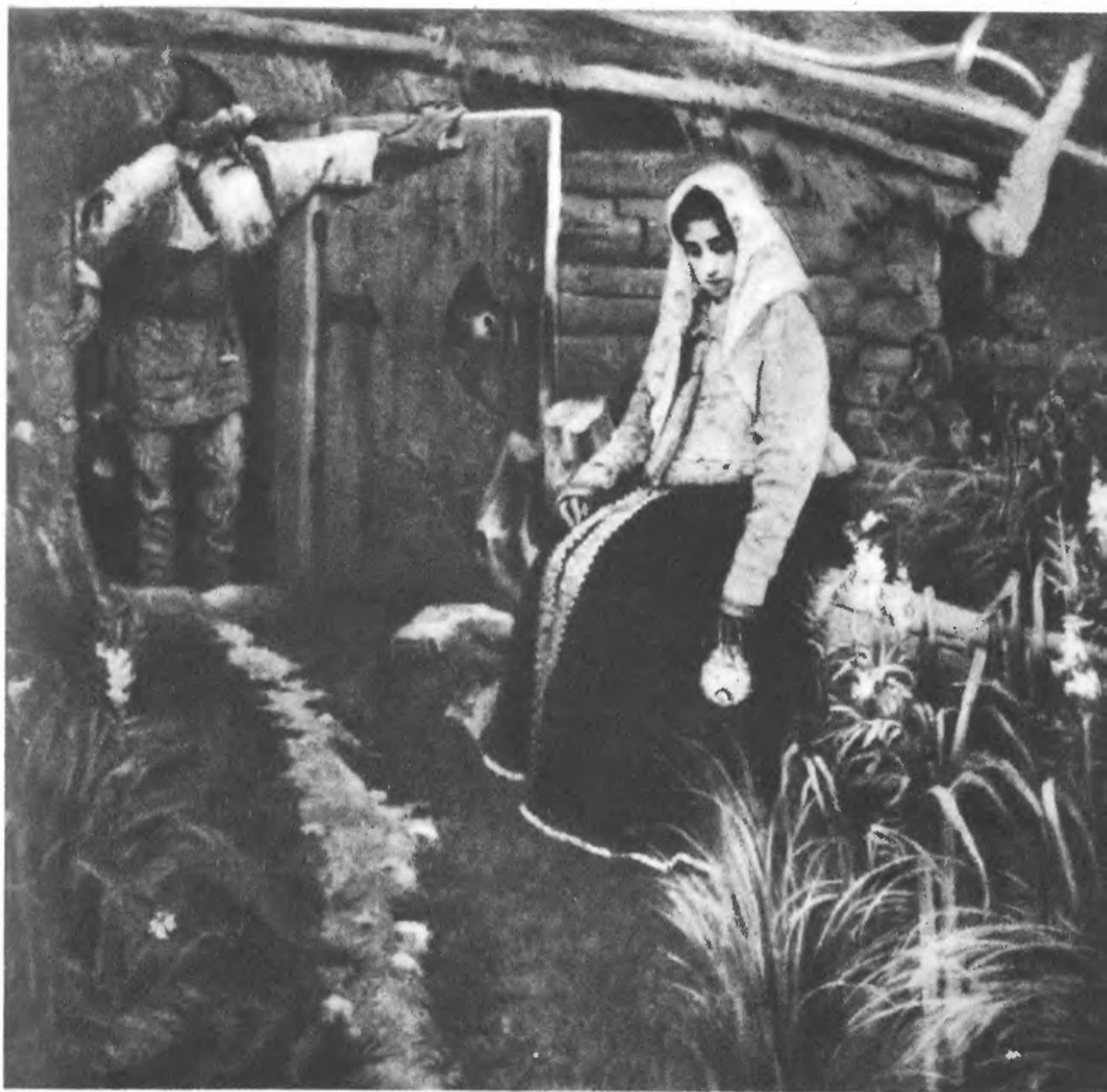
М. В. НЕСТЕРОВ. За приворотным зельем. 1889