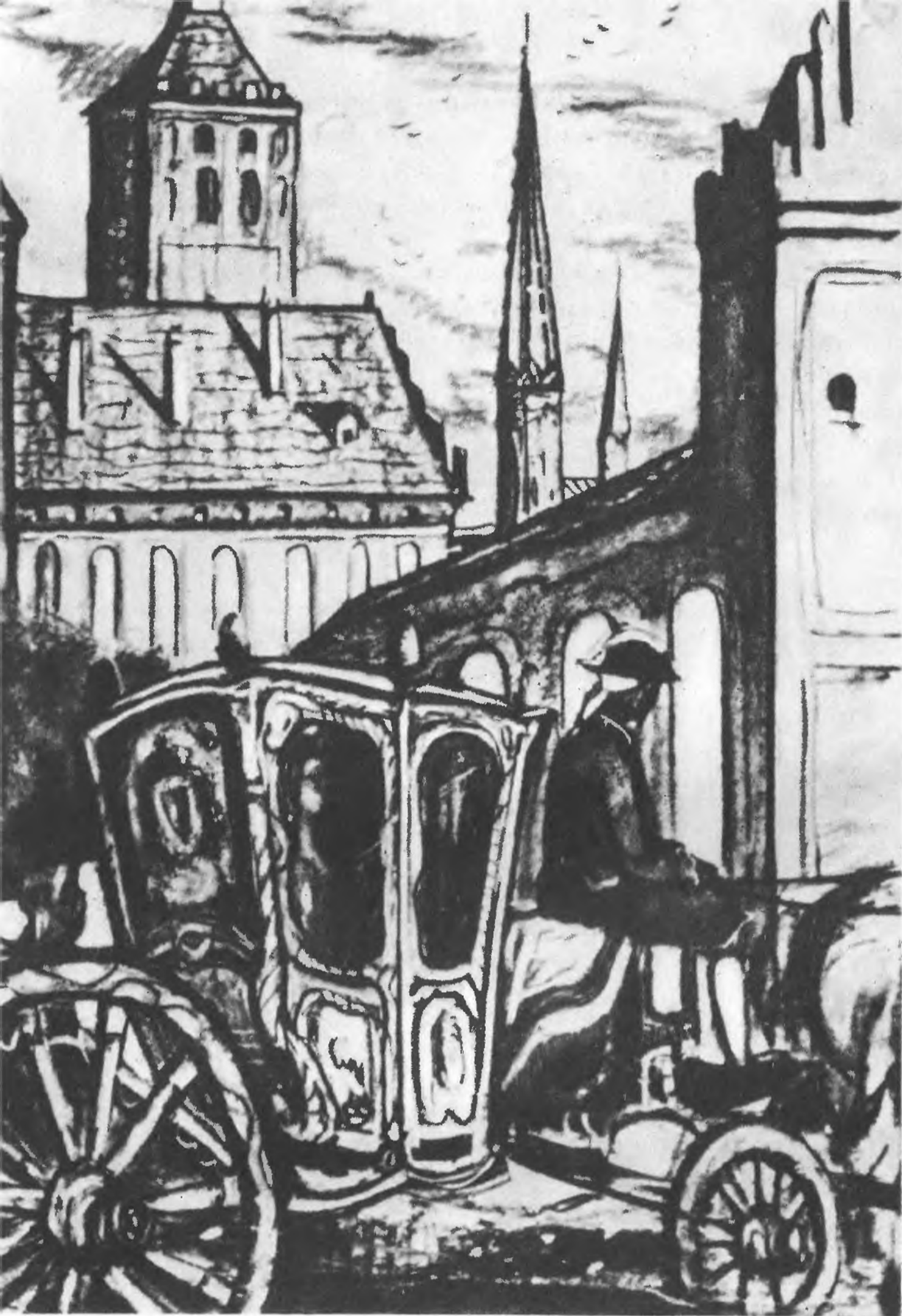
«КНЯЖНА ТАРАКАНОВА И ПРИНЦЕССА ВЛАДИМИРСКАЯ». (Гл. IX)