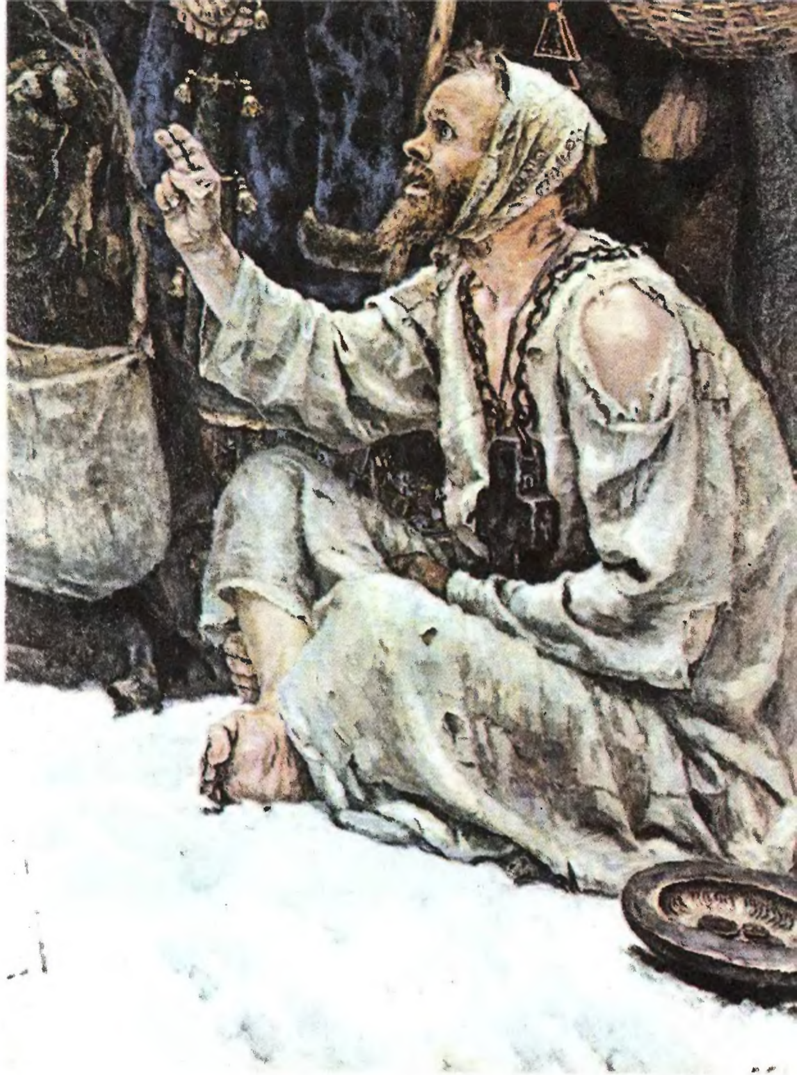
В. И. СУРИКОВ. Боярыня Морозова (фрагмент). 1887