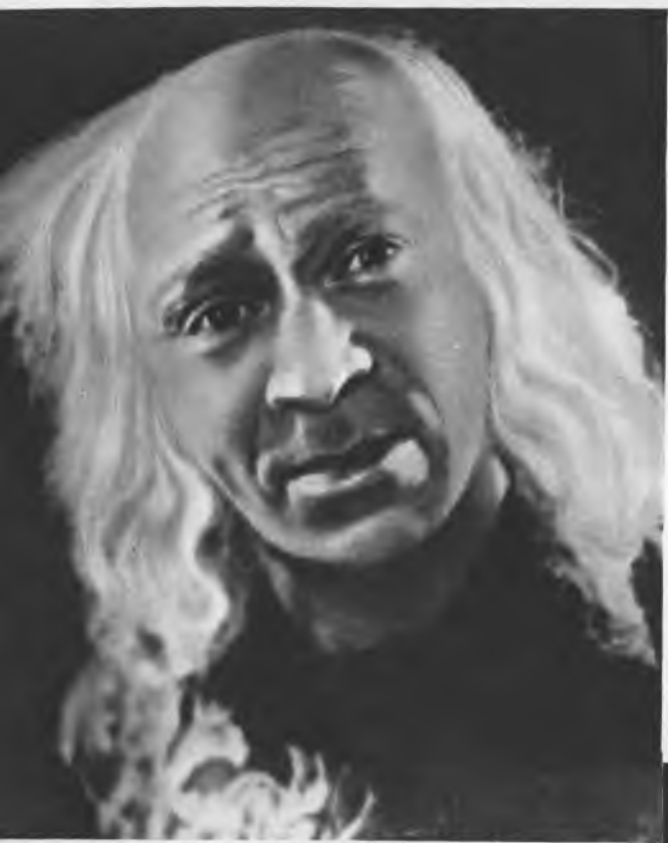
«Король Лир» В. Шекспира. Сцена из спектакля. Декорации А. Г. Тышлера. 1935