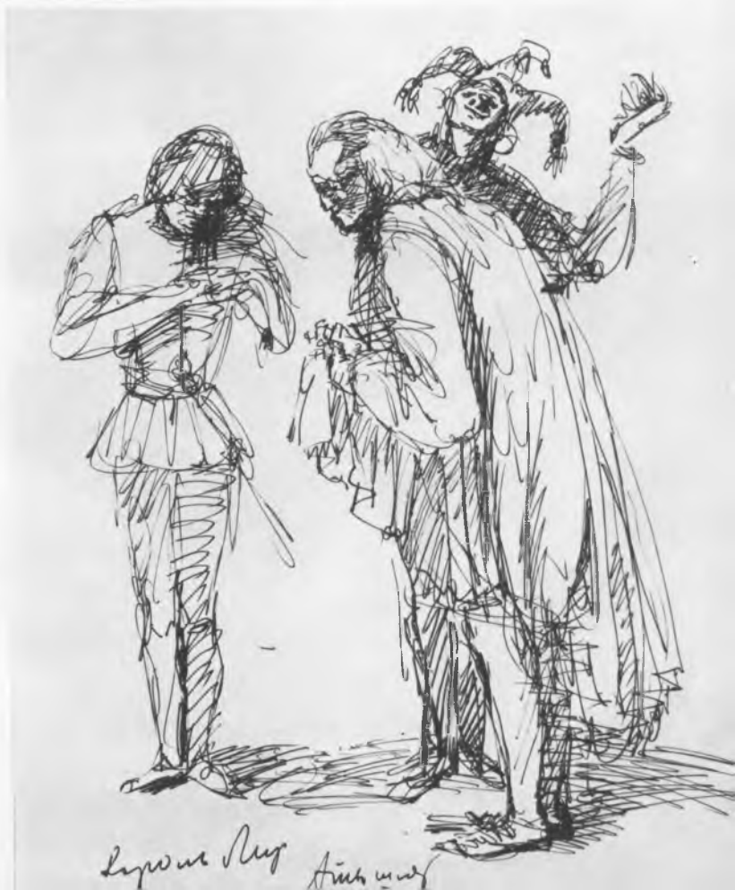
Мизансцена к спектаклю «Король Лир» В. Шекспира. Эскиз А. Г. Тышлера. 1935