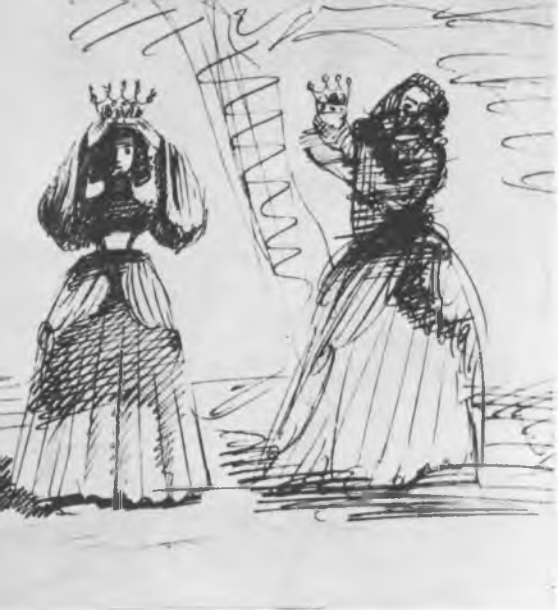
Костюмы к спектаклю «Король Лир» В. Шекспира. Эскиз А. Г. Тышлера. 1935