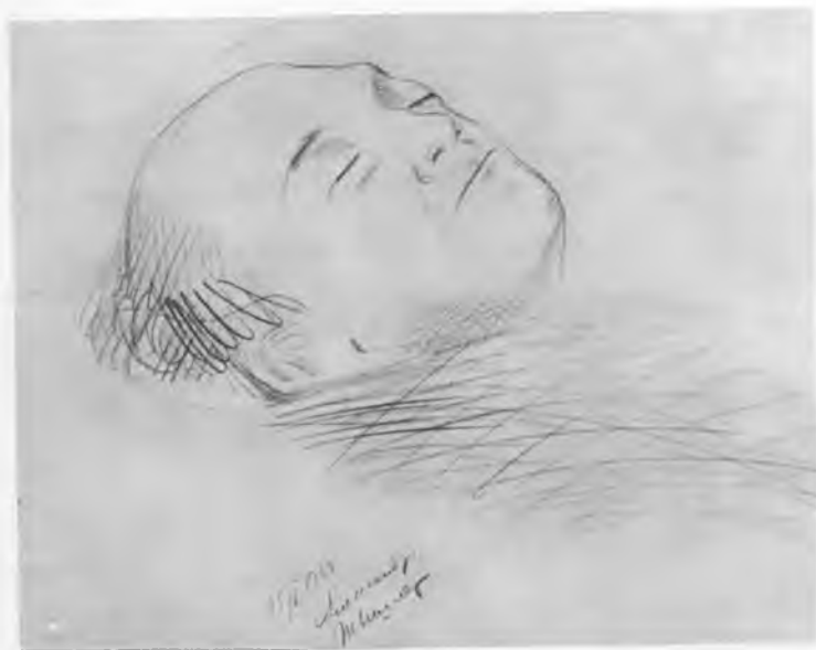
С. М. Михозлс в гробу. Зарисовка А. Г. Тышлера. 15 января 1948 г.