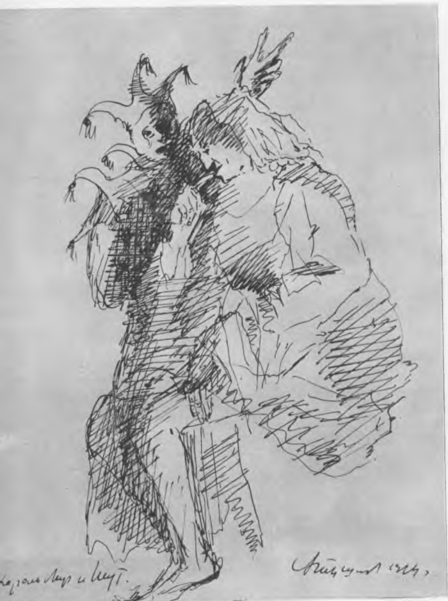
Лир и шут. Эскиз А. Г. Тышлера к спектаклю «Король Лир» В. Шекспира. 1934