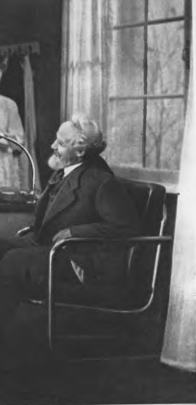
Кадр из кинофильма «Семья Оппенгейм», по роману Л. Фейхт- вангера. В центре С. М. Михозлс в роли доктора Якоби. 1936