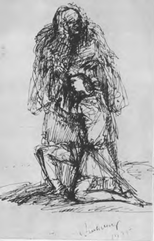
Лир и шут. Эскиз А. Г. Тышлера к спектаклю «Король Лир» В. Шекспира. 1935