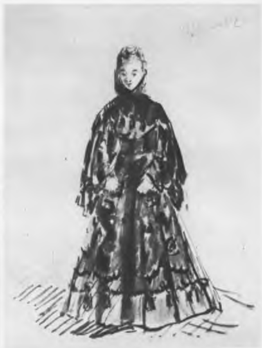
Костюмы к спектаклю «Фрей- лехс». Эскиз А. Г. Тышлера. 1945