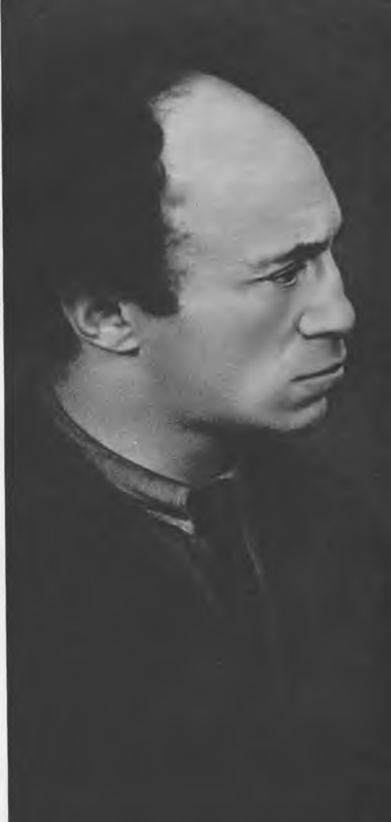
С. М. МИХОЭЛС. 1923