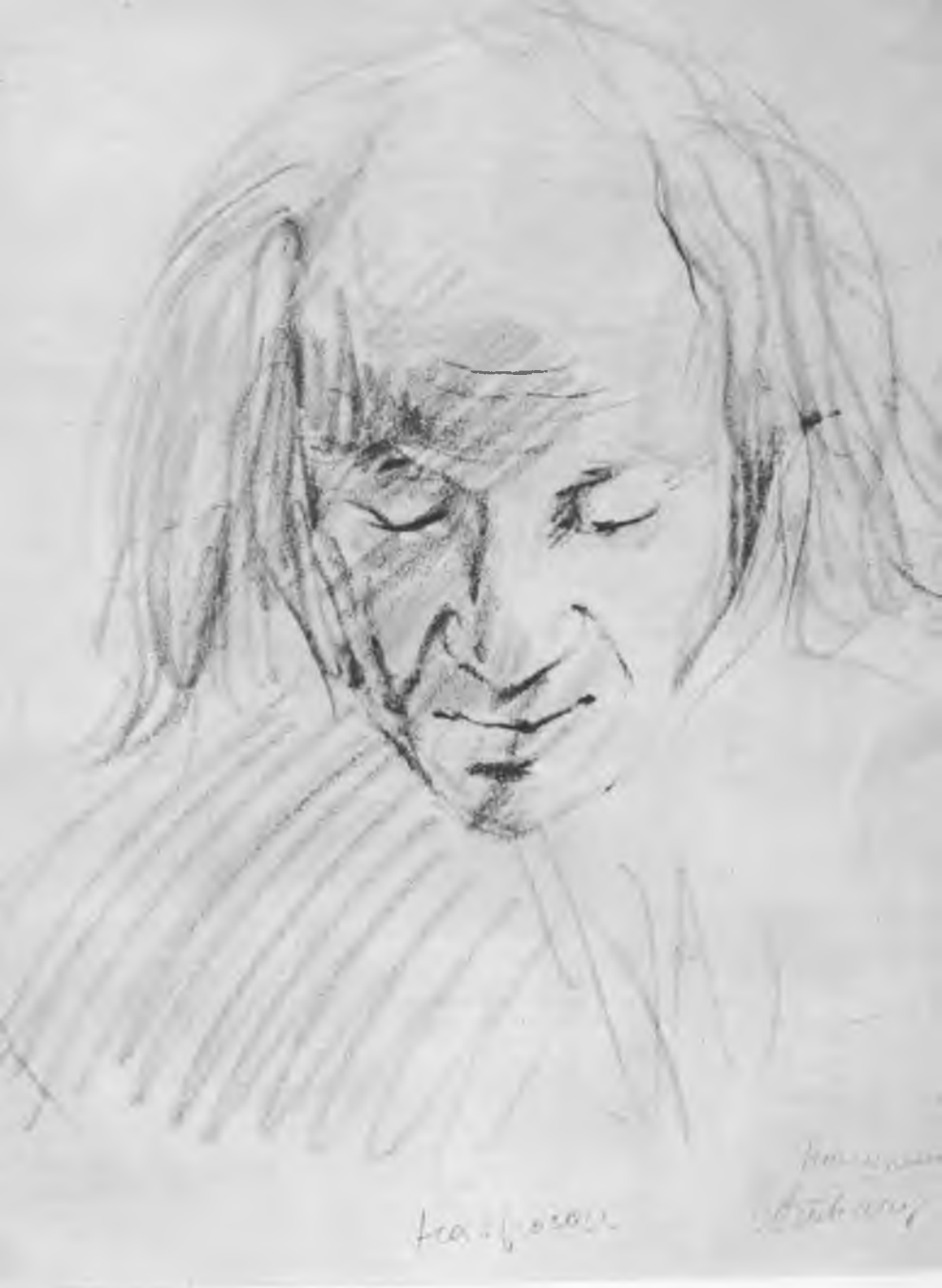
Лир — С. М. Михоэлс. Набросок А. Г. Тышлера. 1942