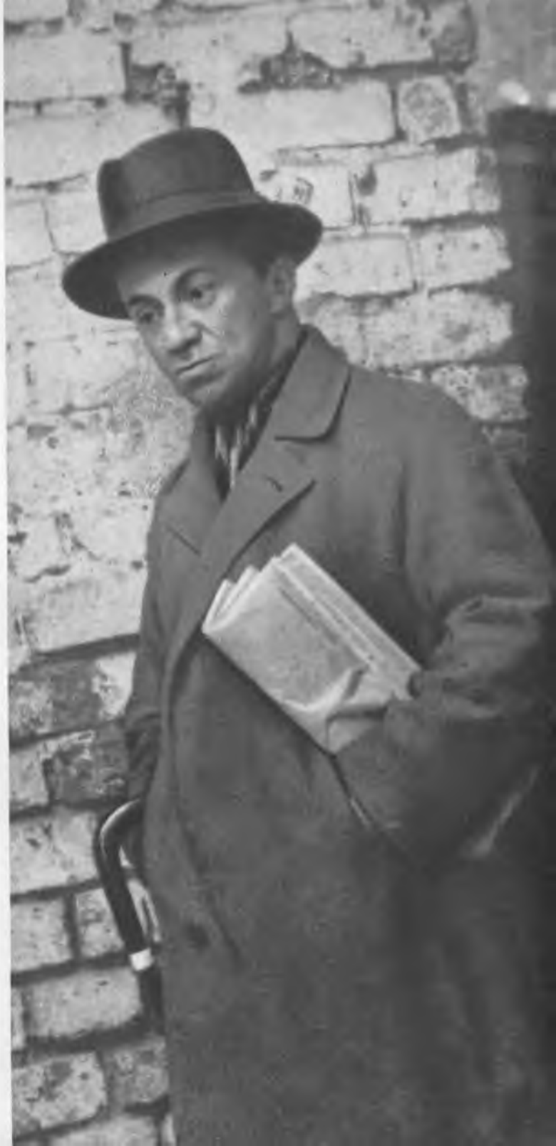
С. М. МИХОЭЛС. 1928