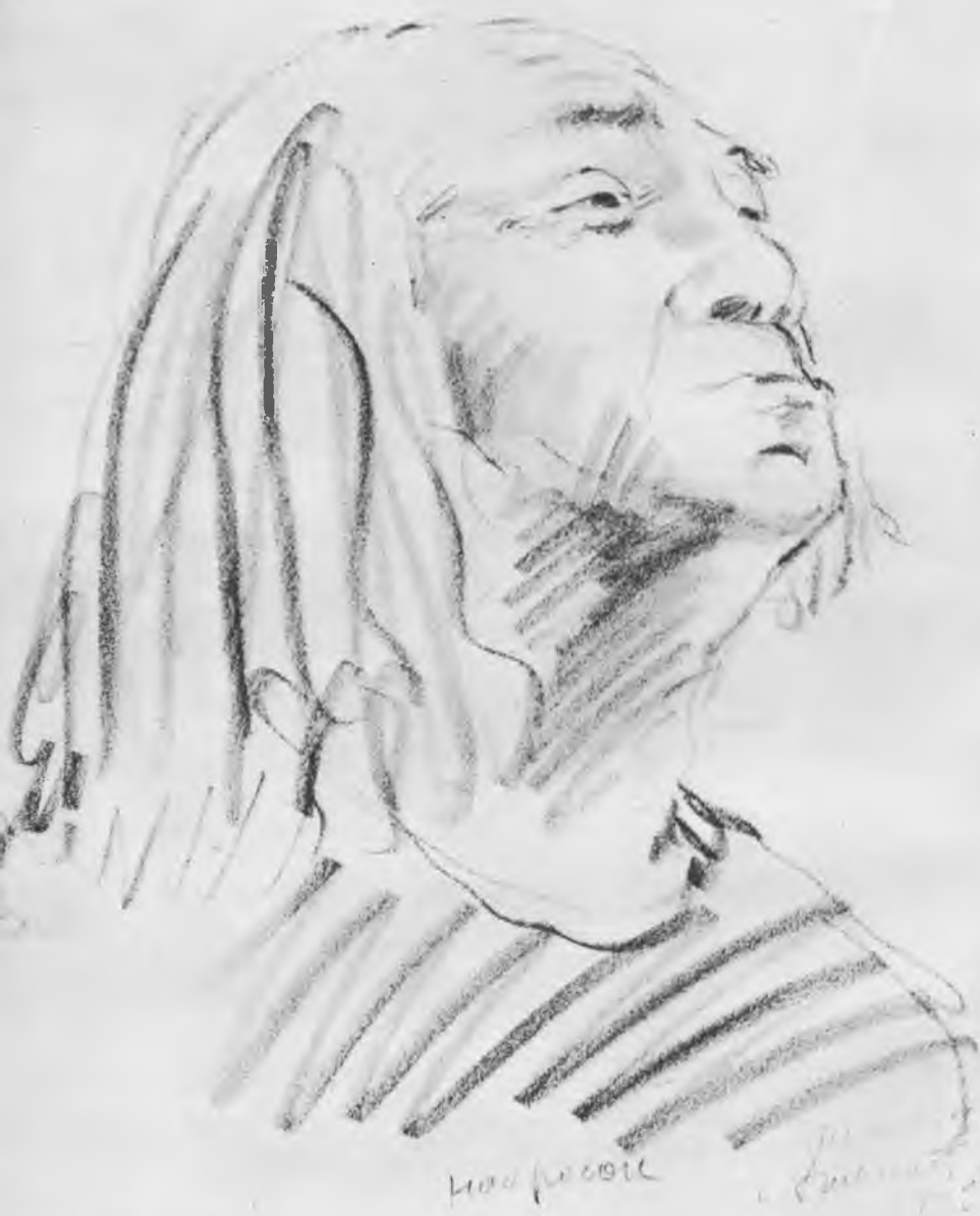
Лир — С. М. Михоэлс. Набросок А. Г. Тышлера. 1942