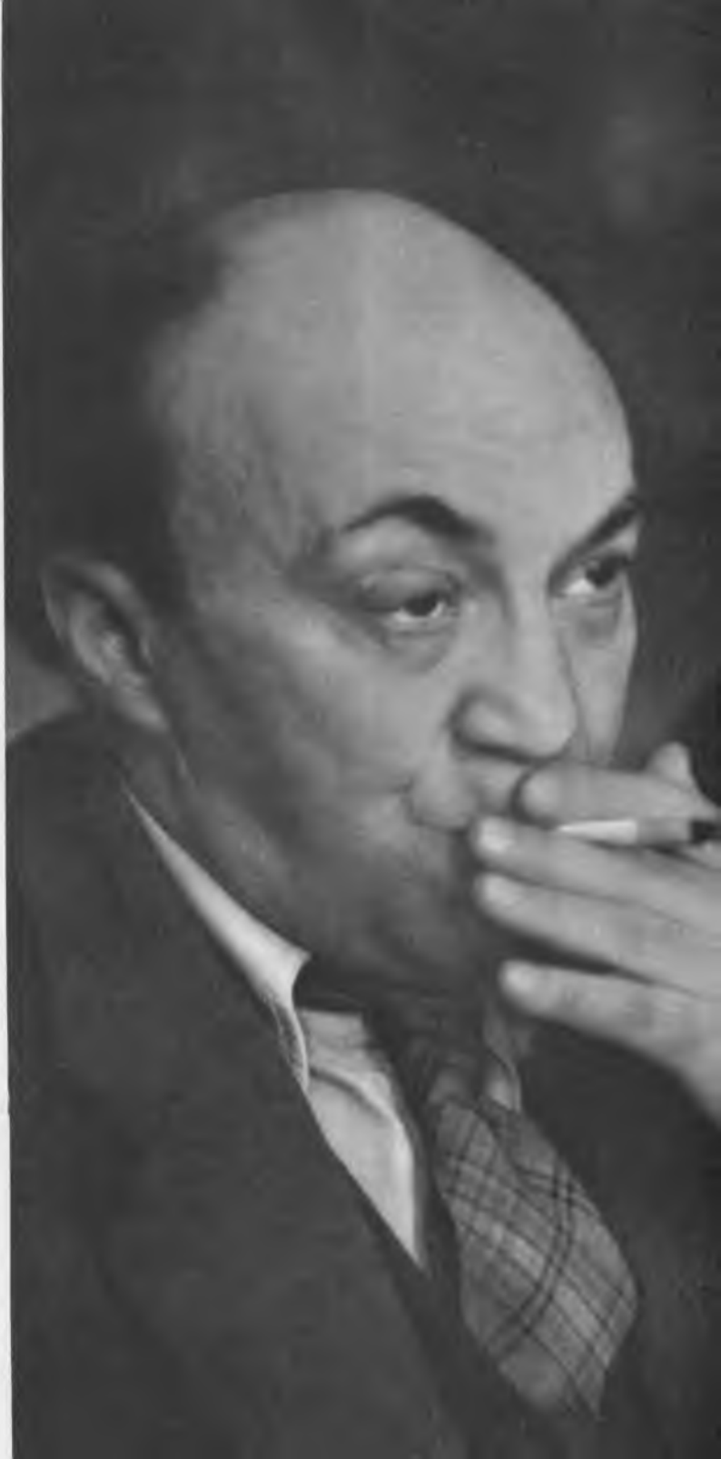
С. М. МИХОЭЛС 1946