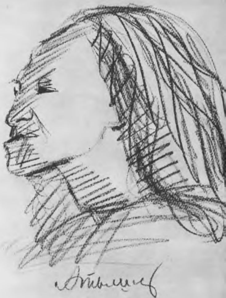
Лир — С. М. Михоэлс. Набросок А. Г. Тышлера. 1935