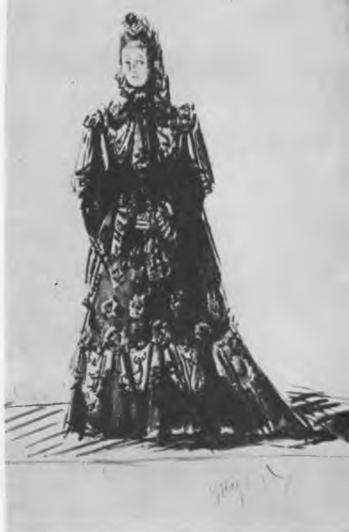
Костюмы к спектаклю «Фрей- лехс». Эскиз А. Г. Тышлера. 1945