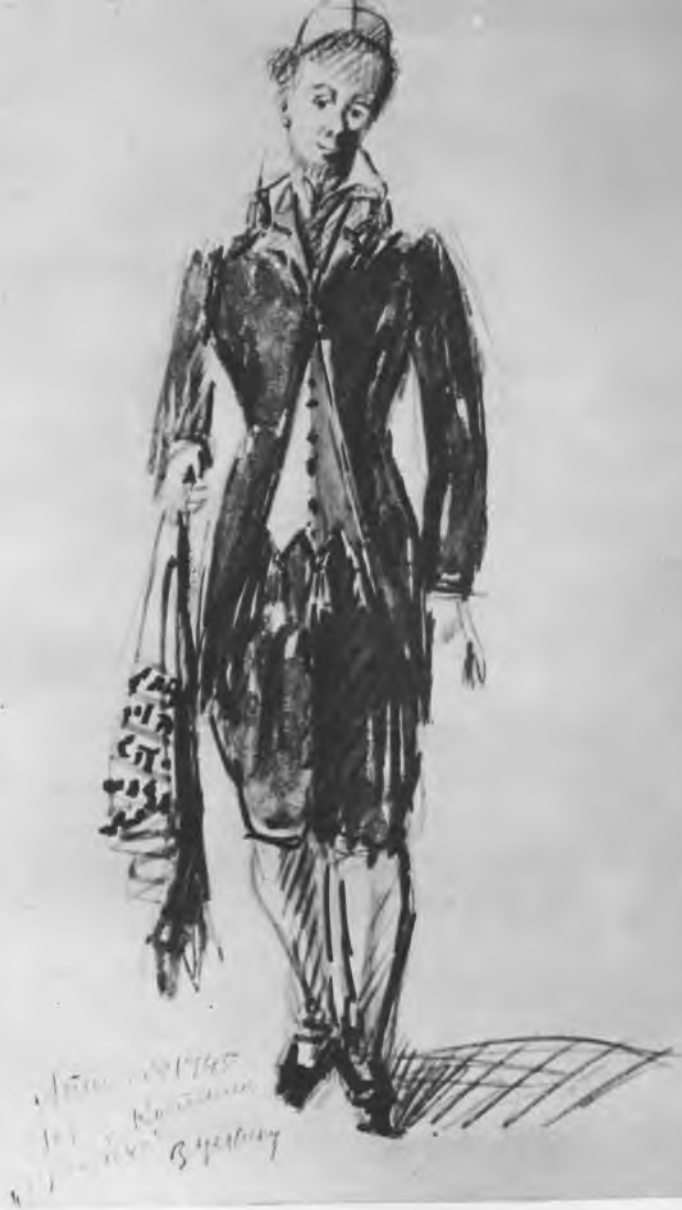
Костюмы к спектаклю «Фрей- лехс». Эскиз А. Г. Тышлера. 1945