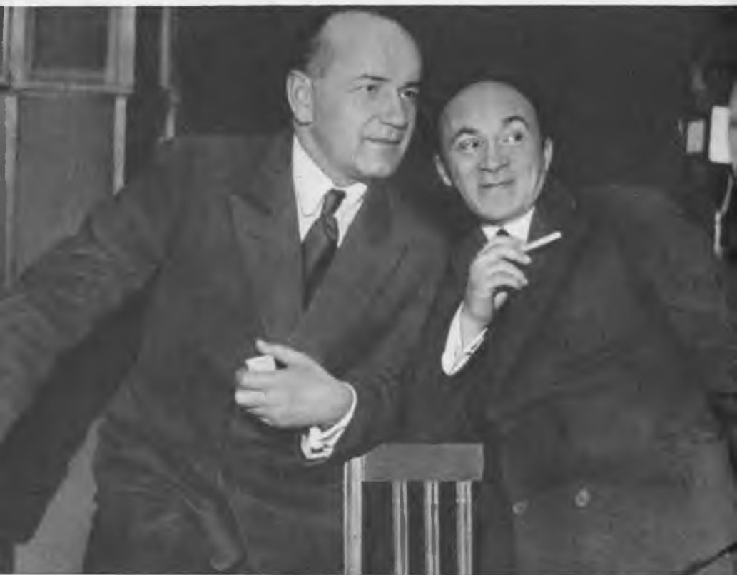
Б. В. ЩУКИН и С. М. МИХОЭЛС. 1935