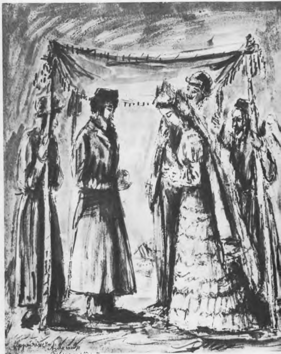
Мизансцена к спектаклю «Фрейлехс». Эскиз А. Г. Тышлера. 1945