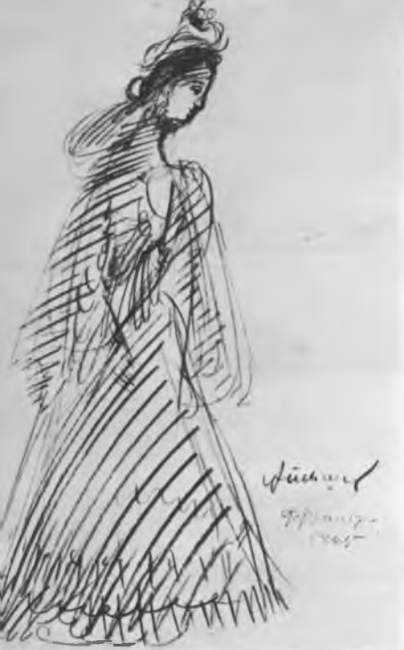
Костюмы к спектаклю «Фрейлекс». Эскиз А. Г. Тышлера. 1945