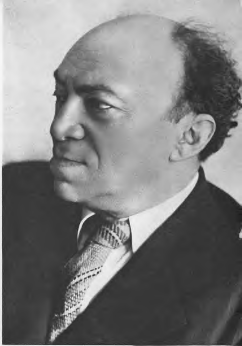
С. М. МИХОЭЛС. 11 ЯНВАРЯ 1943 г., МИНСК