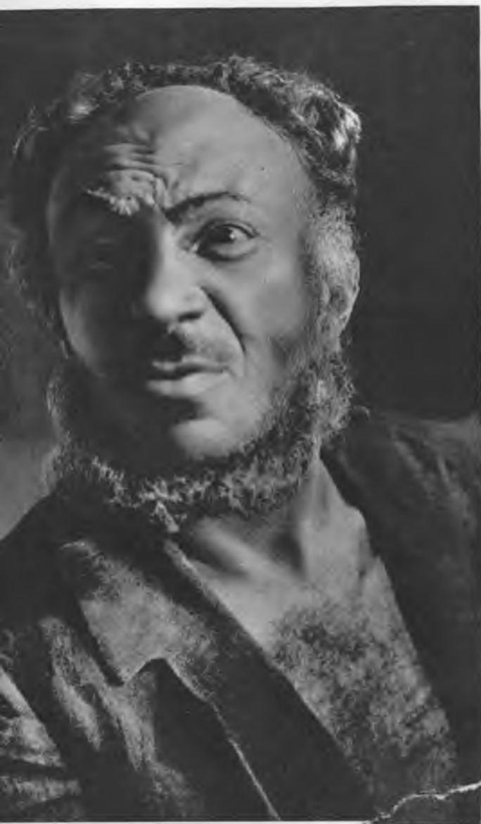
Дантист Гредан. «Миллионер, дантист и бедняк» Э. Лабиша. 1934