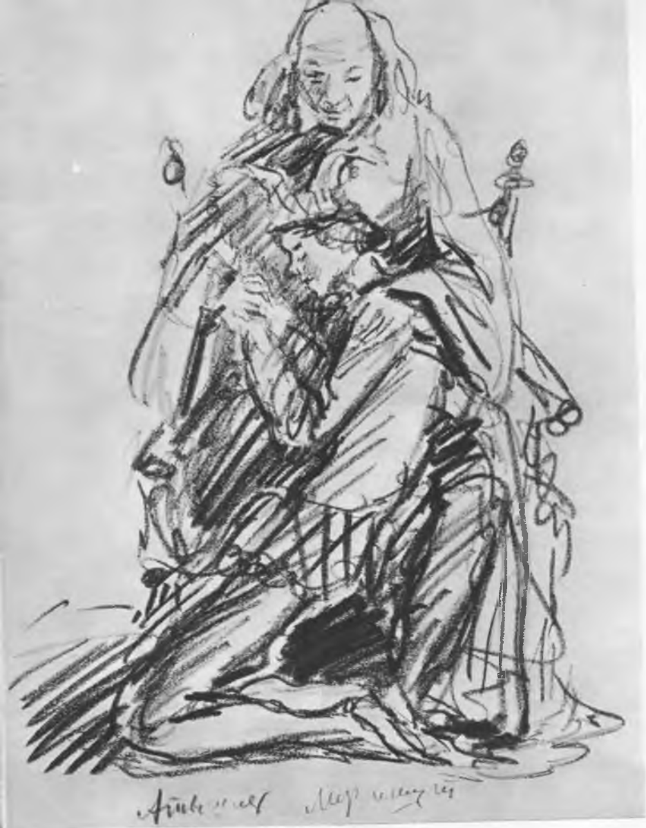
Мизансцена к спектаклю «Король Лир» В. Шекспира. Эскиз А. Г. Тышлера. 1935