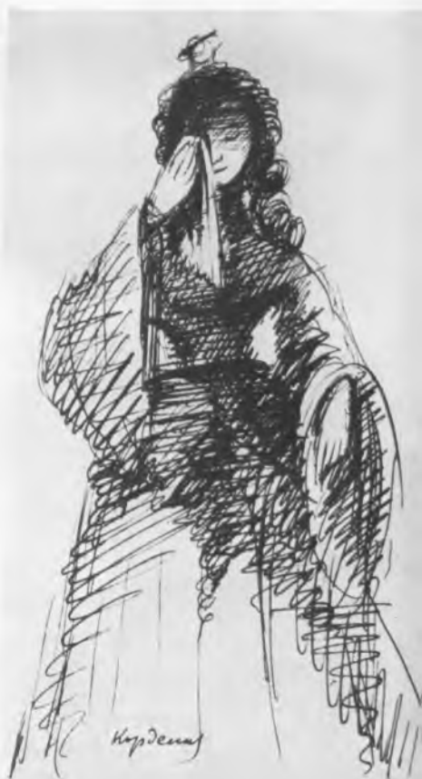
Корделия. Эскиз А. Г. Тышлера к спектаклю «Король Лир» В. Шекспира. 1935