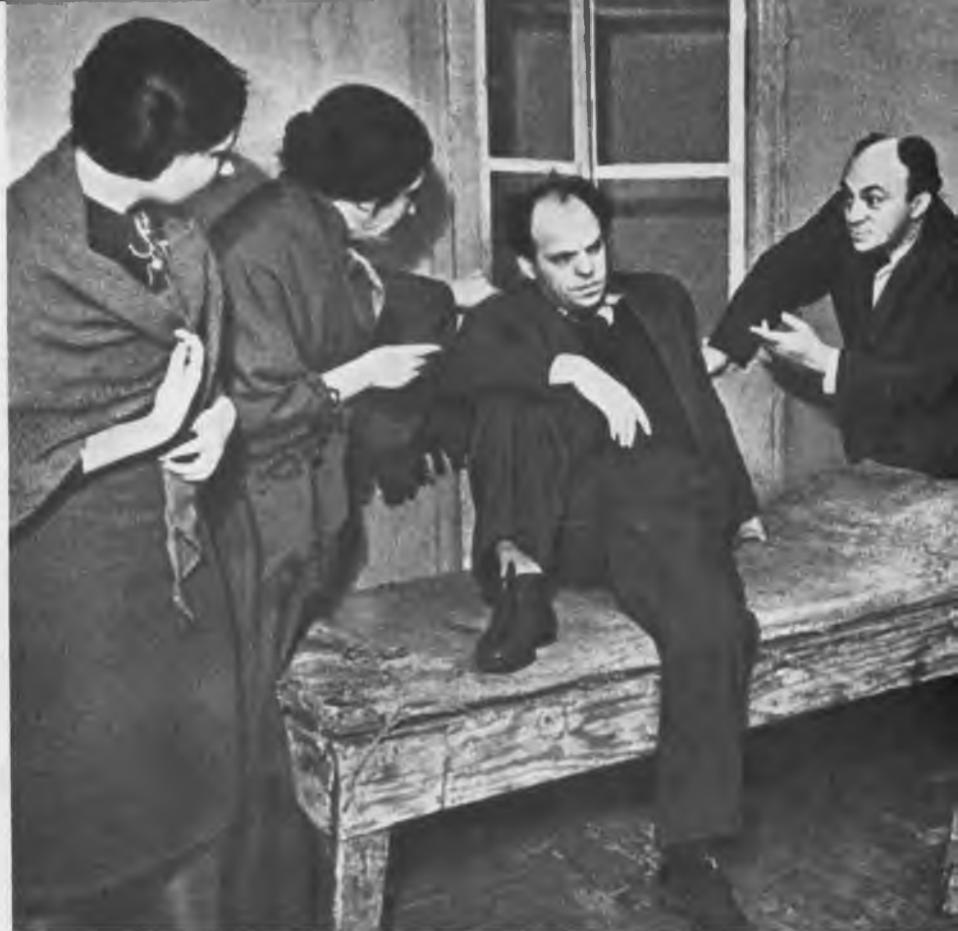
НА РЕПЕТИЦИИ СПЕКТАКЛЯ «БЛУЖДАЮЩИЕ ЗВЕЗДЫ», ПО ШОЛОМ-АЛЕЙХЕМУ. 1940