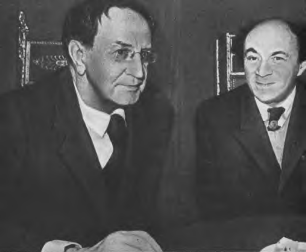
В. И. КАЧАЛОВ И С. М. МИХОЭЛС. 1946