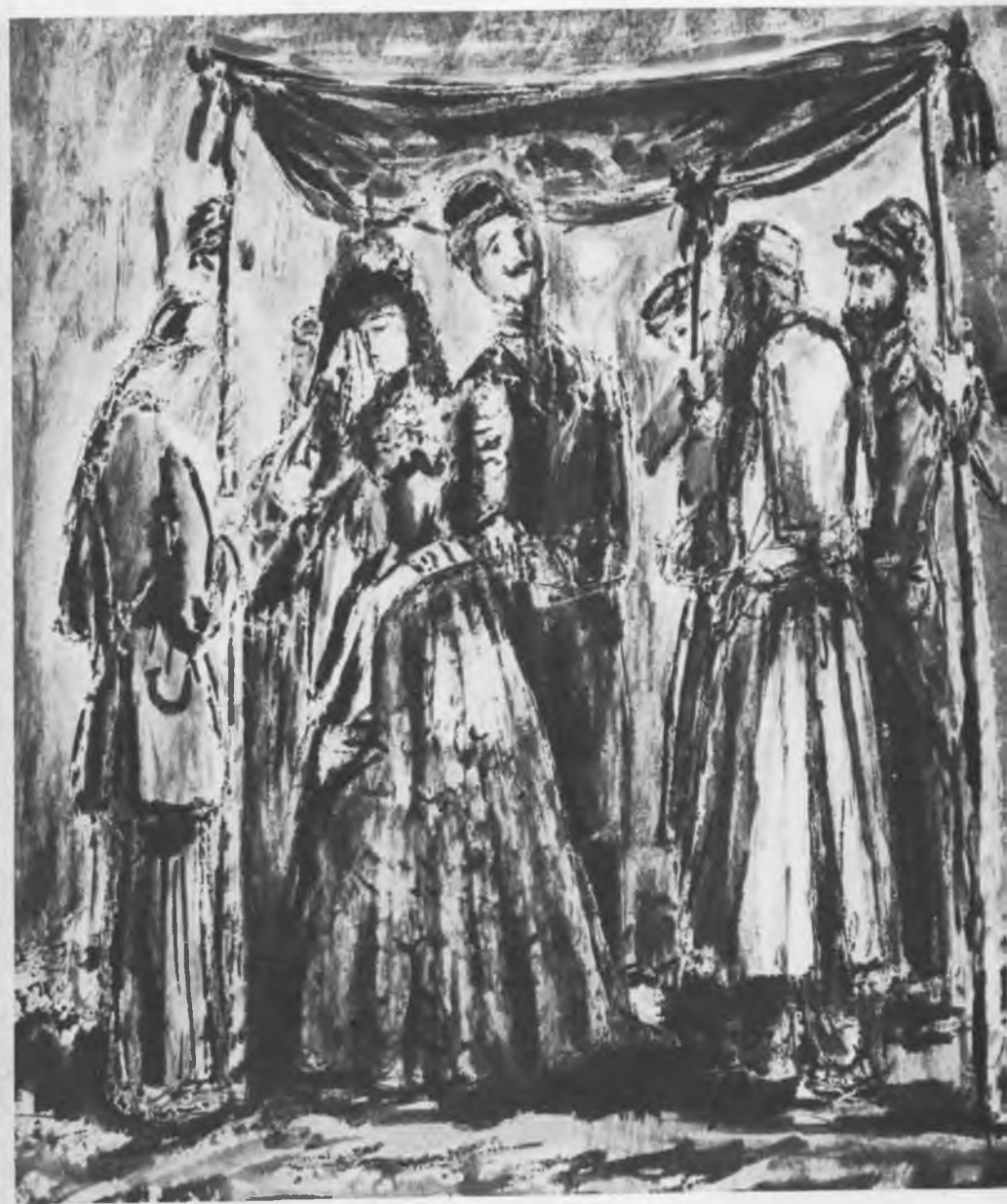
Мизансцена к спектаклю «Фрейлехс». Эскиз А. Г. Тышлера. 1945