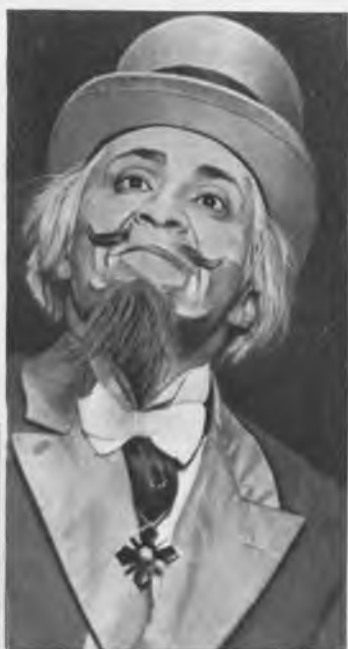
«Трудек» Жюля Ромена. Сцена из спектакля. 1928