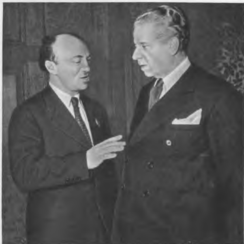
С. М. МИХОЭЛС И МАКС РЕЙНГАРДТ. 1943