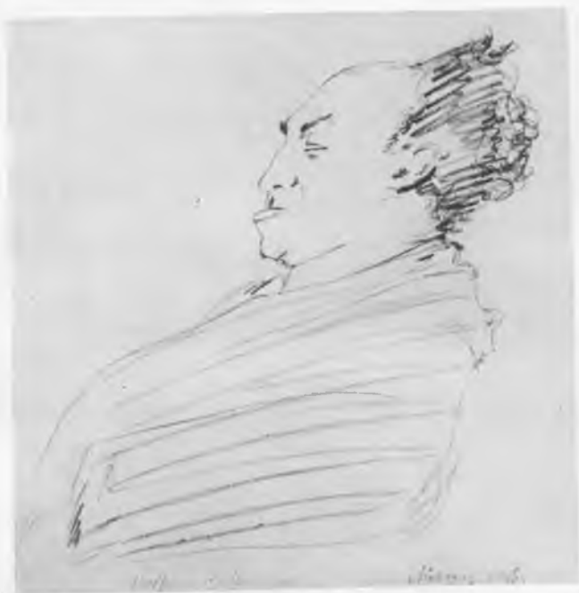
С. М. Михозлс. Набросок А. Г. Тышлера. 1945