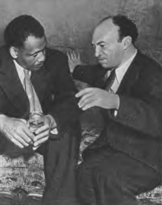
ПОЛЬ РОБСОН И С. М. МИХОЭЛС. 1943