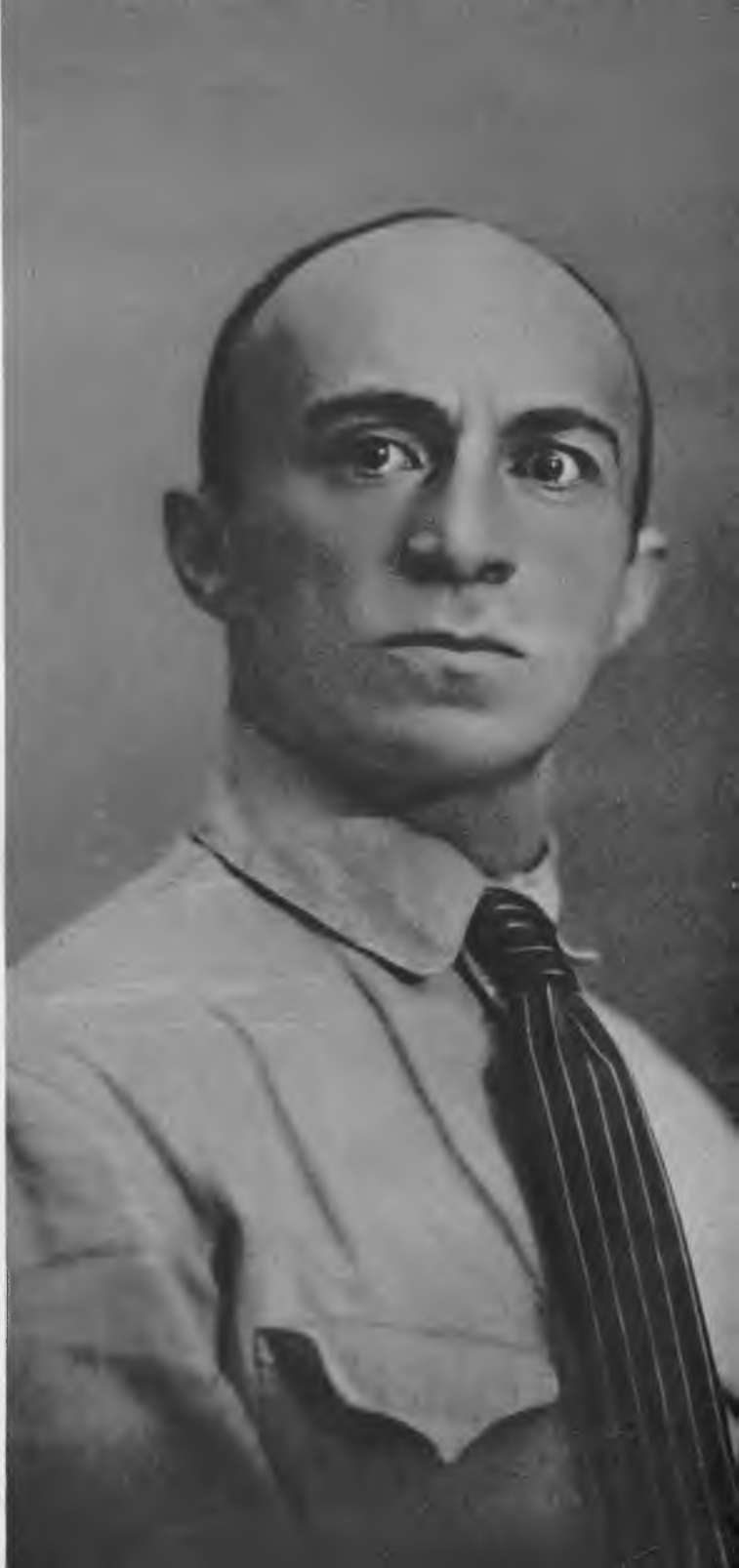
С. М. МИХОЭЛС. 1919