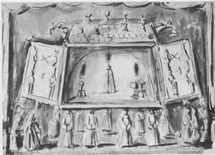
«КОРОЛЬ ЛИР» В. ШЕКСПИРА. ЭСКИЗ ДЕКОРАЦИИ А. Г. ТЫШЛЕРА, 1935