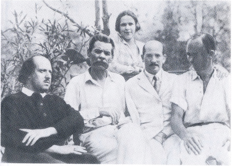
Слева направо: Б.М.Зубакин, М.Горький, Н.А.Пешкова, З.М.Пешков, М.А.Пешков. 1927. Сорренто. Архив Ю.М.Каган.