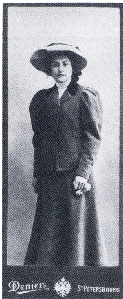
М.М.Лихтенштадт. 1900-е.