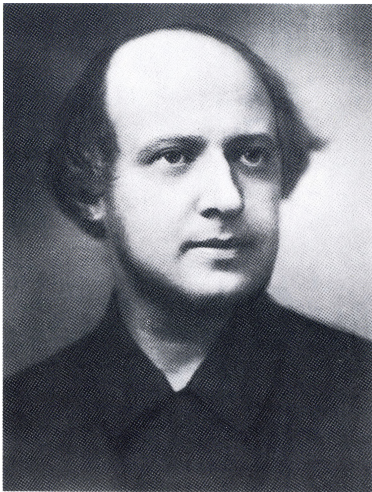
Б.М.Зубакин. Москва. 1933.