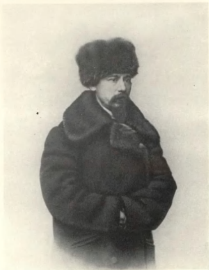
Н. А. НЕКРАСОВ Фотография 1868 г.