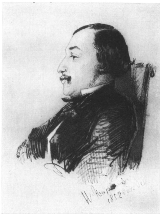
Н. А. НЕКРАСОВ

Рисунок карандашом П. Петровского. 1852 г.