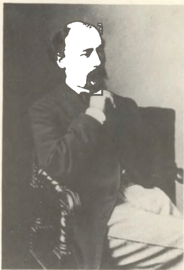
Н. А. НЕКРАСОВ 1865 г.