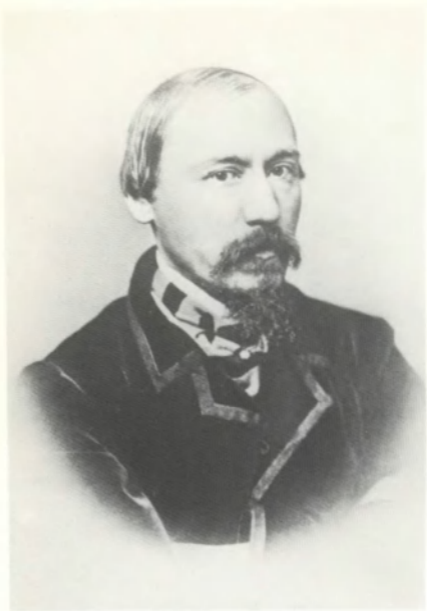
Н. А. НЕКРАСОВ. Фотография. 1861 г. ИРЛИ.