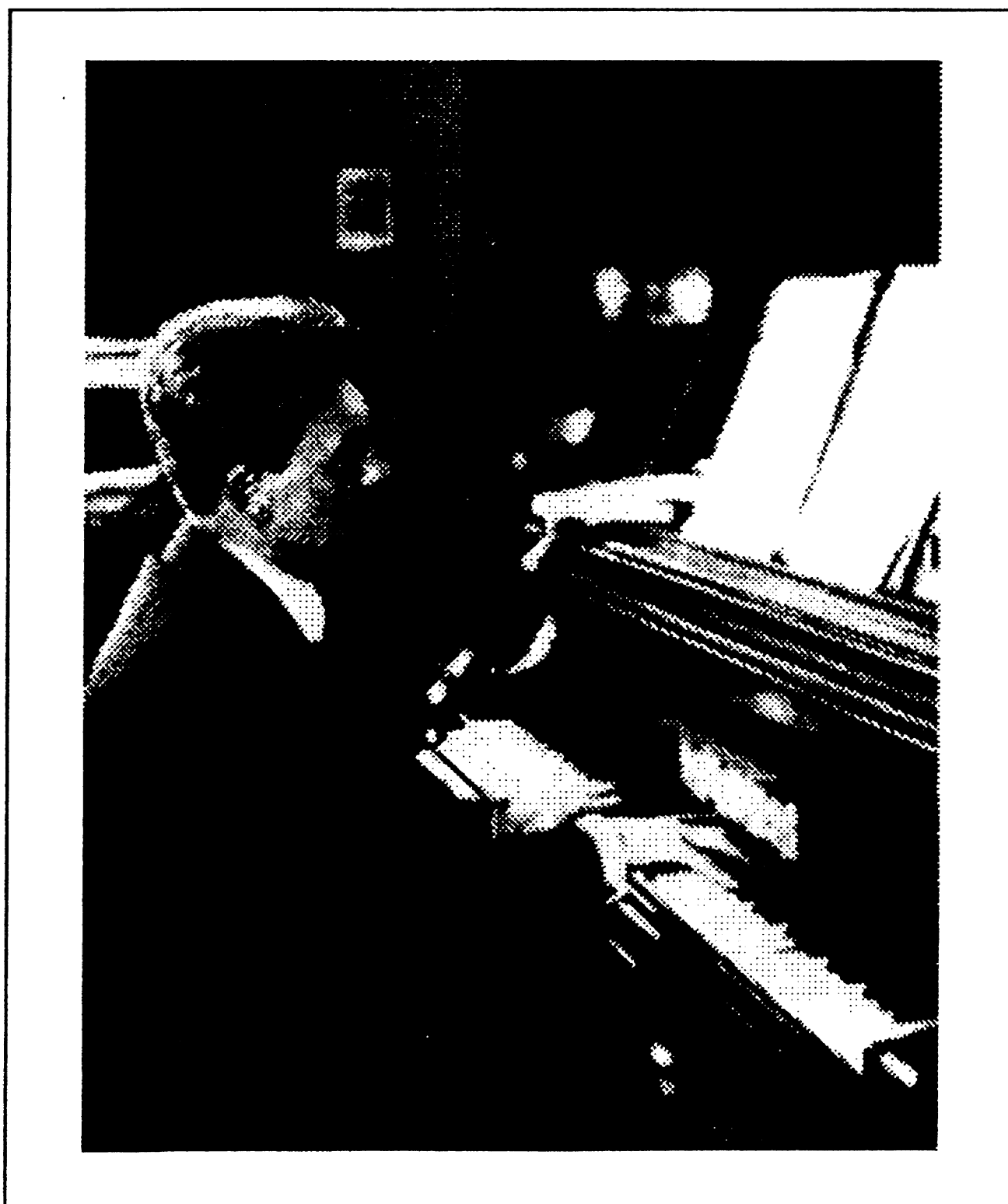
Г.Г.Нейгауз за роялем, 1949 г.