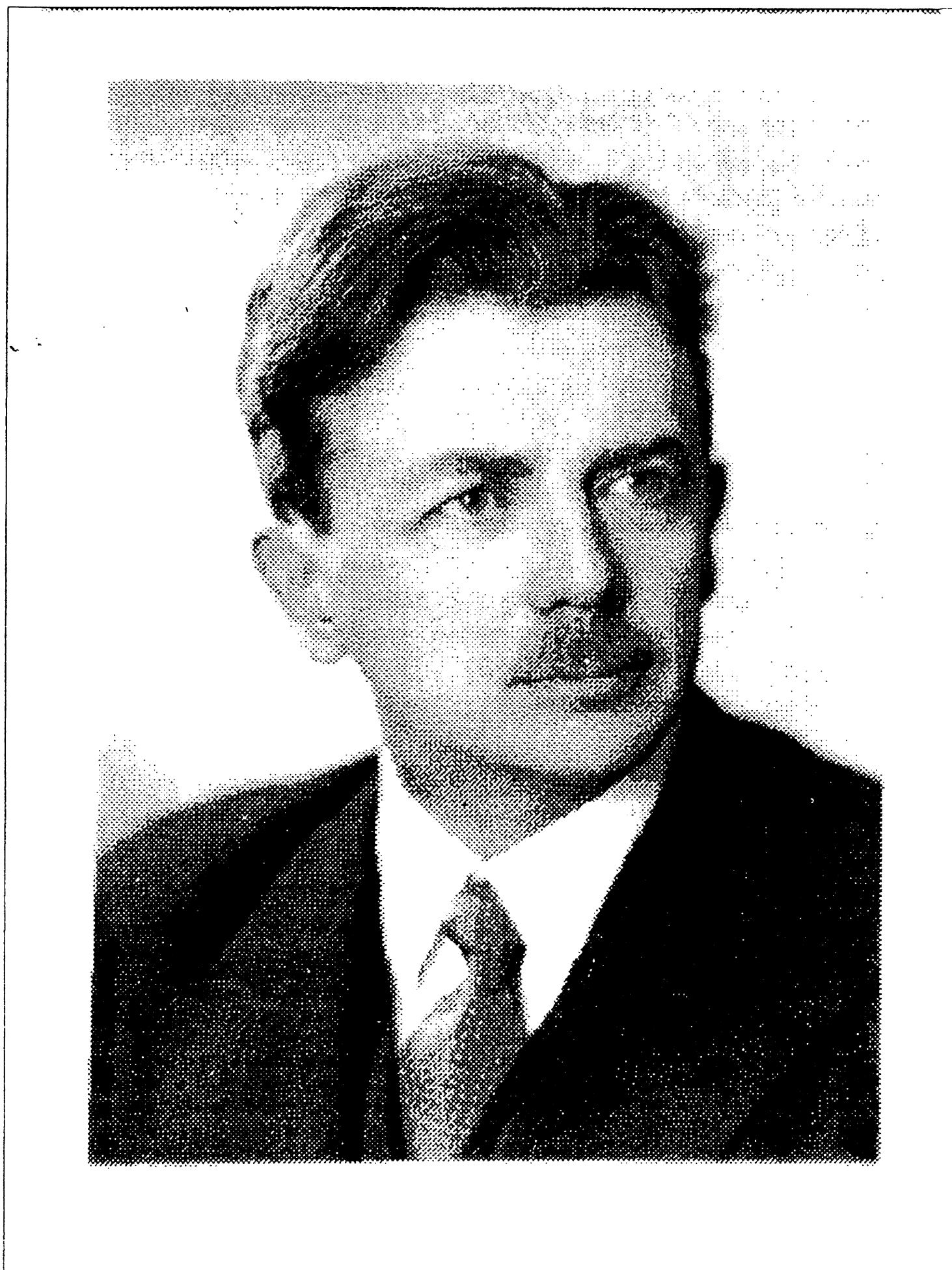
Г.Г. Нейгауз, 1936 г.