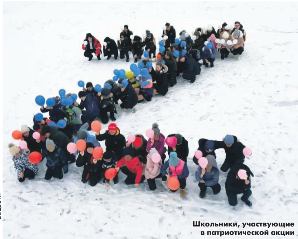
Школьники, участвующие в патриотической акции

«От каждого учреждения предоставляются работы в Дом детского творчества Ивантеевского района до 25 марта 2022 года. В социальные сети выставлять с хэштегами: #ПисьмоСолдату, #Своихнебросаем #ЗначитПобеда, #НашеДелоПравое».