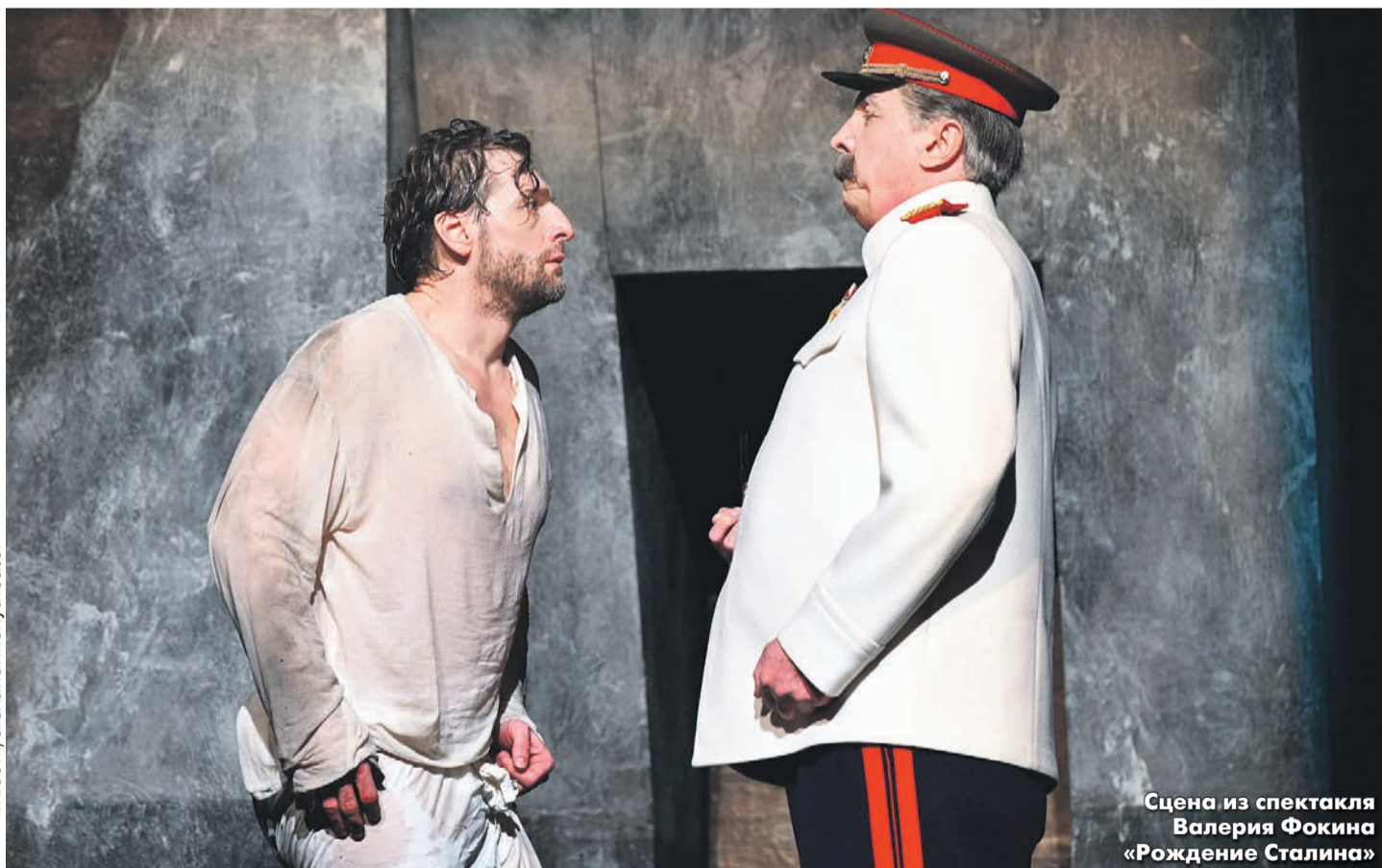
Сцена из спектакля Валерия Фокина «Рождение Сталина»

Поэтому когда мне сказали, что надо чтобы молодой режиссер вступил в КПСС, я сразу абсолютно цинично решил: если хочу добиться того, чего хочу, я должен это защитить. Другое дело, что эта защита недолго продержалась, это была одна из иллюзий, с которыми мы все сталкиваемся. Какое-то время мне удавалось на голубом глазу,