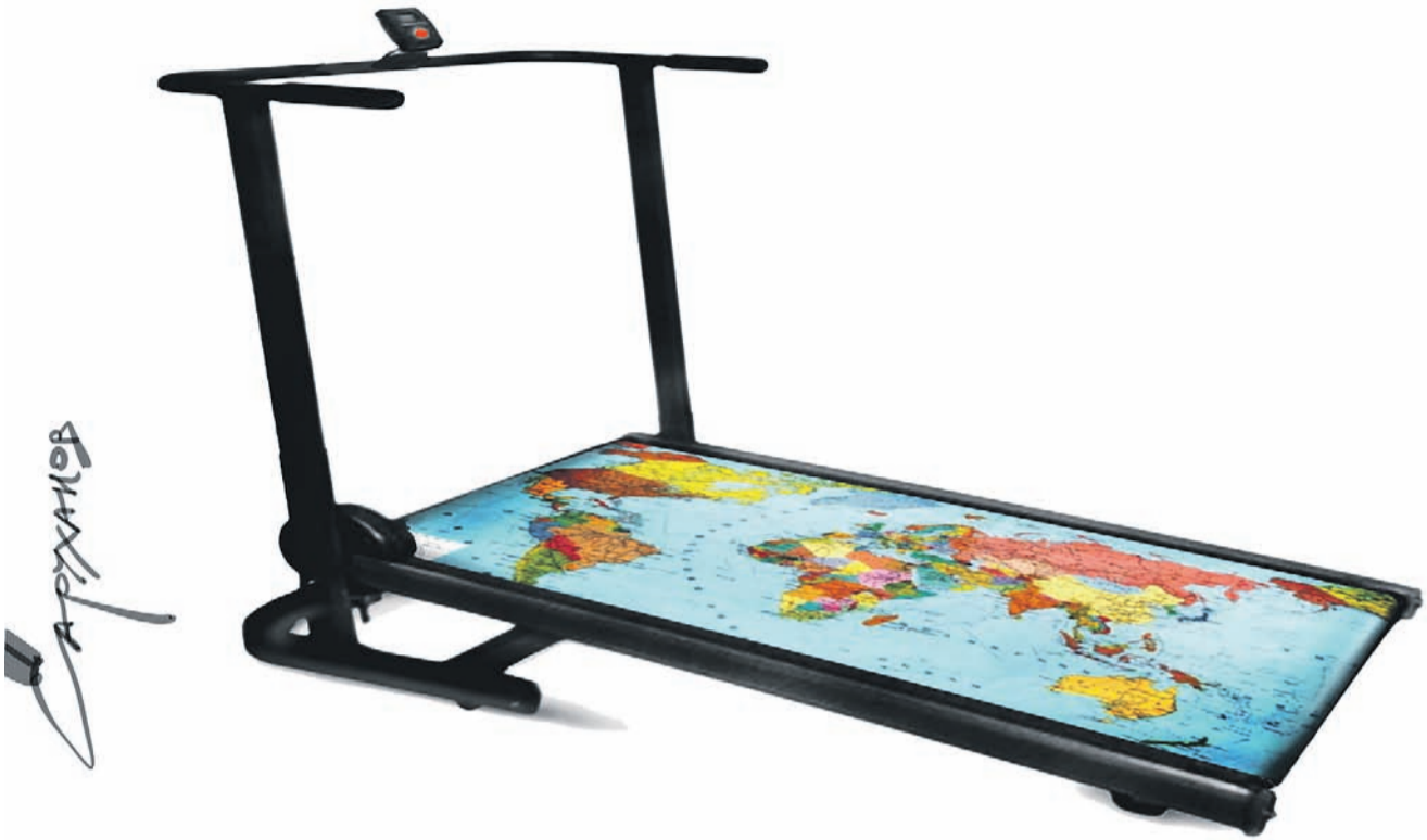
Петр САРУХАНОВ — «Новая»

Брежнева, про Четвертую и спрашивать нечего. Конечно, за последние тридцать лет хватало и других эмигрантов, но это был постоянный, как из многих стран, прилив, ничем не похожий на то, что происходит сейчас: цунами.