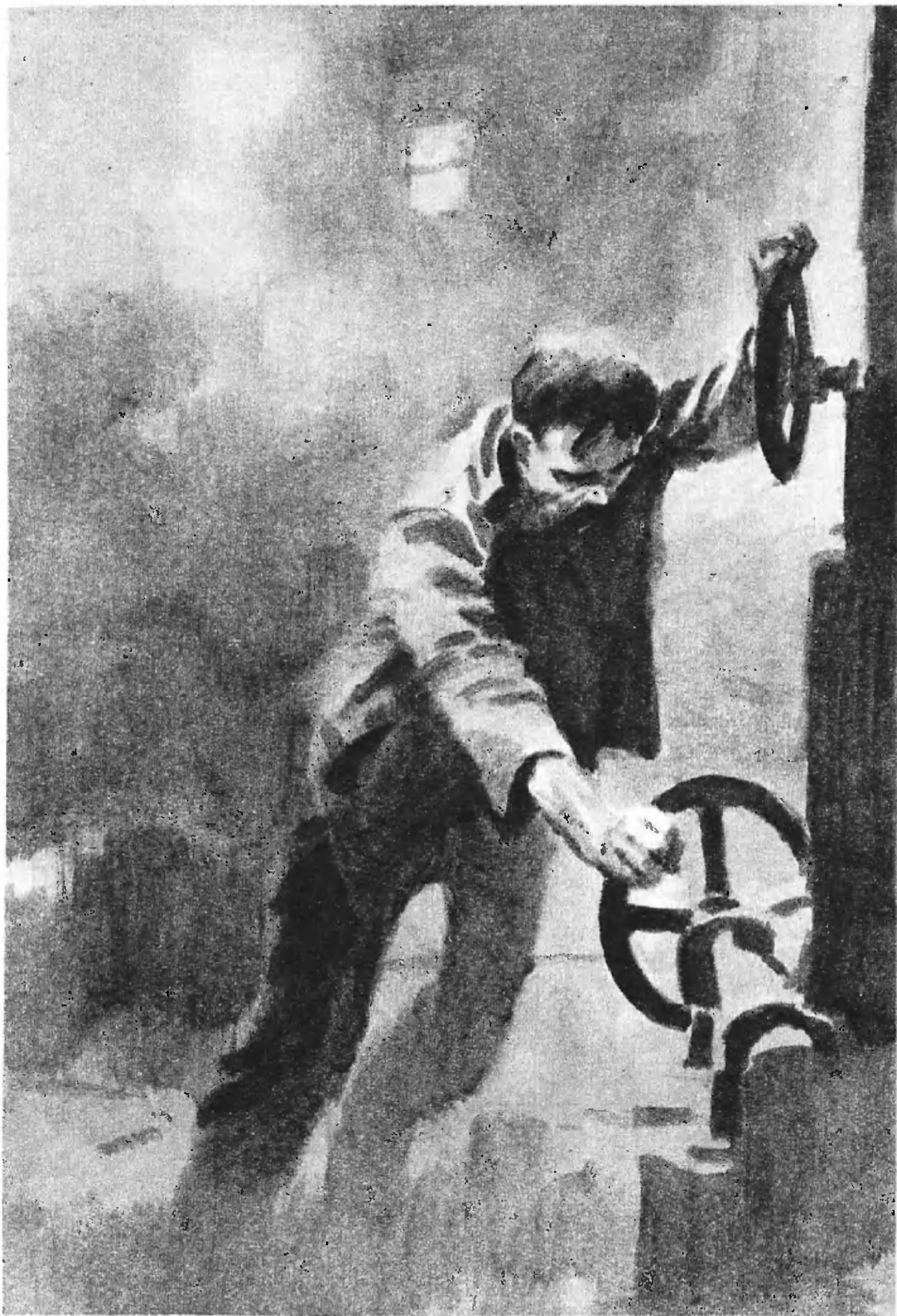
«В БУХТЕ «ОТРАДА»»