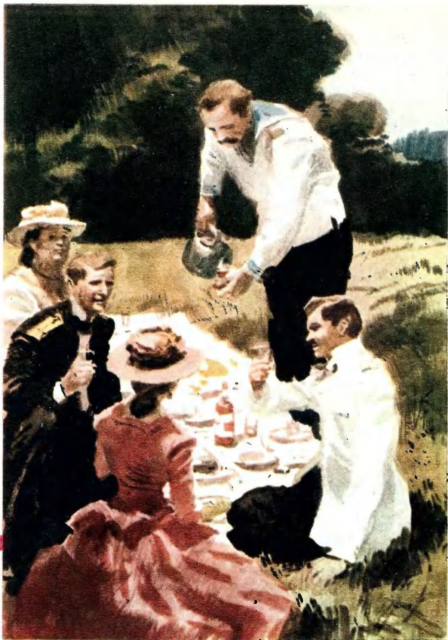
«КАПИТАН 1-го РАНГА».