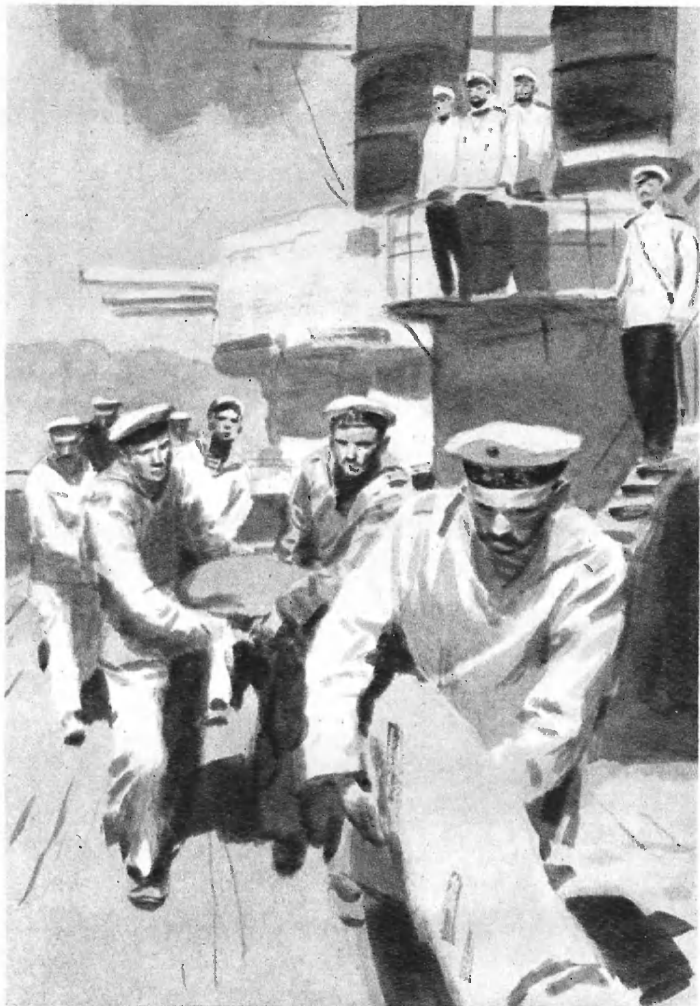
«КАПИТАН 1-го РАНГА».