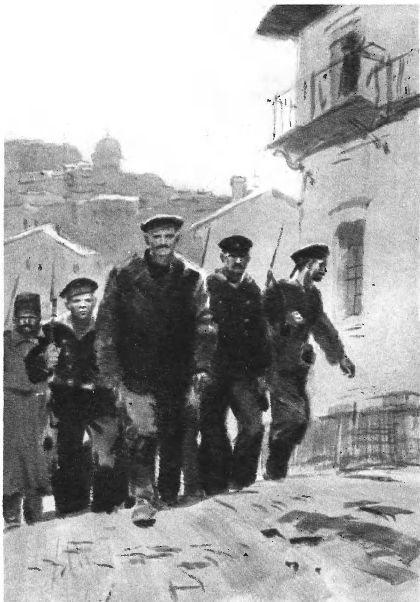
«КАПИТАН 1-го РАНГА»