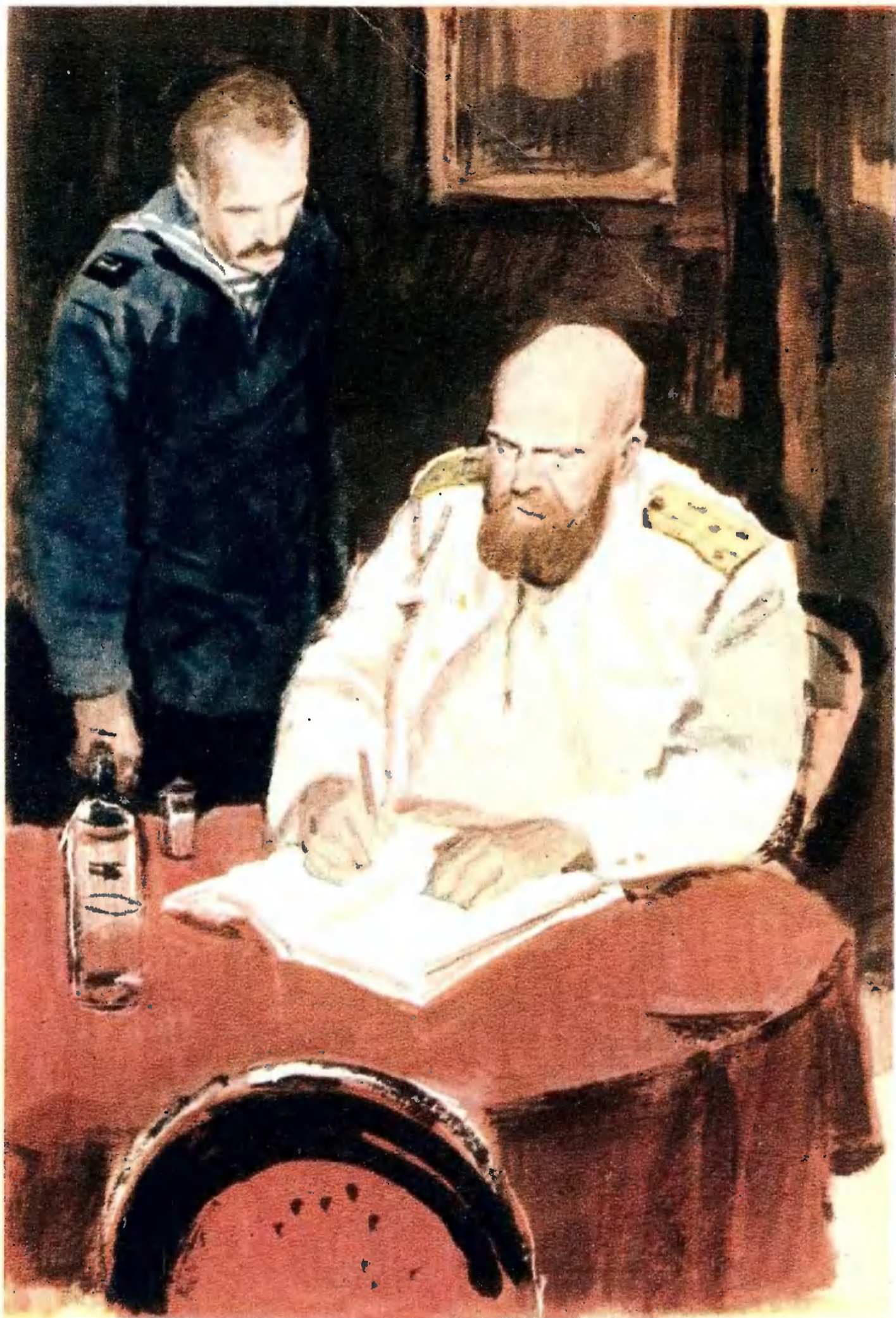
«КАПИТАН 1-ГО РАНГА».