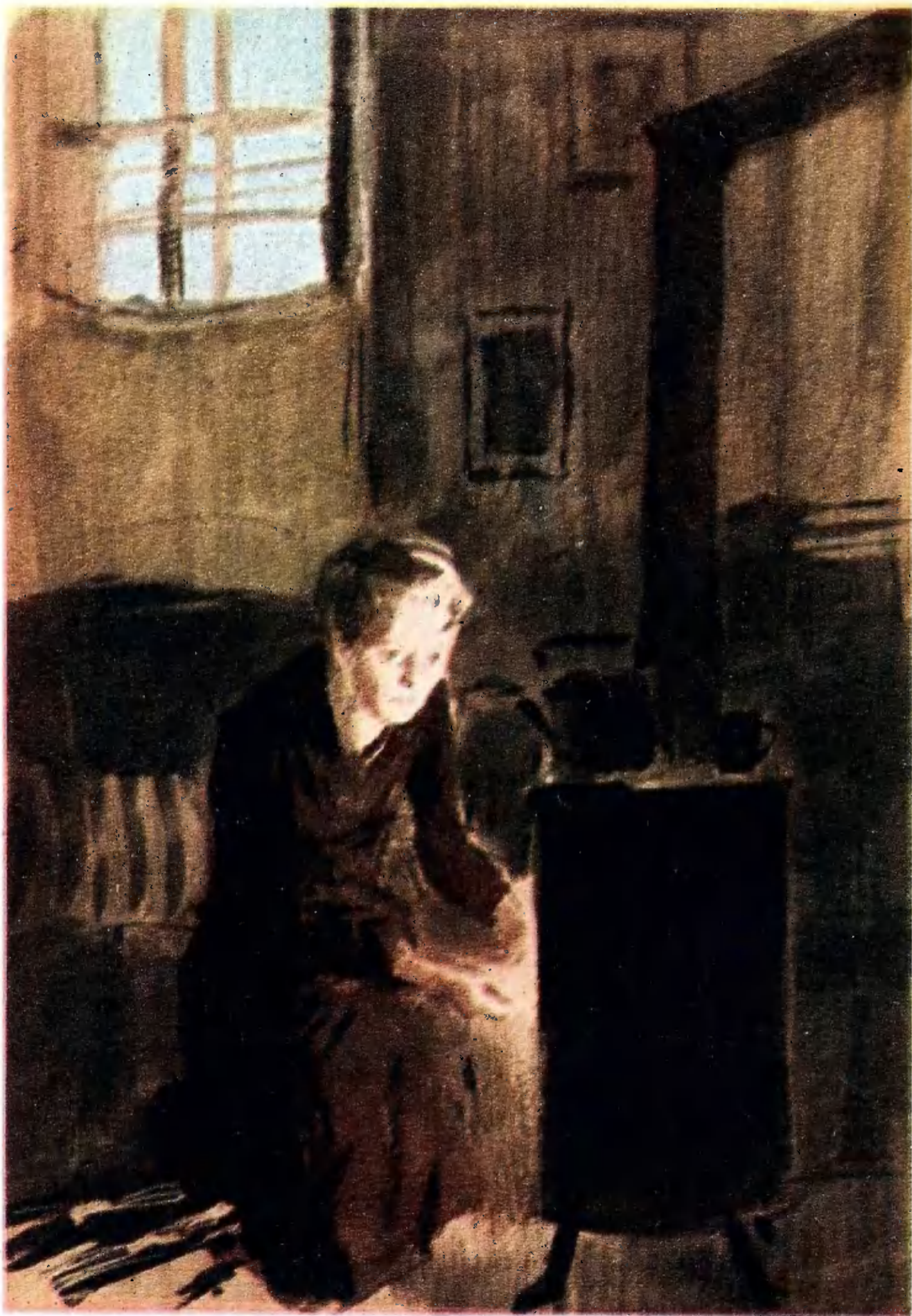
«КАПИТАН 1-го РАНГА»