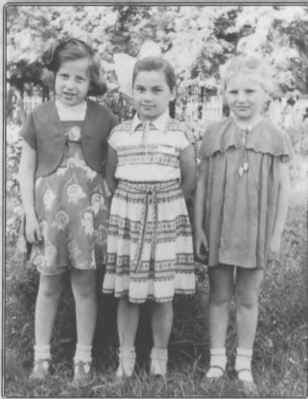
С соседками по даче