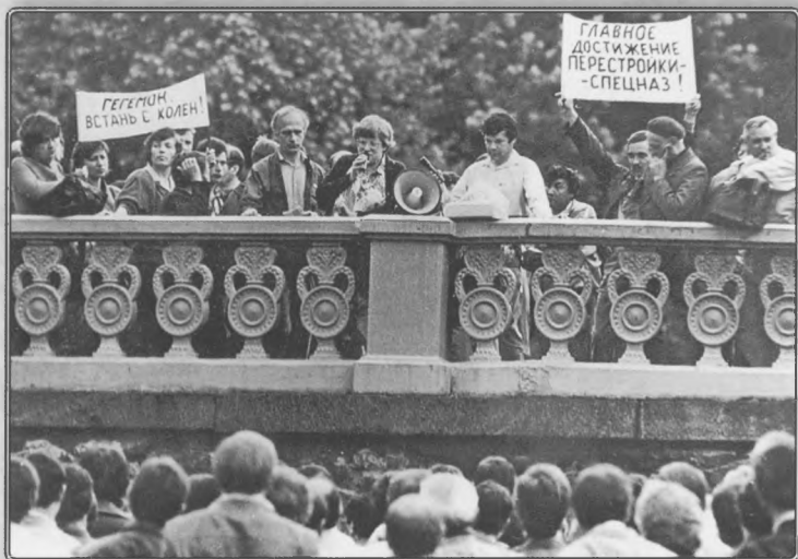
Митинг за отделение Украины от России. Харьков, июль 1990 года.