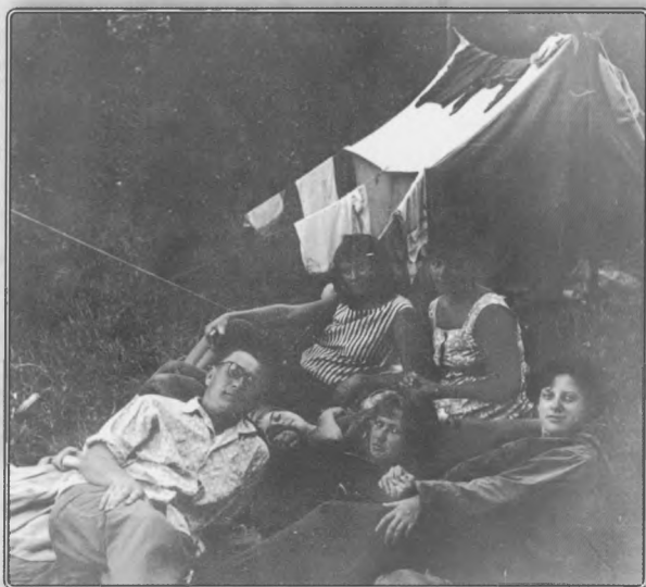
Конец 60-х, студенчество