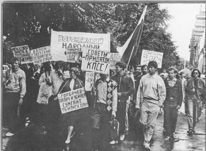
Антигорбачевский митинг. Воронеж, июнь 1990 года. Из архива ДС