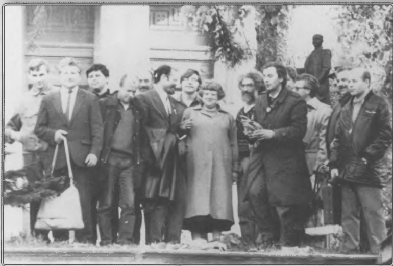
Делегаты 4-го съезда «Демократического Союза». Киев, май 1990 года.