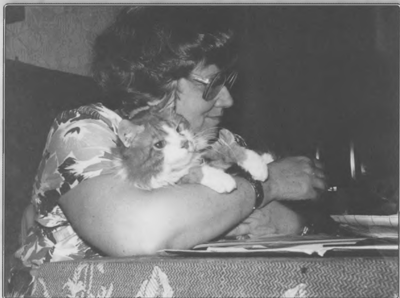
«Люблю котов, потому что они индивидуалисты, либералы и западники».