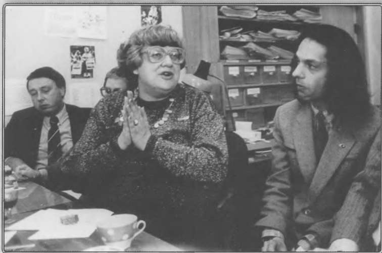
В редакции.