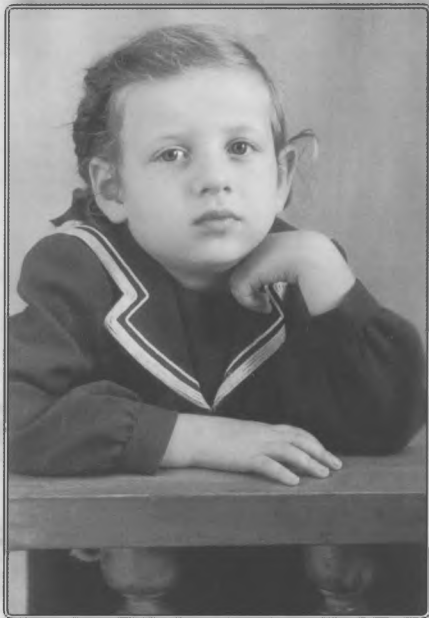
1954 год