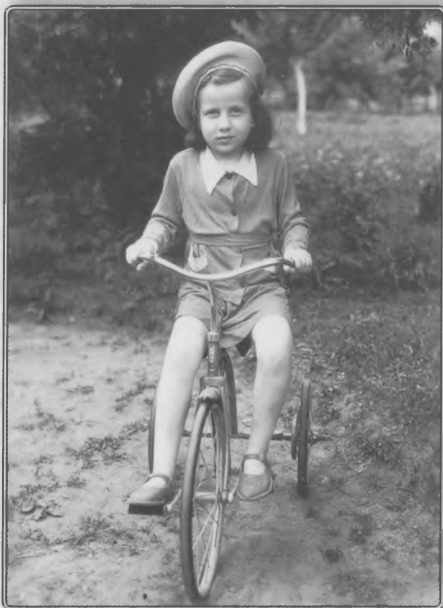
1956 год