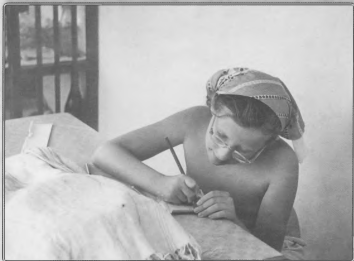
Начало 60-х годов