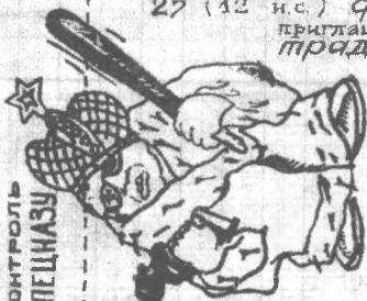
Приглашение на митинг