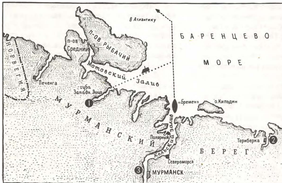
Маршруты лайнера «Бремен» и германских подводных лодок, базировавшихся в Западной Лице. 1 — местоположение германской «Базы Норд», 2 — предполагавшееся местонахождение «Базы Норд» в Териберке; 3 — стоянка лайнера «Бремен» в Мурманске.

берка и наличием там довольно большого рыбацкого поселка. Баумбах считался крупным специалистом по русскому Северу, и не соглашаться с ним не было оснований.