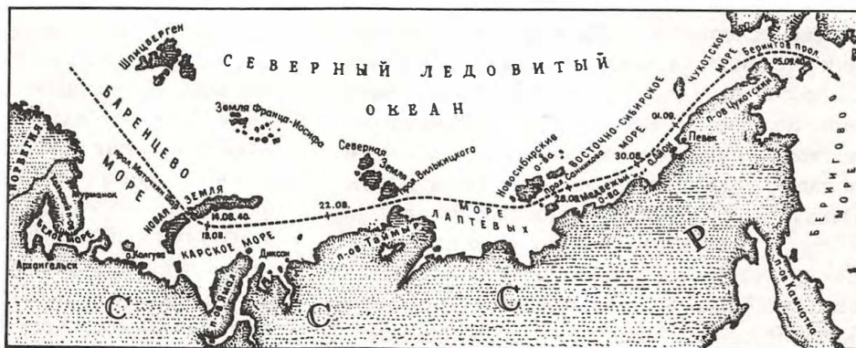
Маршрут германского рейдера «Комет» при следовании Северным морским путем в арктическую навигацию 1940 г.