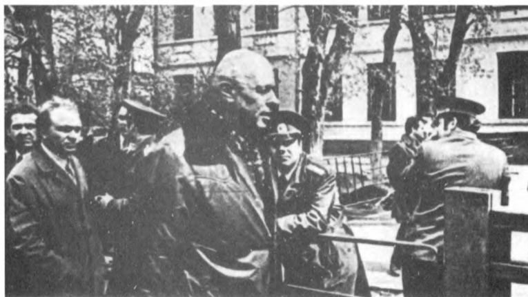
А. Д. Сахаров у здания суда во время процесса над Ю. Ф. Орловым, 1978 г.