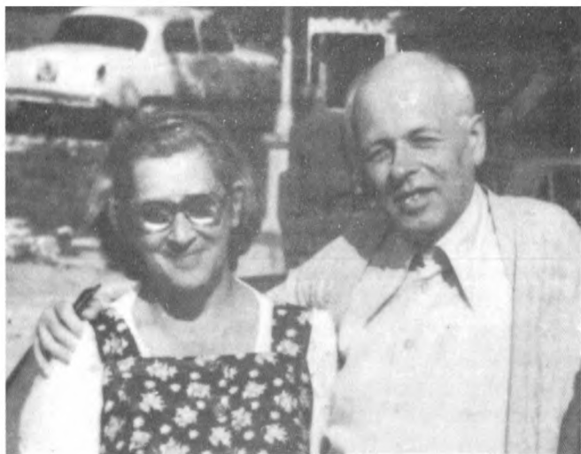
Е. Г. Боннэр и А. Д. Сахаров