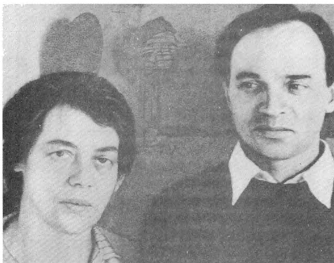
Лариса Богораз и Анатолий Марченко, которому посвящена эта книга