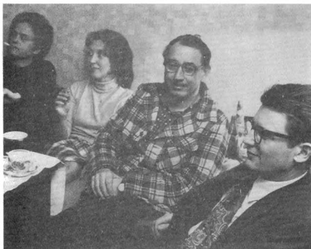
Ю. Орлов, А. Гинзбург, В. Турчин, А. Амальрик