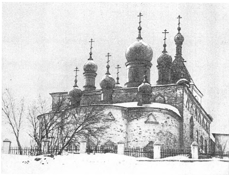
Собор архангела Михаила в Яицком городке (ныне г. Уральск) — цитадель внутренней городской крепости, осаждаемой отрядами Пугачева в январе — апреле 1774 г.