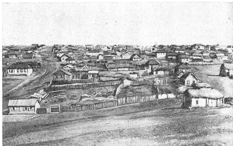
Село Нижне-Озерное, бывшая Нижне-Озерная казачья станица, которую 20 сентября 1833 г. посетил Пушкин