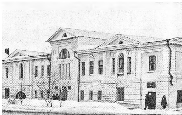
Дом наказных атаманов Уральского казачьего войска в г. Уральске, где у атамана В. О. Покатилова останавливался Пушкин 21—23 сентября 1833 г.