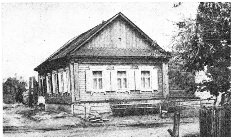
Дом Смолиных в Бердской слободе, на месте которого стояла изба казака К. Е. Ситникова — «государев дворец» Пугачева в ноябре 1773 — марте 1774 г.