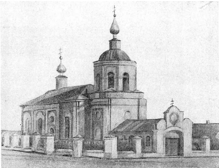
Георгиевская церковь в Форштате (предмесье Оренбурга), с колокольни которой пугачевская артиллерия обстреливала город в ноябре 1773 г.