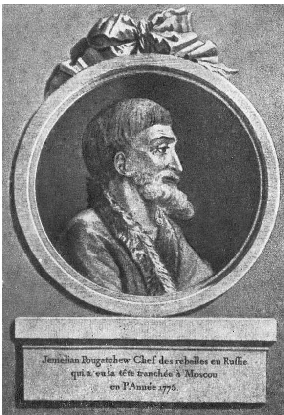
Пугачев в тюремной камере Московского монетного двора. Гравюра Леттелье по рисунку И. де Мальи, 1775 г.