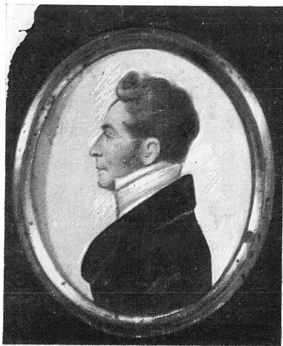
Вверху: Н. И. Надеждин. Непзв. художник. Масло. 1830-е гг.; П. Я. Чаадаев. Литография. 1830-е гг. Внизу: Н. А. Полевой. Гравюра. 1839; П. И. Шаликов. Непзв. художник. Миниатюра. 1810-е гг.