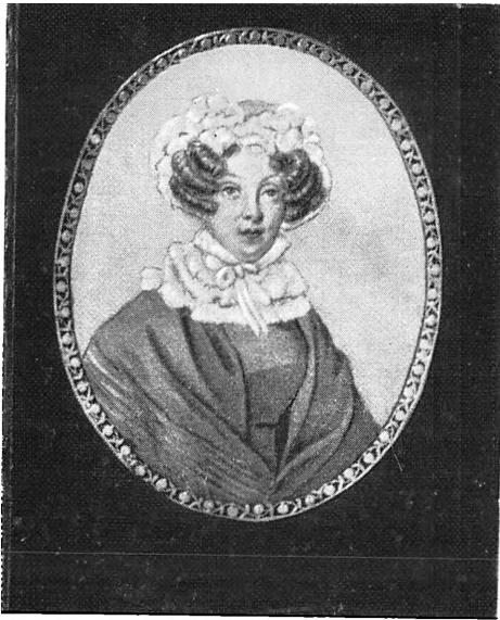
П. И. Гончарова Пензл. художник. Акварель. 1820-е гг.