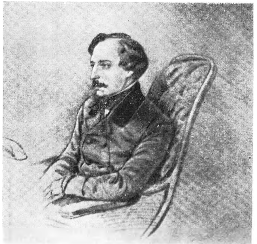
И. Н. Гончаров Н. Ланской. Рисунок. 1852