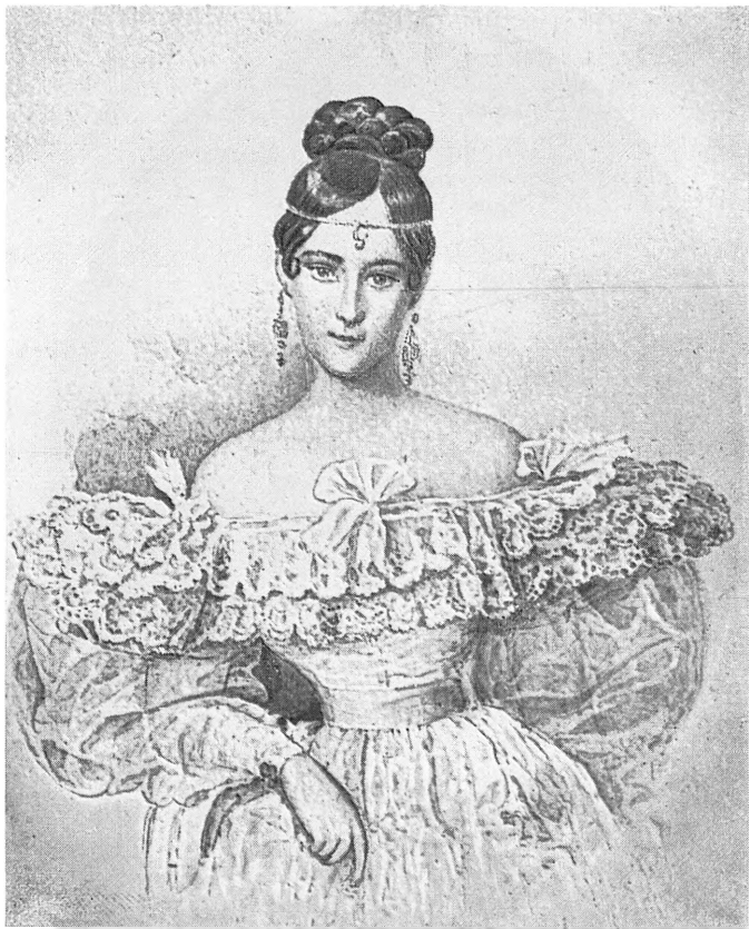
Н. Н. Пушкина А. П. Брюллов. Акварель. 1831—1832