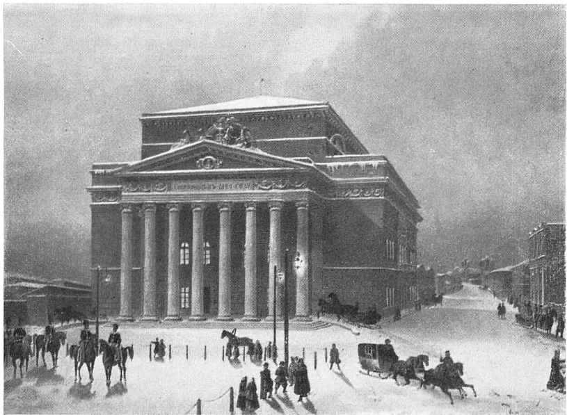
Благородное собрание. Литография