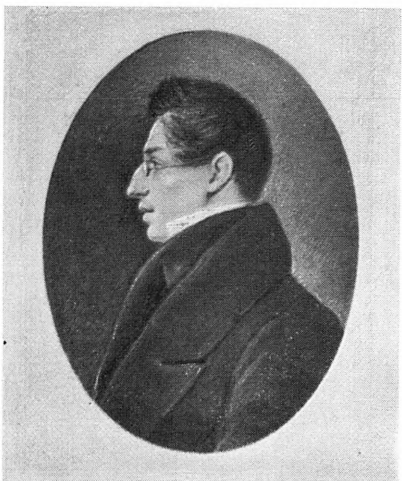
Вверху: Е. П. Ростопчина, Литография, 1840-е гг.; Д. В. Голицын, Неизв. художник, Масло, 1830-е гг. Внизу: Е. С. Семнова, Гравюра П. И. Уткина, 1816; М. А. Максимович, Фототипия с портрета 1830-х гг.