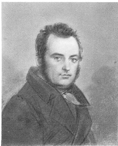
Вверху: А. Я. Булгаков. Гравюра А. А. Афанасьева. 1820-е гг.; П. П. Вяземская. Ф. Бруш. Акварель. 1835 Внизу: В. Ф. Вяземская. А. Молишари. Акварель, 1800-е гг.; С. Н. Глинка, В. П. Лангер. Акварель. 1820-е гг.