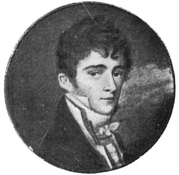
П. А. Гончаров Миниатюра. 1800-е гг.