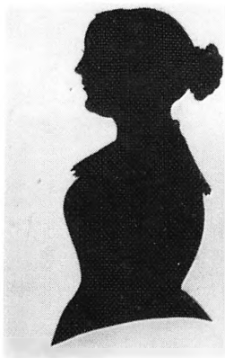
А. Н. Гончарова Неизв. художник. Силуэт. 1840-е гг.