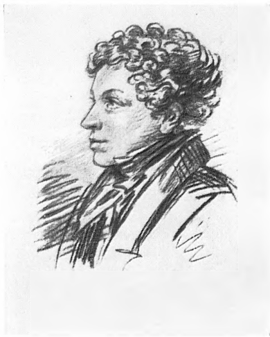
Вверху: Д. В. Давыдов. В. П. Лангер. Акварель, 1819; П. М. Языков. Литография, 1840-е гг. Внизу: П. А. Вяземский. Литография, 1830-е гг.; Л. С. Пушкин, А. О. Орловский. Рисунок, 1820-е гг.