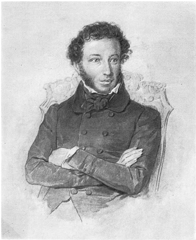
А. С. Пушкин П. Ф. Соколов. Акварель. 1830—1836