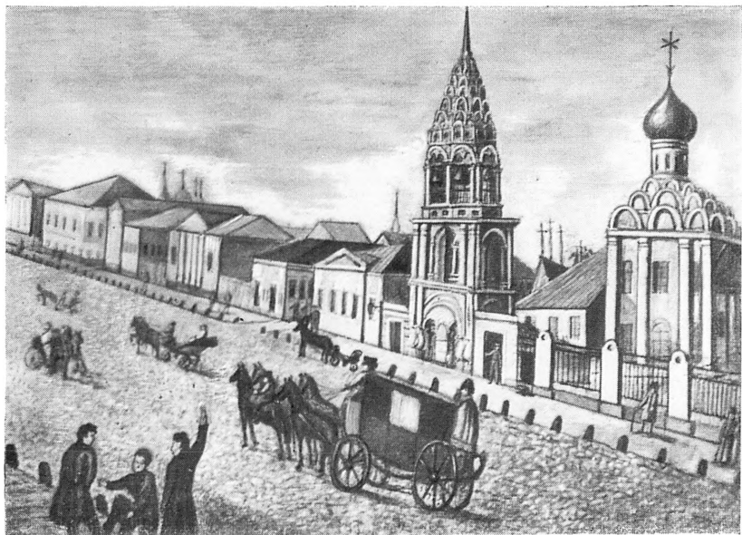
Тверской бульвар. Литография А. Кадоля. 1825