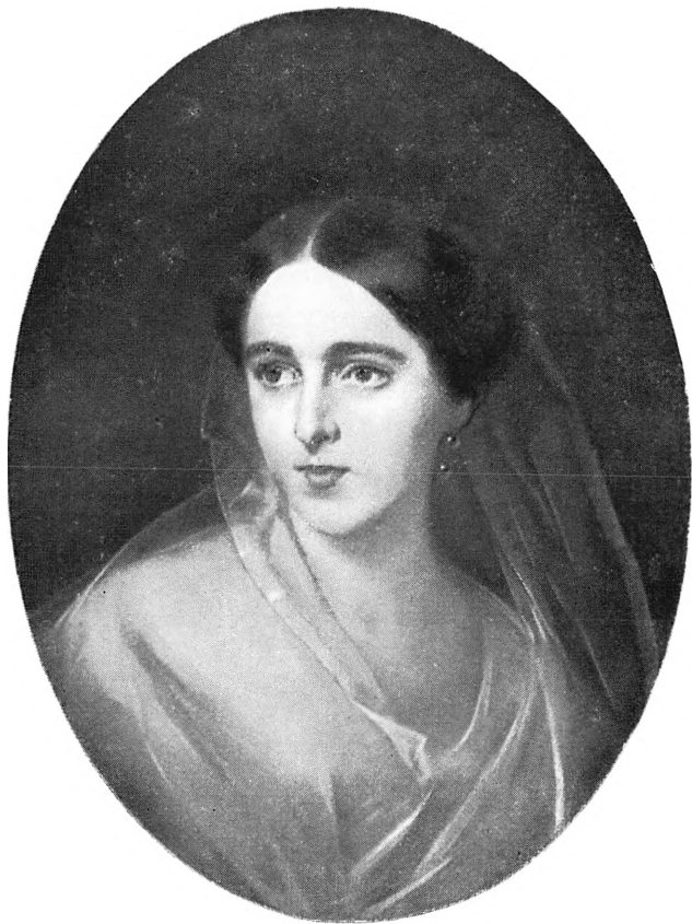
Н. Н. Пушкина И. К. Макаров. Масло. 1849