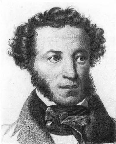
Портреты А. С. Пушкина Вверху: Ж. Вишняев. Миниатюра. 1826; О. А. Кипренский. Масло. 1827 Внизу: В. А. Тропинин. Масло. 1827; Гравюра Г. Райта. 1836—1837