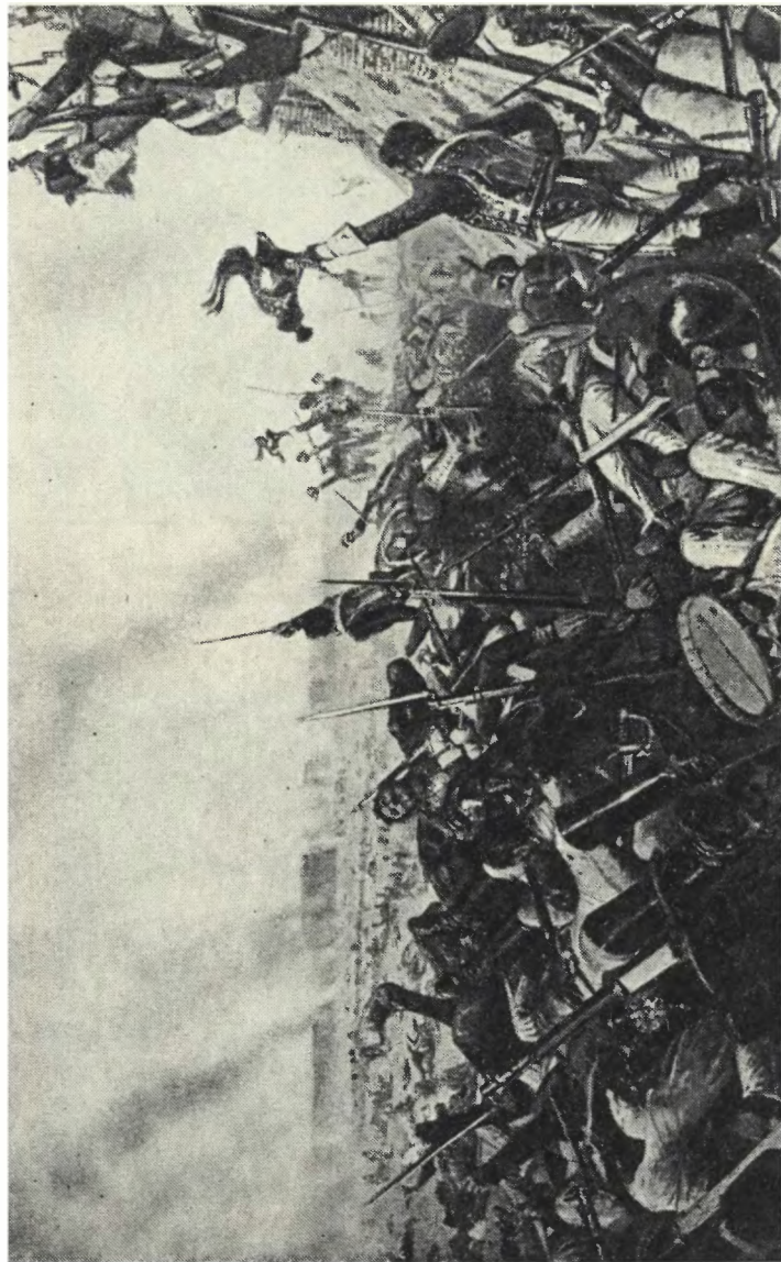
Конец Бородинского боя. Худ. В. В. Верещагин