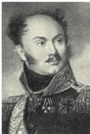
ОРЛОВ М. Ф. Худ. А. Ризенер. 1814