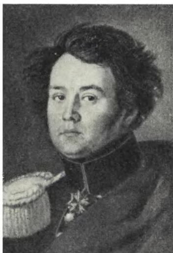
МУРАВЬЕВ А. З. Неизвестный художник. 20-е годы XIX в.