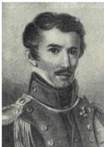
ЛУНИН М. С. Худ. П. Ф. Соколов. 1822