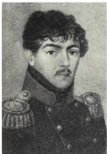
ДМИТРИЕВ-МАМОНОВ М. А. Неизвестный художник. 20-е годы XIX в.