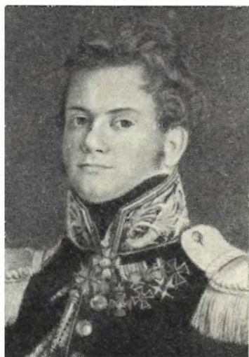
МУРАВЬЕВ А. Н. Неизвестный художник. 1816—1818