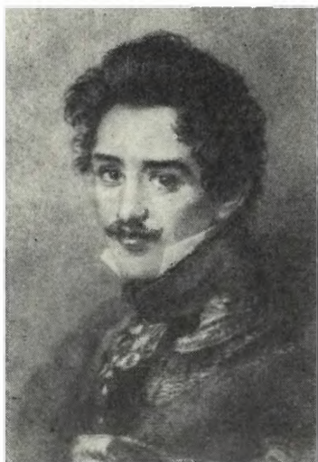
ВОЛКОНСКИЙ С. Г. Худ. В. Унгерн. 1817