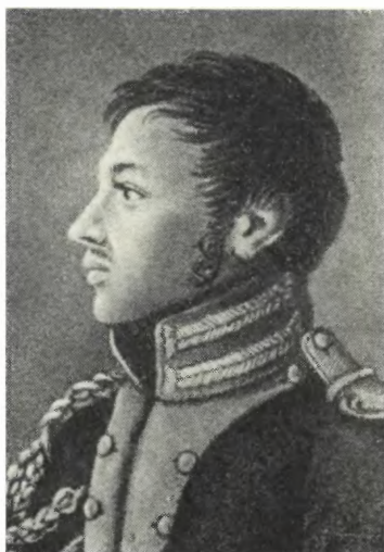
ПЕСТЕЛЬ П. И. Портрет работы матери декабриста. 1813