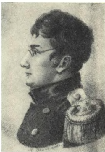
БАТЕНЬКОВ Г. С. Худ. К. Зеленцов. 1822