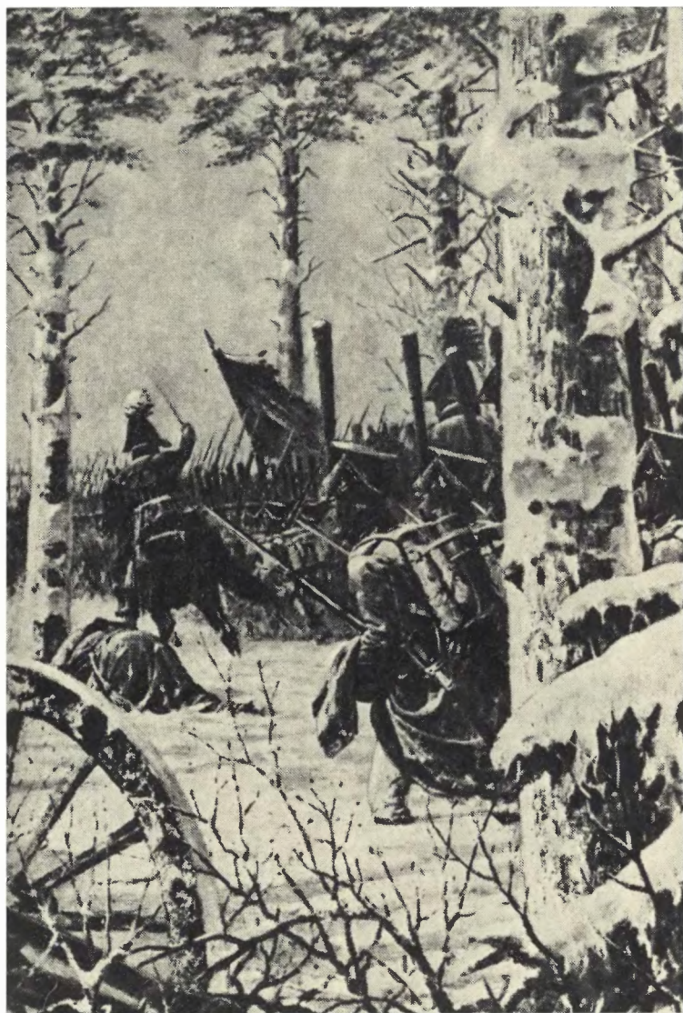
Битва под Красным. Худ. В. В. Верещагин