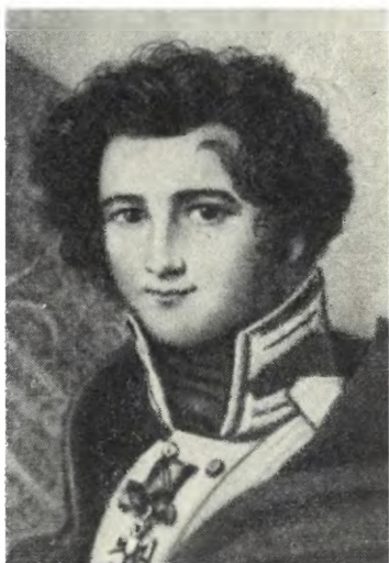
ЛОПУХИН П. П. Неизвестный художник. 20-е годы XIX в.