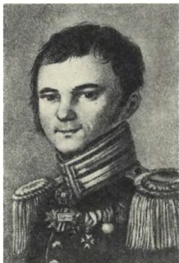
ГЛИНКА Ф. Н. Худ. К. Афанасьев. 1825