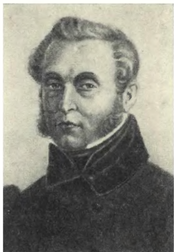
ПОВАЛО-ШВЕЙКОВСКИЙ И. С. Худ. Н. А. Бестужев. 1839