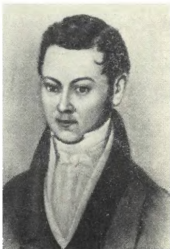
БУЛАТОВ А. М. Неизвестный художник. 20-е годы XIX в.