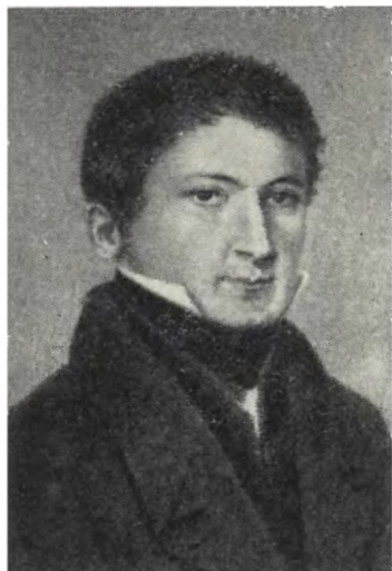
МУРАВЬЕВ-АПОСТОЛ М. И. Худ. Н. Уткин, 1823—1824