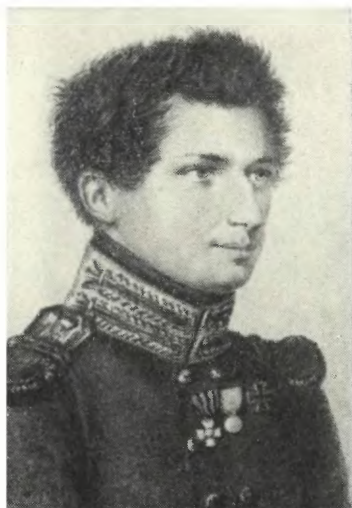
ЯКУШКИН И. Д. Худ. Н. Уткин. 1816