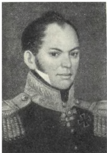
ФОНВИЗИН М. А. Неизвестный художник. Начало 20-х годов XIX в.