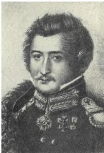
МУРАВЬЕВ-АПОСТОЛ С. И. Худ. Н. Уткин, 1819