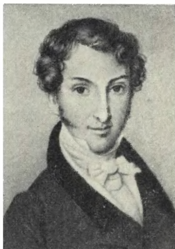
ТРУБЕЦКОЙ С. П. Неизвестный художник. 1819—1820