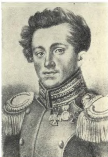
БРИГГЕН А. Ф. Неизвестный художник. 20-е годы XIX в.