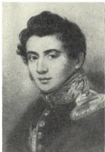
МУРАВЬЕВ П. М. Худ. П. Ф. Соколов. 1824