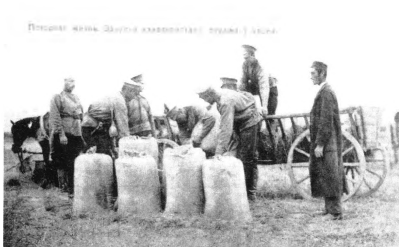
Открытие конца XIX—начала XX в. «Походная жизнь. Закупка кавалеристами фуража у еврея».