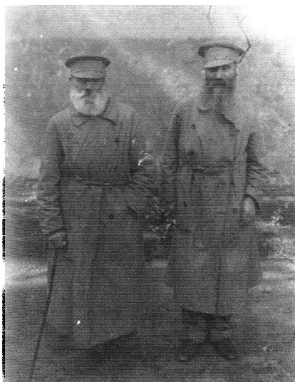
Старые кантонисты в Еврейской богадельне им. М.А. Гинсбурга. СПб., 5-я Линия В.О., д. 50. 1914 г.