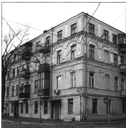
Киев, ул. Межигорская 3/7. В одной из квартир этого дома размещалась солдатская молельня.

Кн. Псалмов 116. 16» (В Синадальной Библии – Пс. 83: 8 и 115:6).