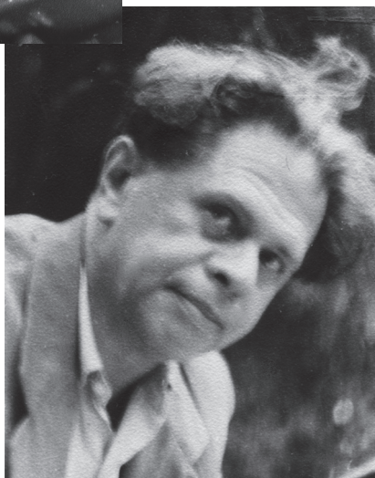
Л. Е. Пинский. (1959)