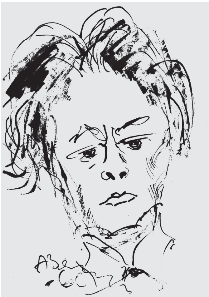
А.Т. Зверев. Портрет Л.Е. Пинского. Тушь (1966)