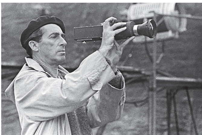
Г. М. Козинцев на съемках фильма «Гамлет» (1964)