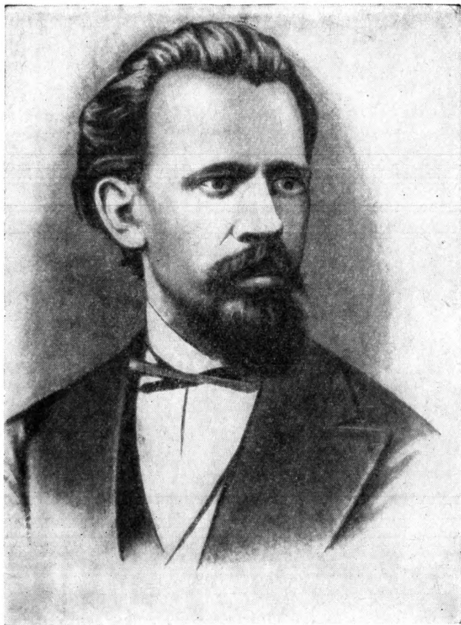
И. Н. Мышкин. Одно из двух сохранившихся изображений