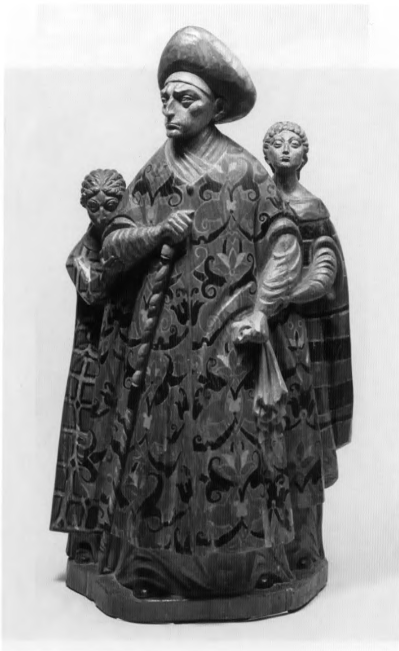
Д.С. Стеллецкий. Знатная боярыня (Марфа Посадница). Полихромное дерево. 1910 г.