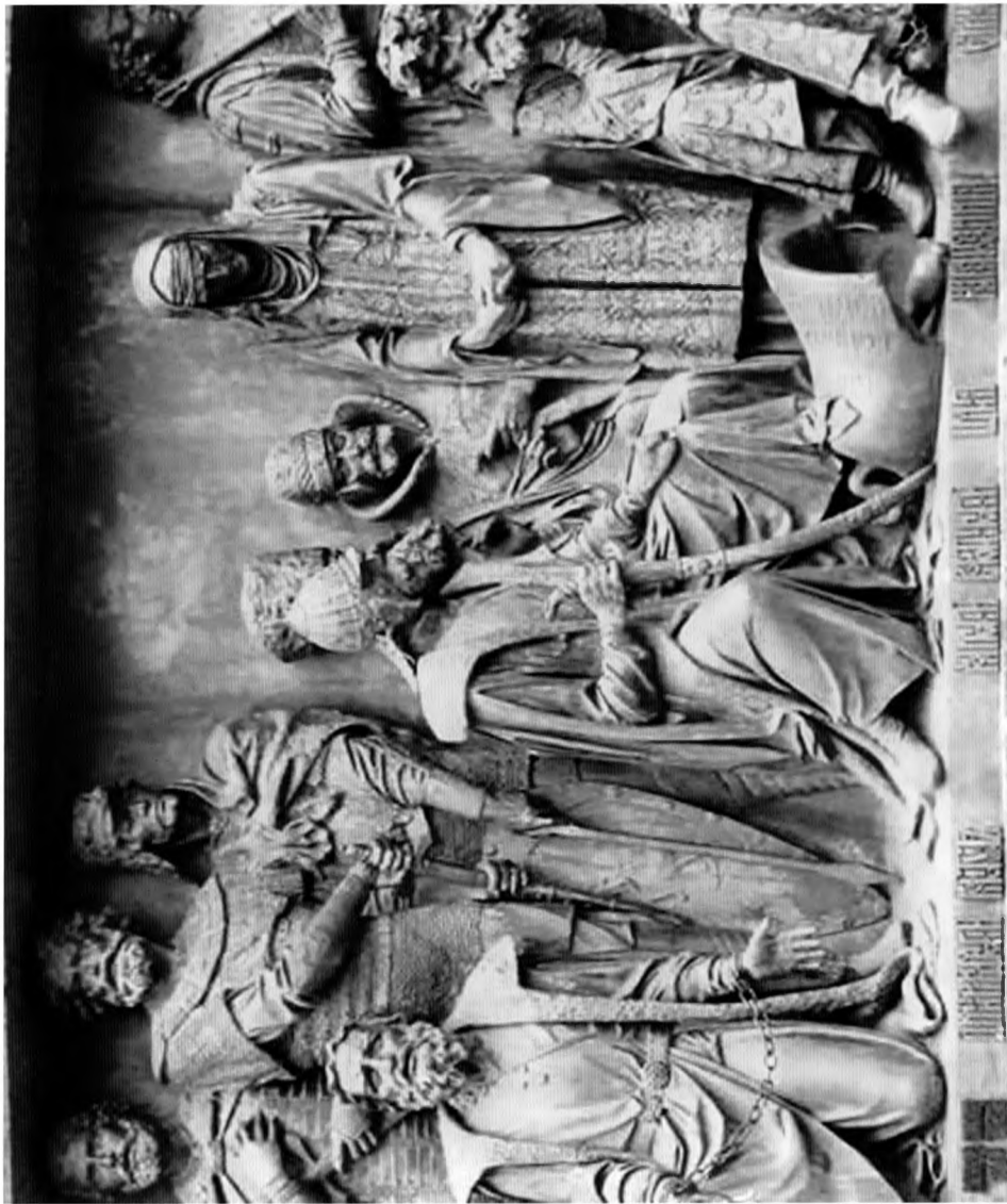
М.О. Микешин. Фрагмент памятника «Тысячелетие России» в Новгороде. Скульпторы М.А. Чижов и А.М. Любимов. 1862 г.