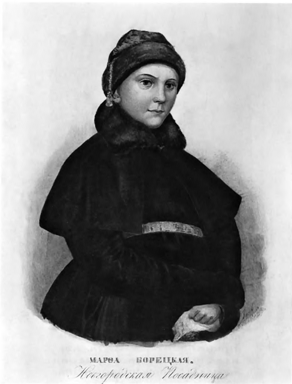
А. Гусев. Марфа Борецкая. Новгородская Посадница. Бумага, акварель. 1875 г.