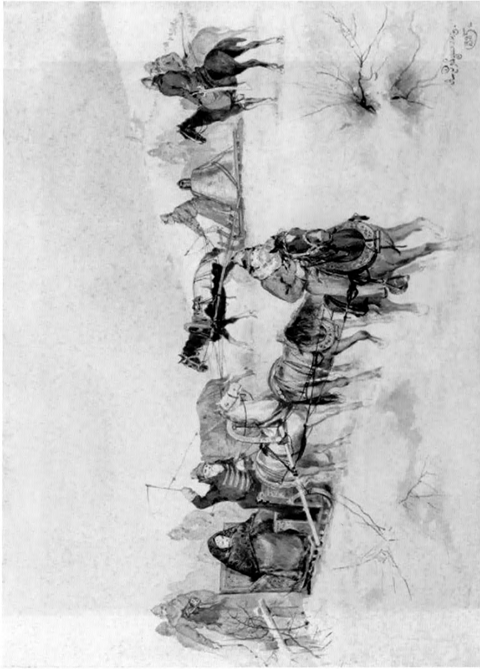
А.П. Рябушкин. Поезд Марфы Посадницы и вечернего колокола. 1885 г.