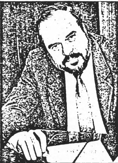
Фото Э. Кудрявického

Мемуарная «Недописанная книга» В.Бакатина явно должна быть дополнена главой о четырехмесячном пребывании автора на постах председателя КГБ СССР и руководителя Межреспубликанской службы безопасности (МСБ), предшествовавшем его отставке 19 декабря 1991 года, что внешне производило впечатление «простых» кадровых перетасовок в чекистской иерархии.