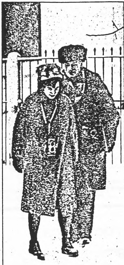
Филби с женой в Москве

Гарольд (Ким) Филби был рожденным разведчиком; чье имя сохранится в истории секретных служб. С 1939 года он служил в британской разведке, успешно делая карьеру. В отличие от своих товарищей он не был гомосексуалистом и скрывал коммунистические убеждения. Он, несомненно, наслаждался своей ролью человека, который водит за нос крупнейшую разведку мира, и дорожил похвалами, отпускаемыми ему в КГБ. Он достиг вершины своей карьеры в 1945-м, возглавив отдел, работающий против Советского Союза.