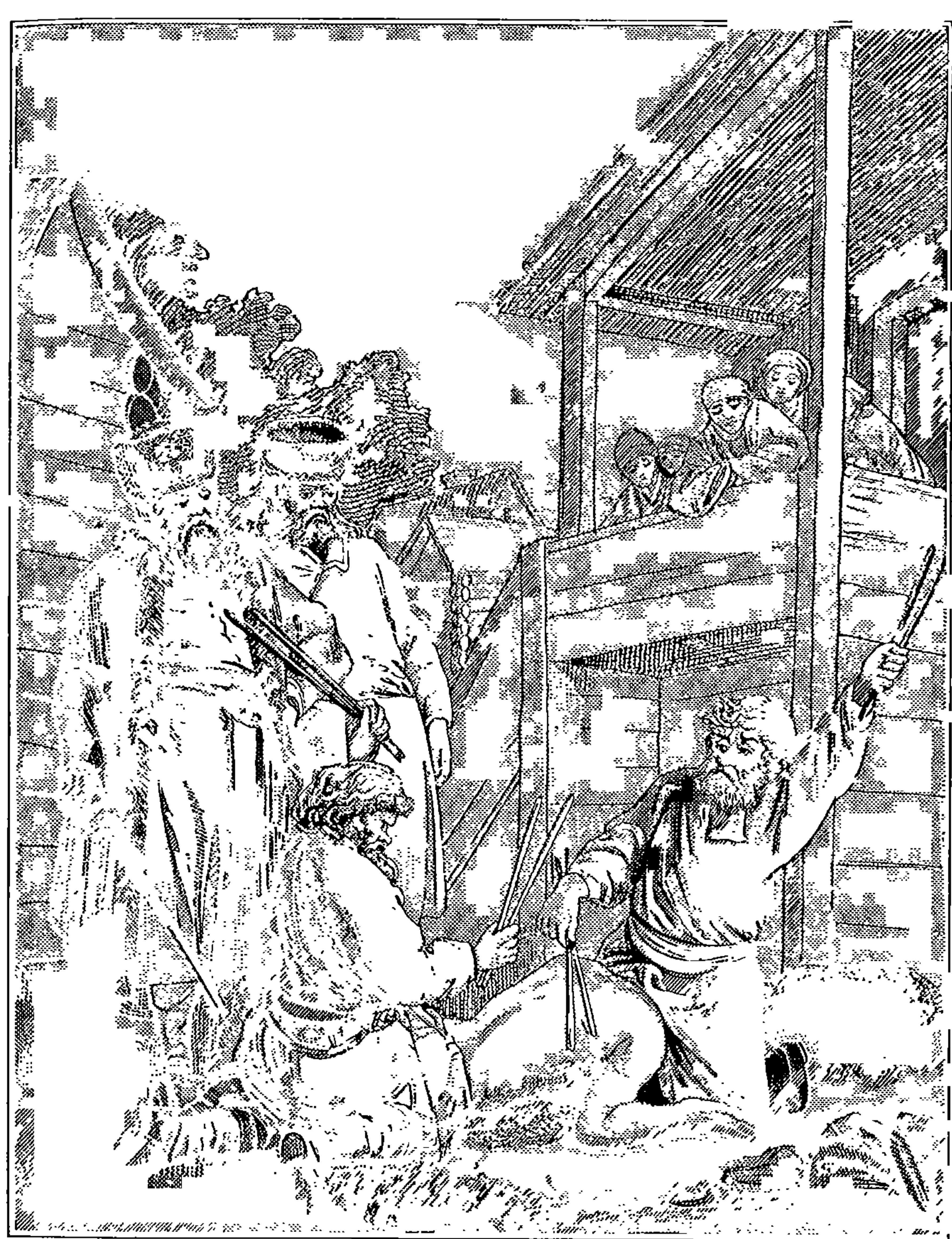
НАКАЗАНИЕ БАТОГАМИ ВЪ РОССІИ ВЪ XVIII ВѢКѢ.