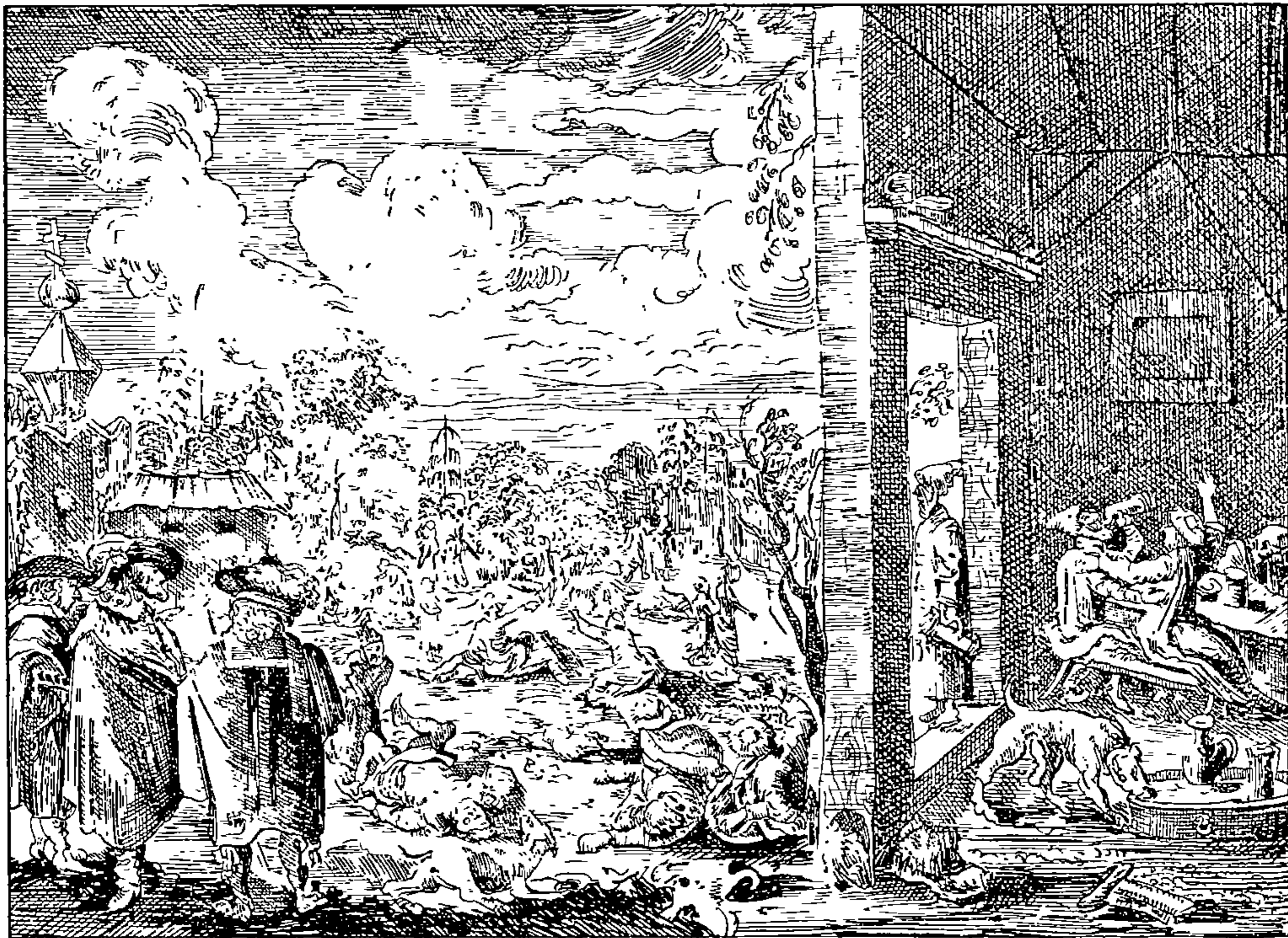
СЦЕНЫ ВЪ КАБАКѢ И ПЕРЕДЪ КАБАКОМЪ