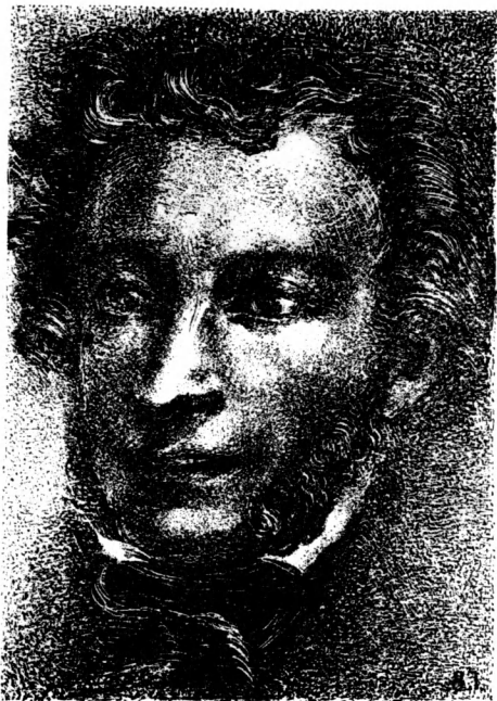
А. С. ПУШКИН Автолитография Г. А. Васильева