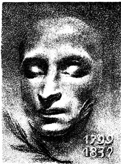
МАСКА А. С. ПУШКИНА Автолитография Г. А. Васильева