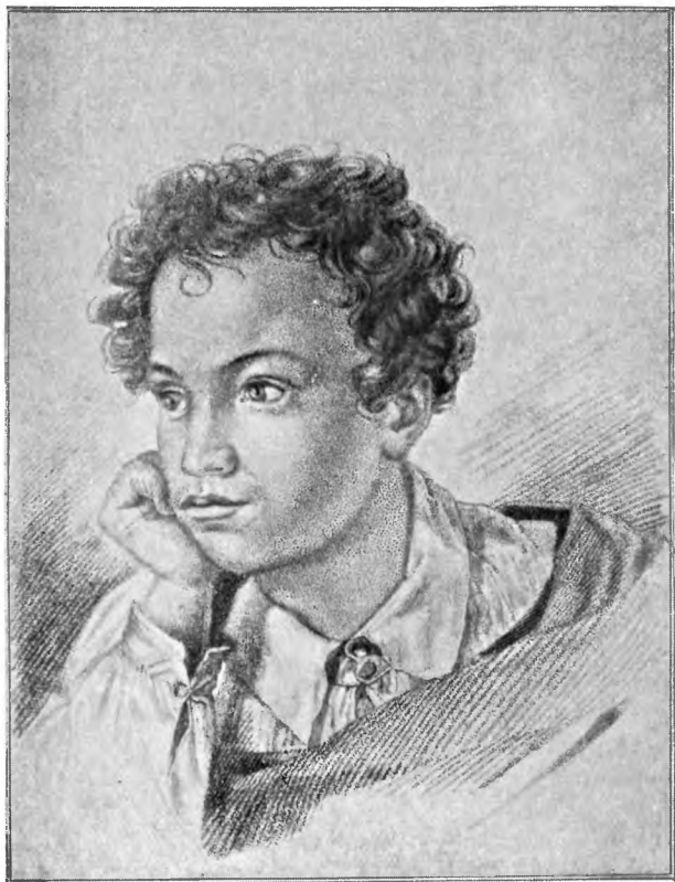
А. С. ПУШКИН. Гравюра Е. Гейтмана. 1822 г.